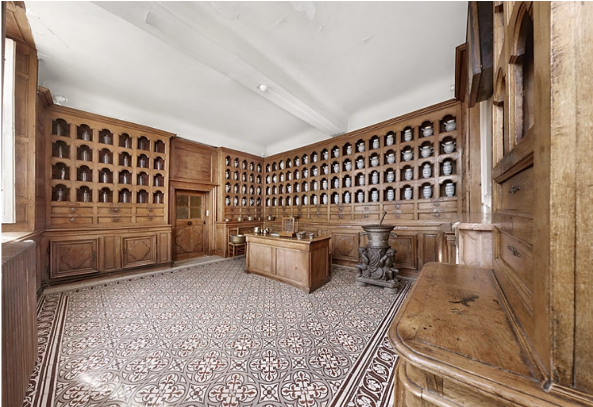
Vue d'ensemble (en 2010).

21, Seurre, 14 rue du Faubourg Saint-Georges