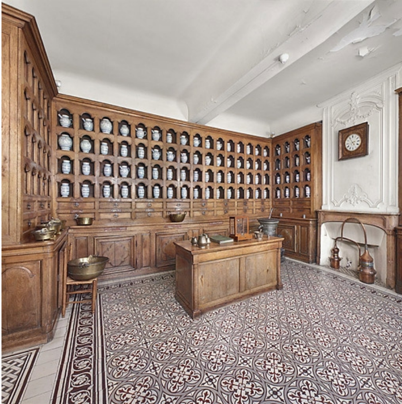
Vue d'ensemble (en 2010).

21, Seurre, 14 rue du Faubourg Saint-Georges