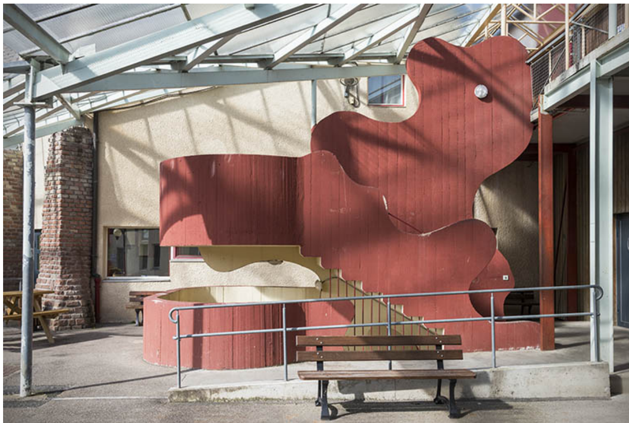
Vu de la place, escalier desservant le foyer.