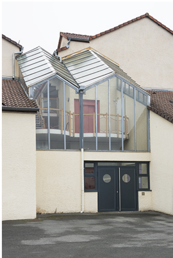
Détail de la façade sud de l'externat sud-est bordant la rue du bocage.