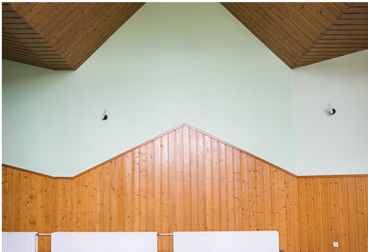
Détail intérieur dans la cantine.