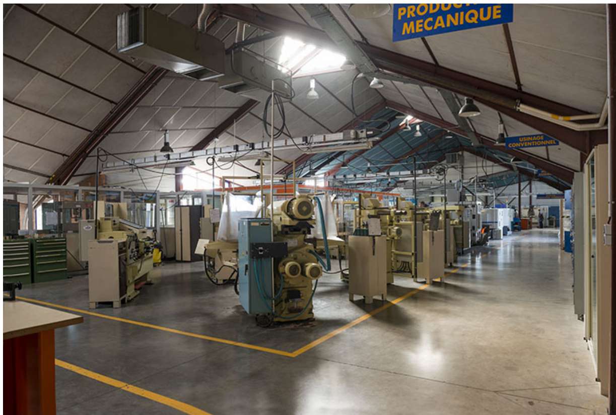
Dans les ateliers de mécanique.