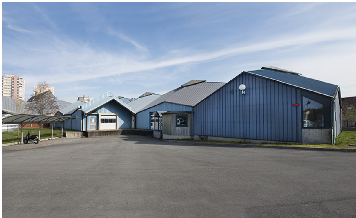
Façades postérieures ouest des ateliers de mécanique.