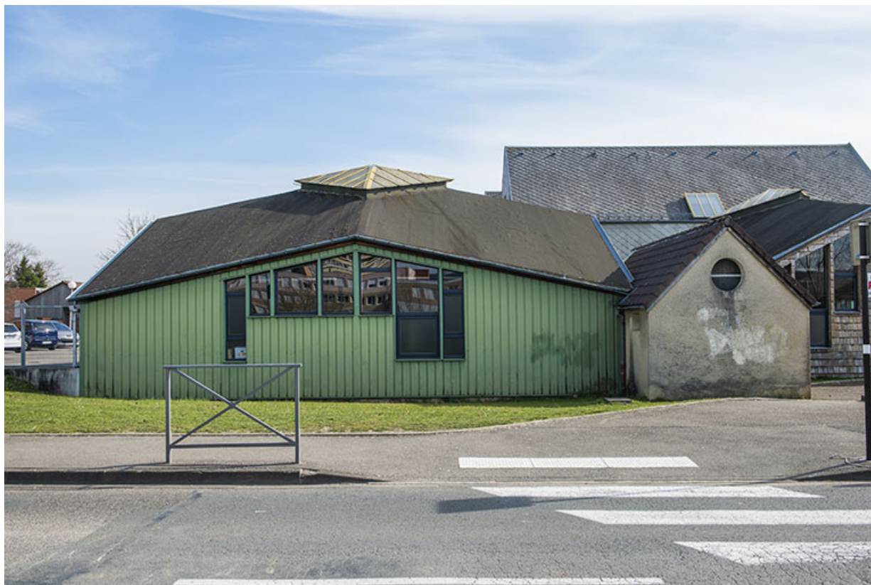
Vue des façades nord des ateliers entre les deux entrées de la rue d'Alembert.