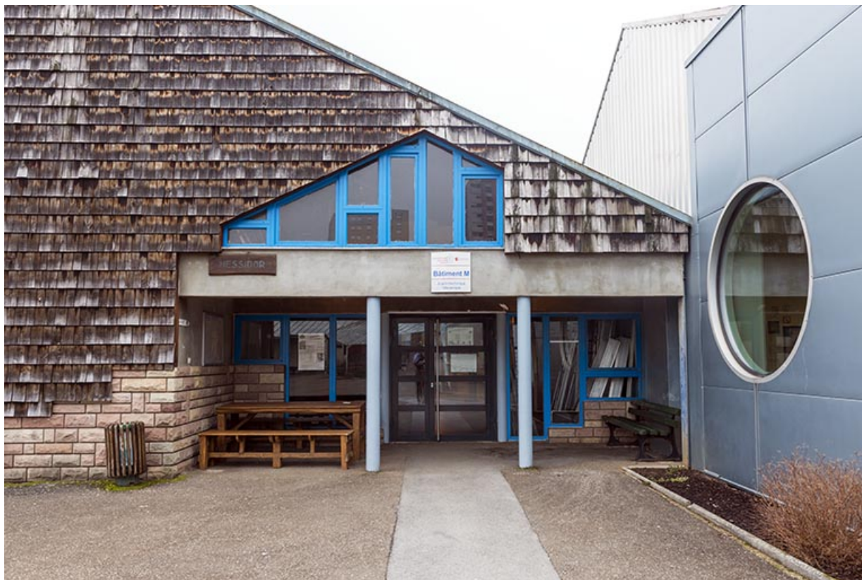
Bavilliers, lycée Denis Diderot : entrée de l'atelier messidor.