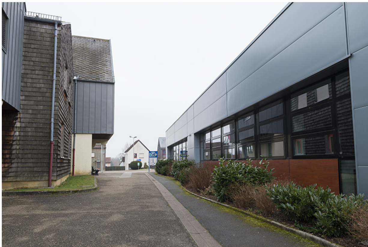
Depuis le nord, vue entre le bâtiment d'externat et les ateliers, face à la place.