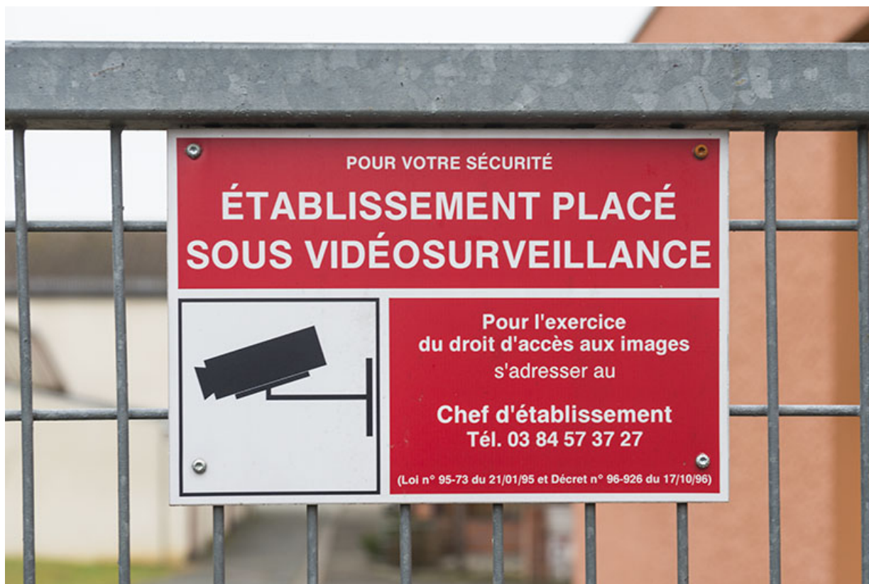
Détail de signalétique intérieure.