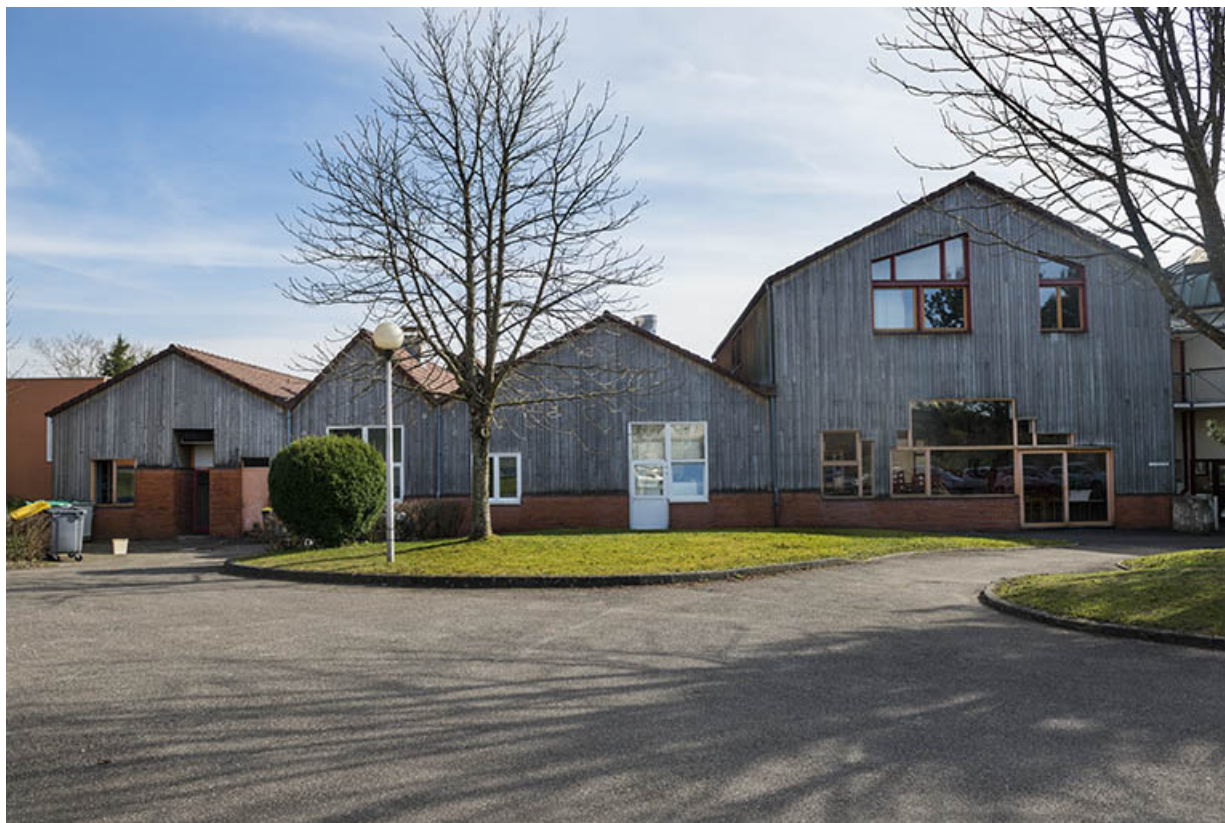
Pignons nord de la restauration.