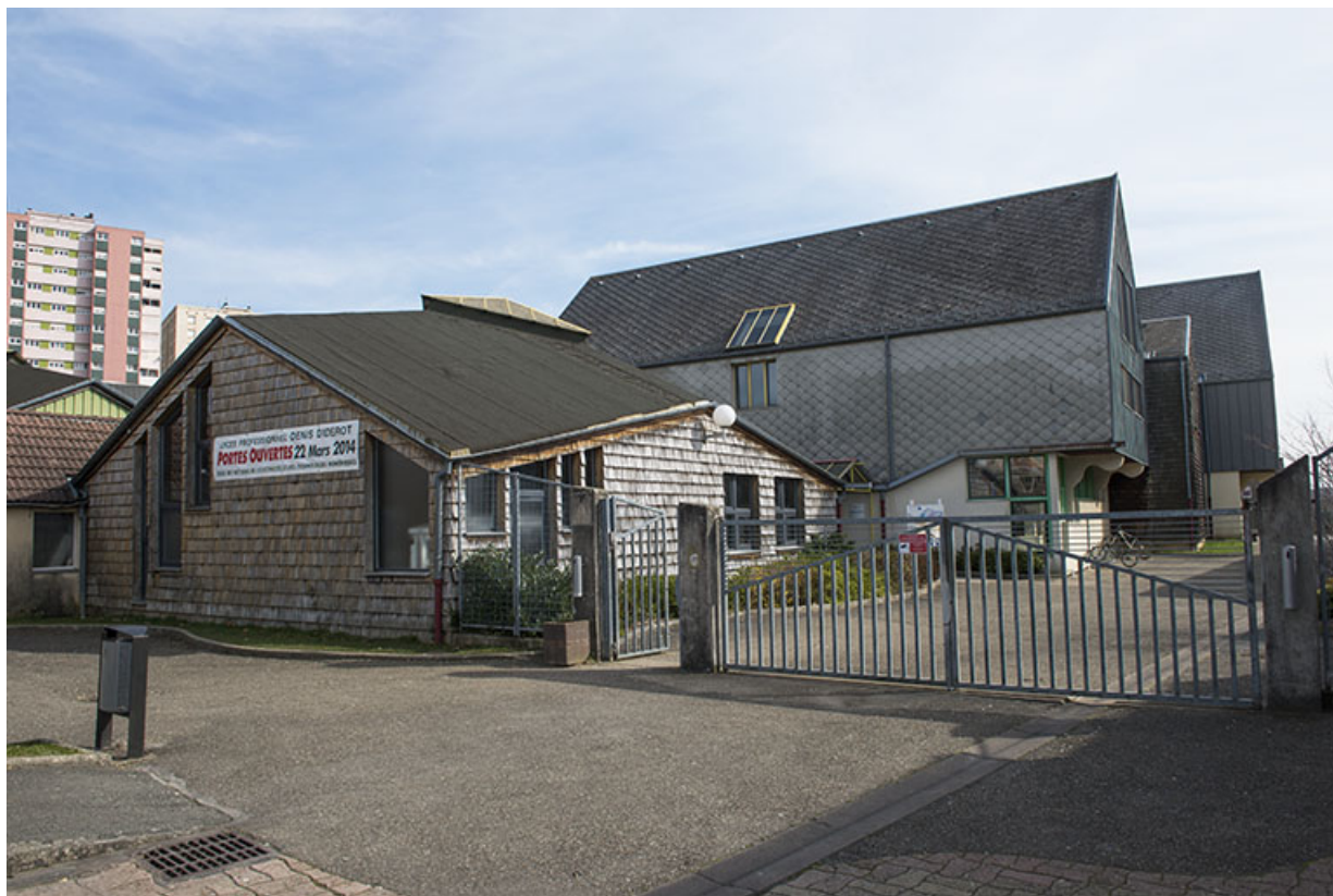
Entrée nord- ouest de la rue d'Alembert, donnant sur la place via la rue vers le nord.