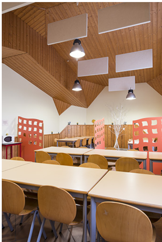
Détail de vue intérieure de la cantine.