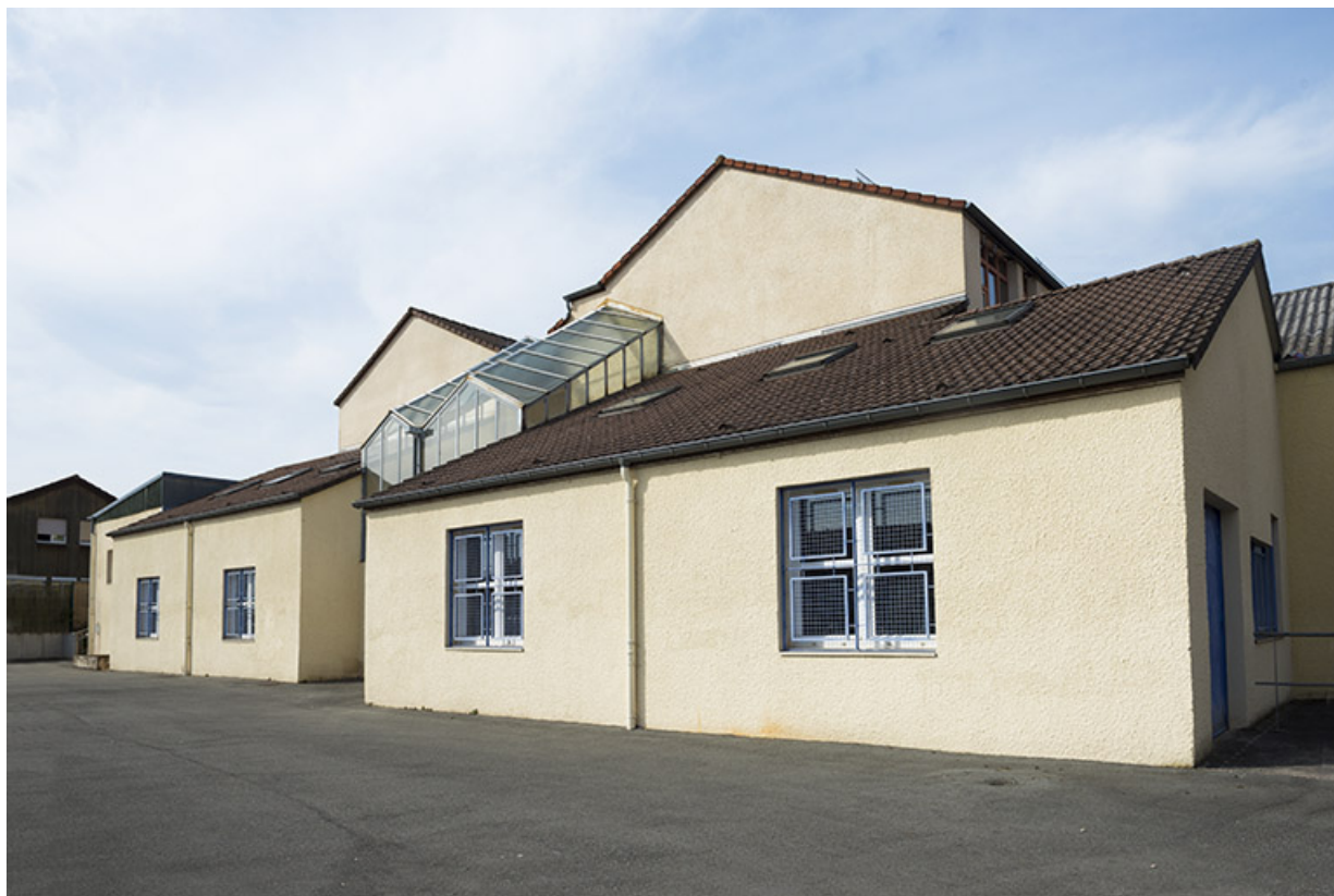
Façade sud de l'externat sud-est bordant la rue du bocage.