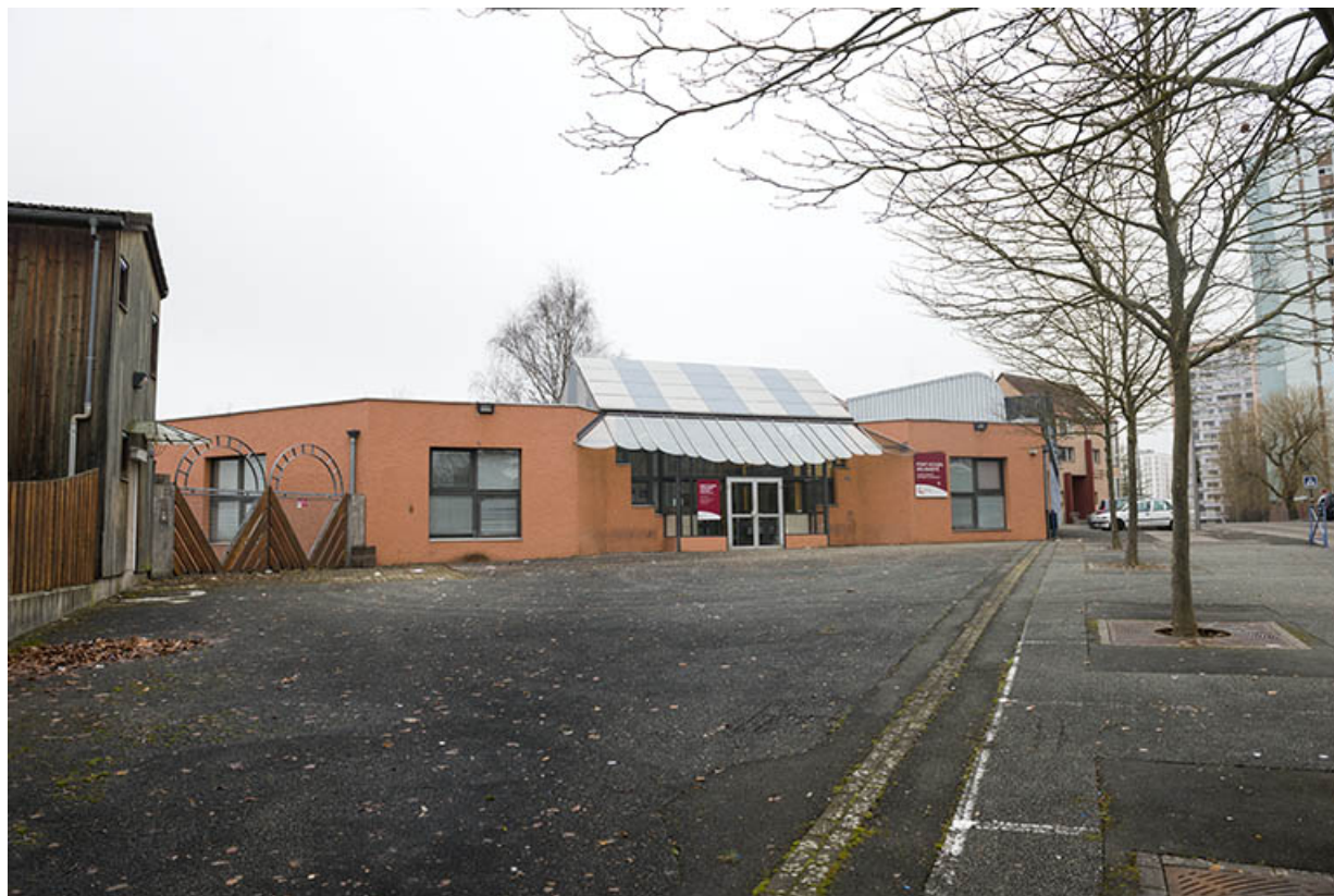
Vue sur l'entrée depuis la rue de Zaporozje à l'est.