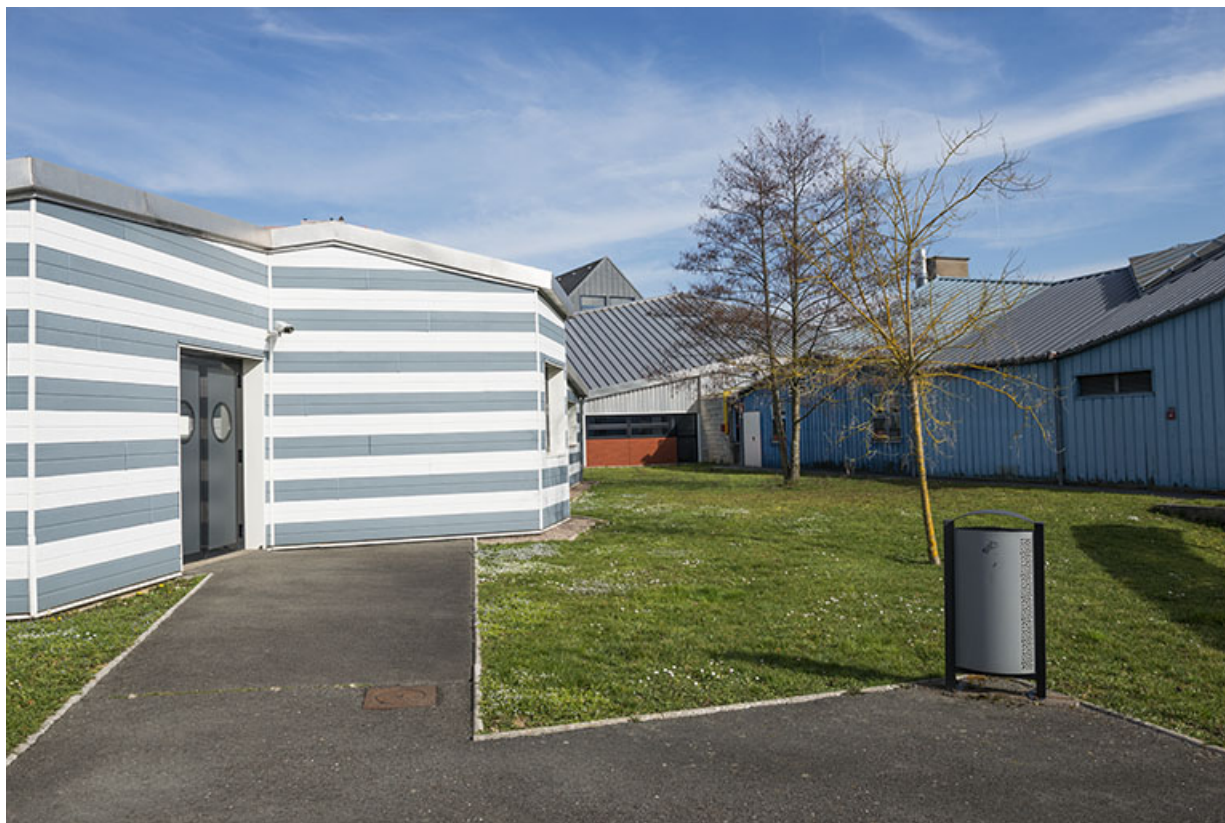
Cour engazonnée à l'ouest autour de laquelle sont disposés des ateliers de mécanique.