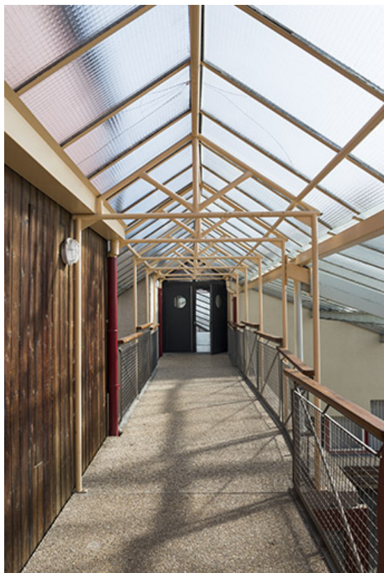
Liaison couverte au dessus du foyer.