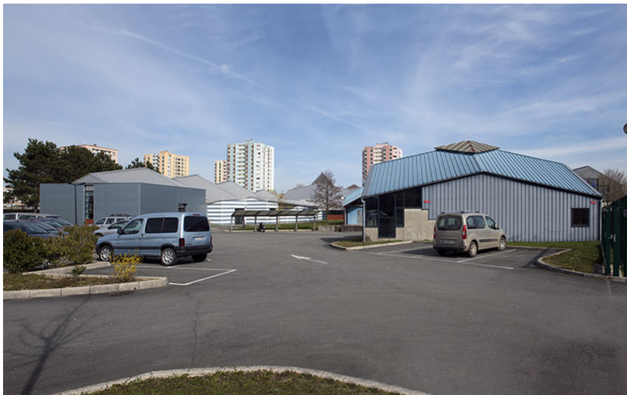
Aire de stationnement ouest et façades postérieures ouest des ateliers de mécanique.