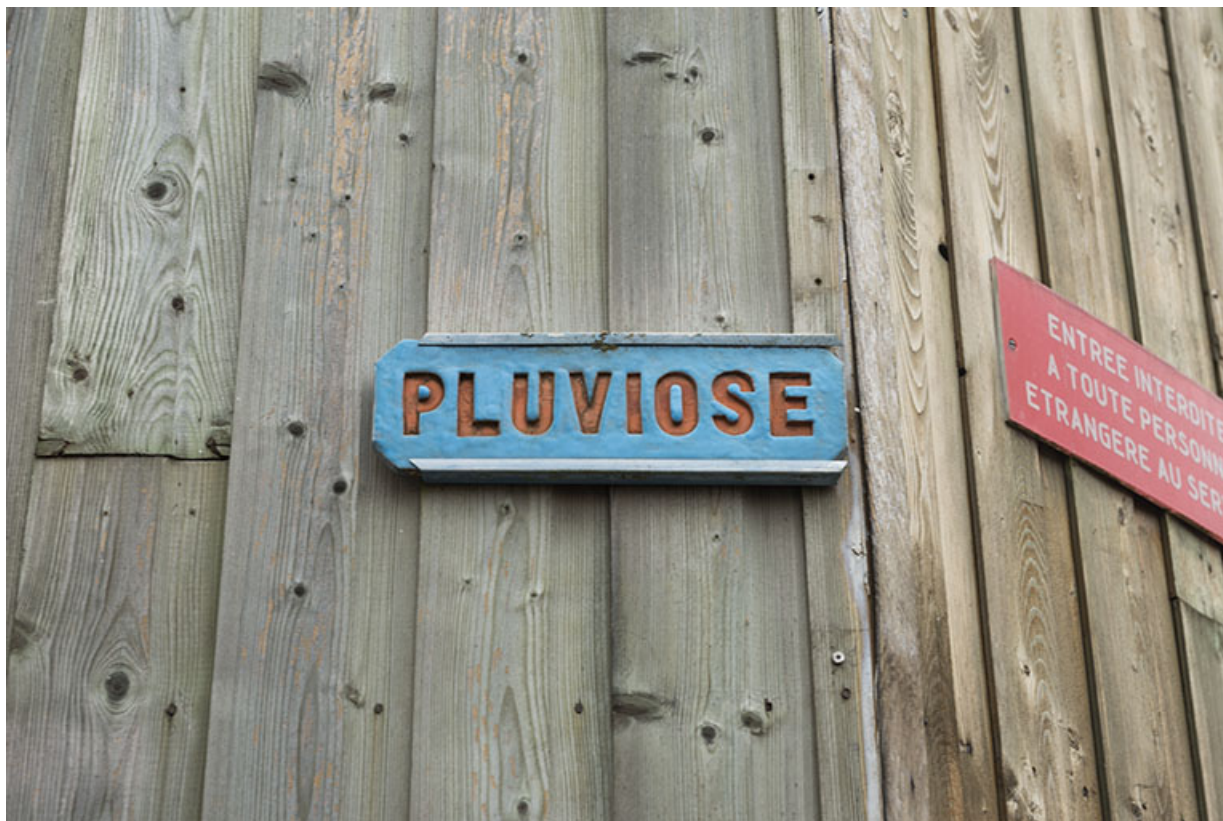
Détail de signalétique intérieure.