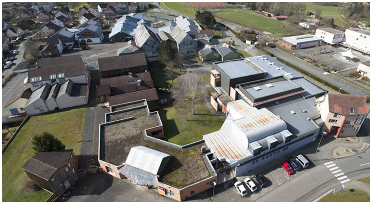
Vue d'ensemble depuis un étage supérieur de l'immeuble d'en face.