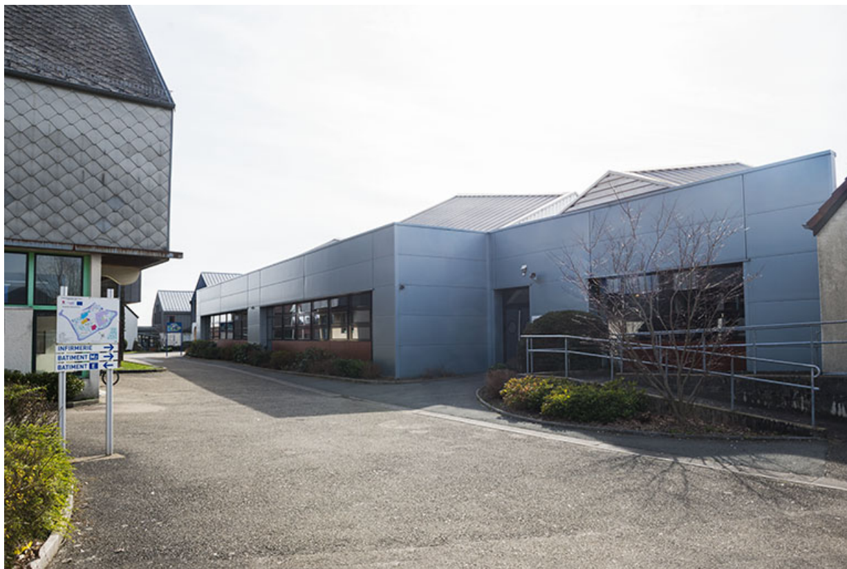
Façade est des ateliers mécaniques vue depuis le nord.