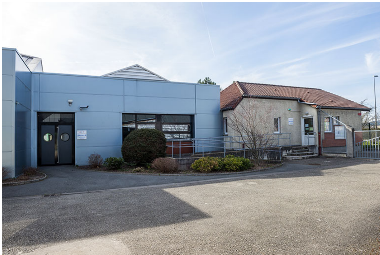
Façade est de l'atelier et angle nord-est de l'infirmerie, à l'entrée nord-ouest de la rue d'Alembert. 90, Baviillers rue d' Alembert