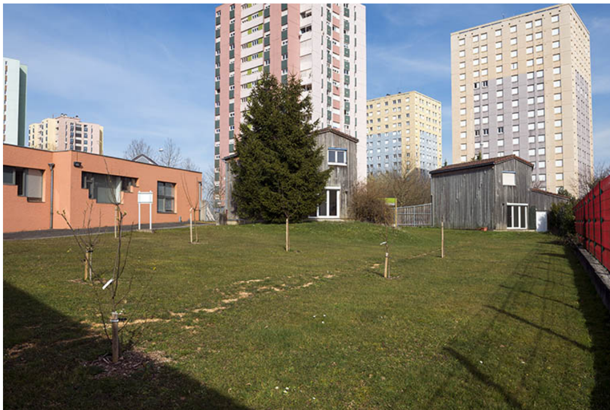
Façades postérieures des logements de fonction orientaux.