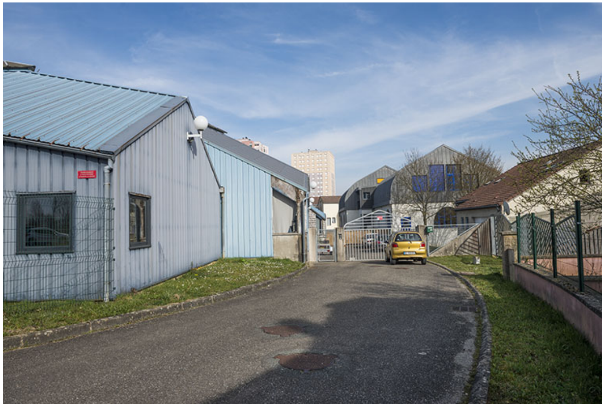
Vue de l'ouest, l'entrée sud-ouest, entre les ateliers et le logement de fonction.