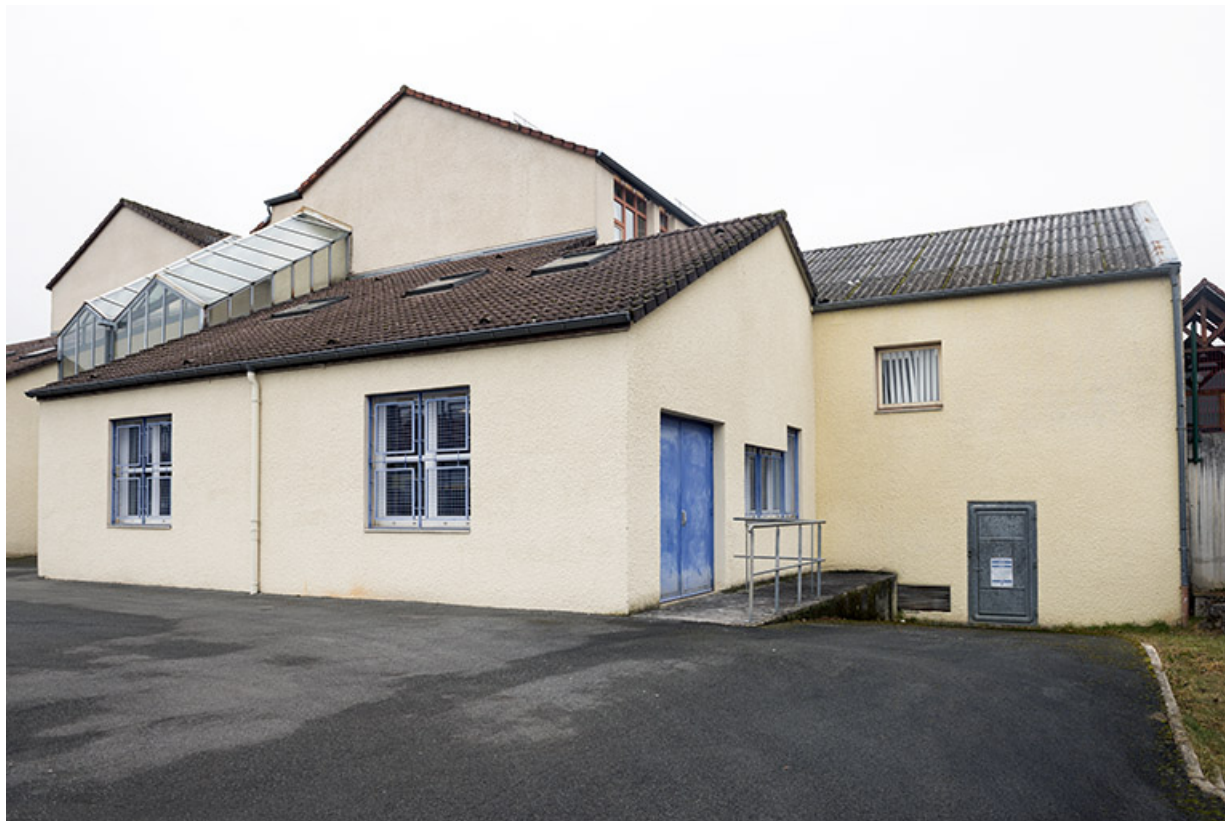
Façade sud de l'externat sud-est bordant la rue du bocage.