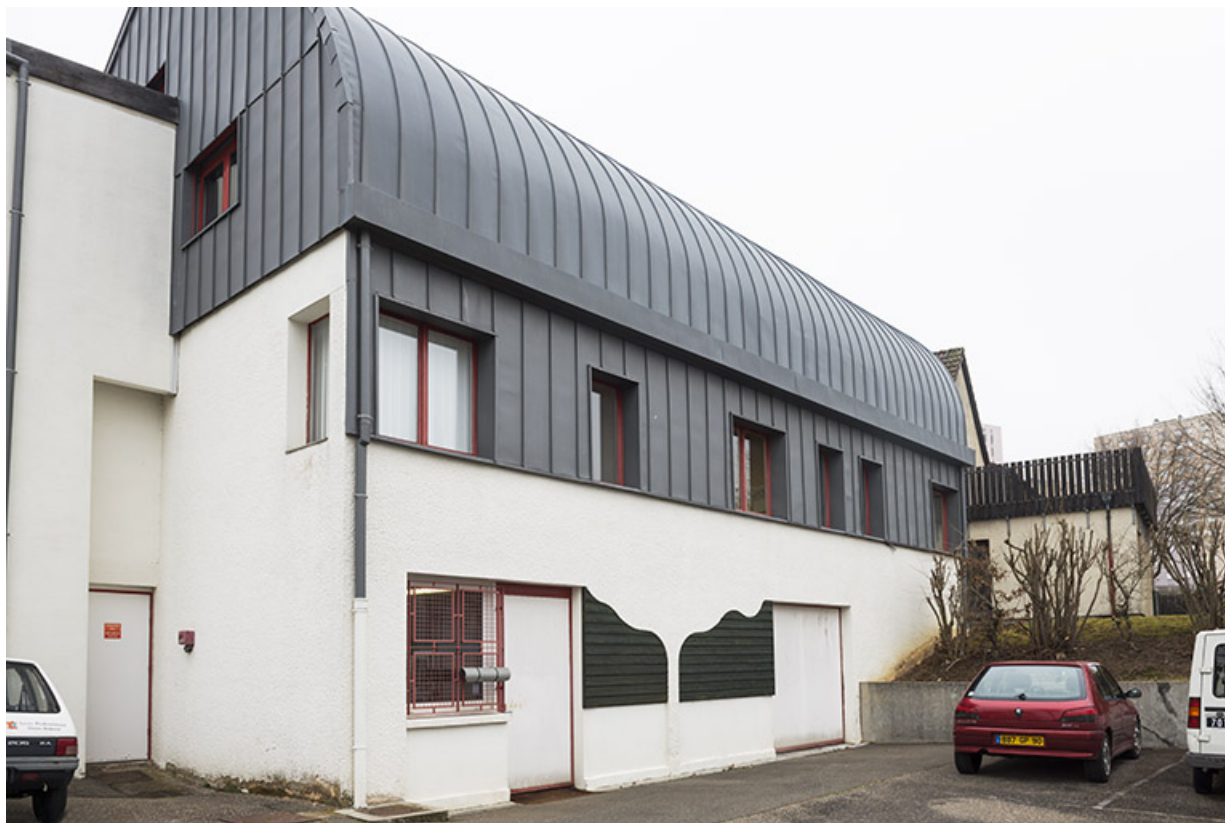
Vue de trois-quart ouest postérieure - sud - du bâtiment de l'administration.