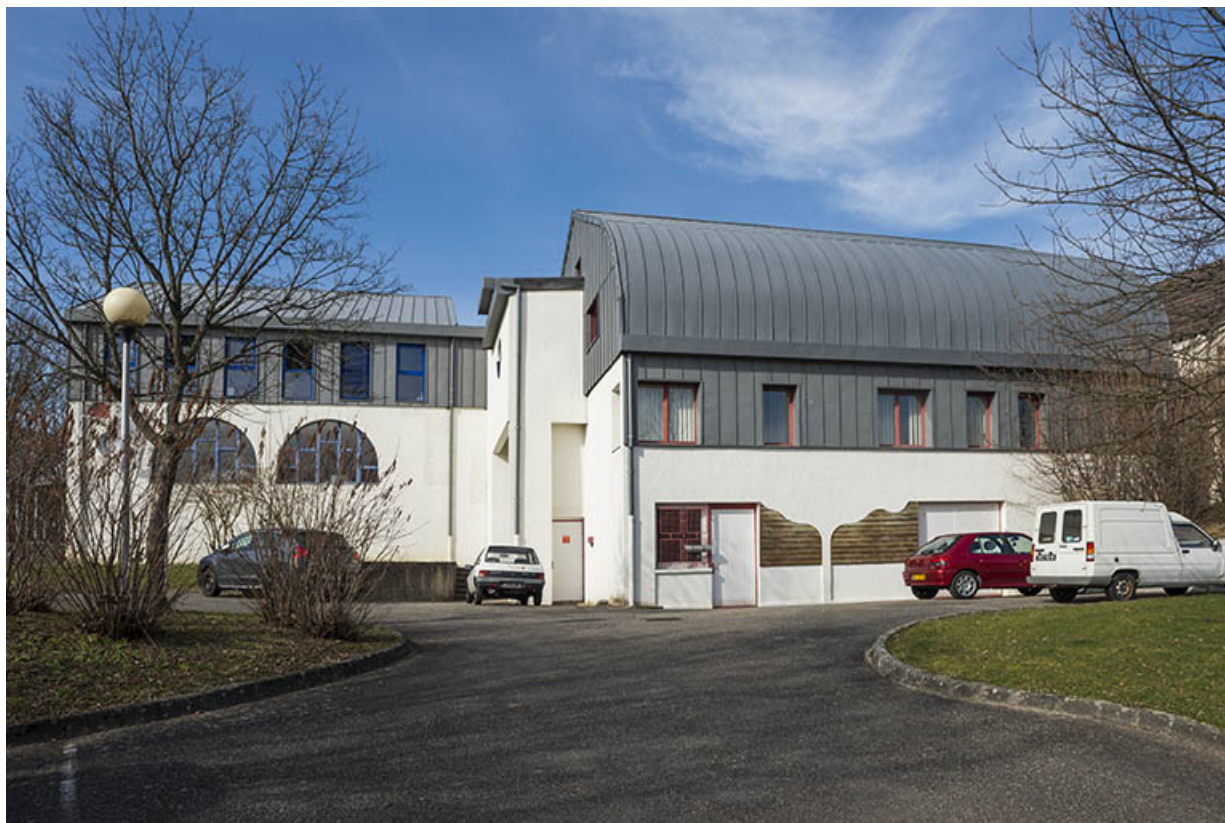
Façades sud de l'administration.