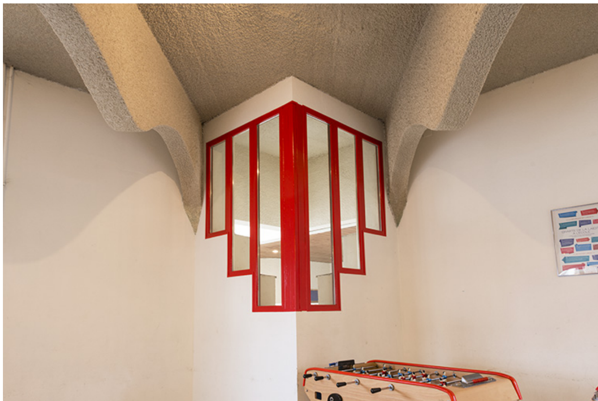
Détail de vue intérieure du foyer.