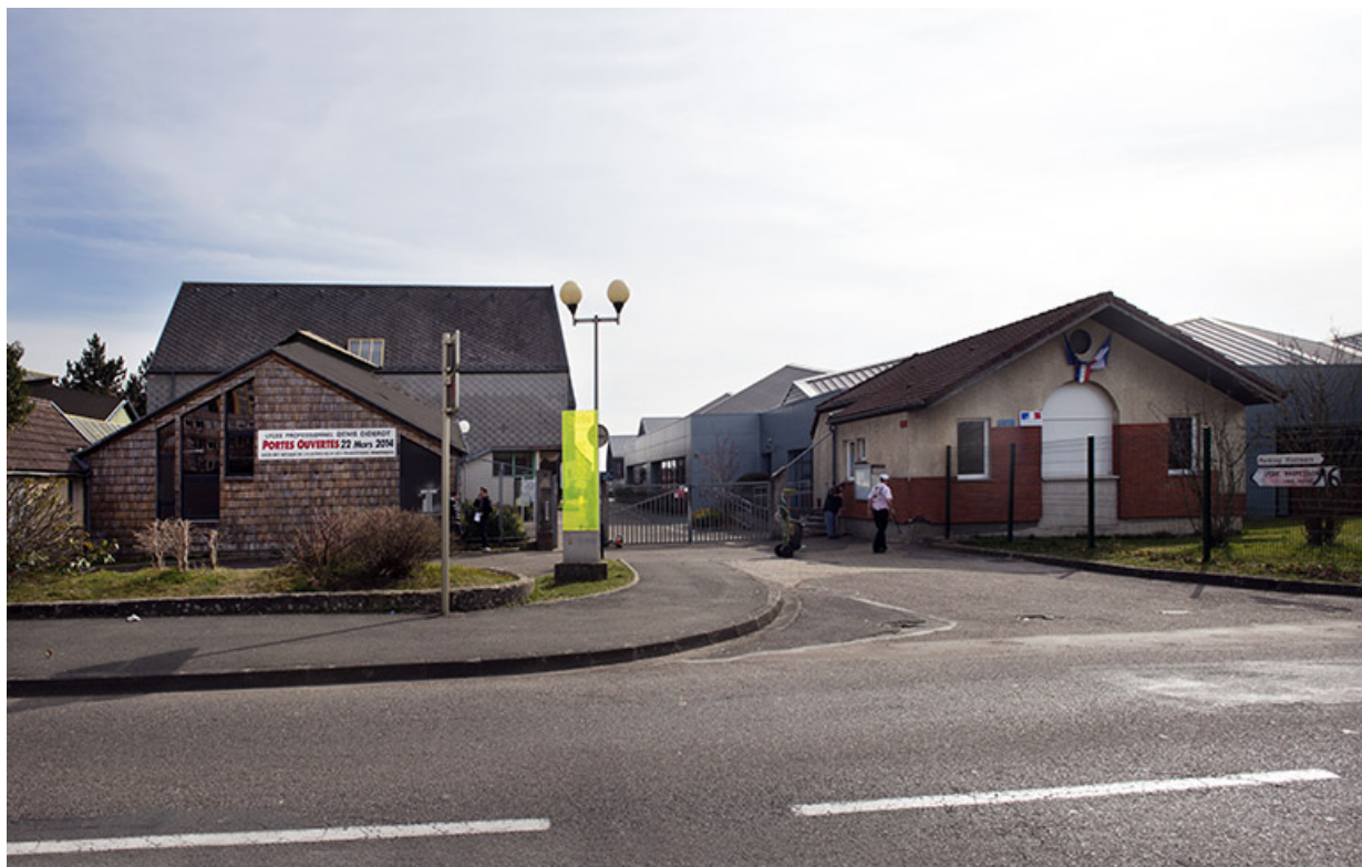
Entrée nord-ouest de la rue d'Alembert, donnant sur la place, via la rue vers le nord.