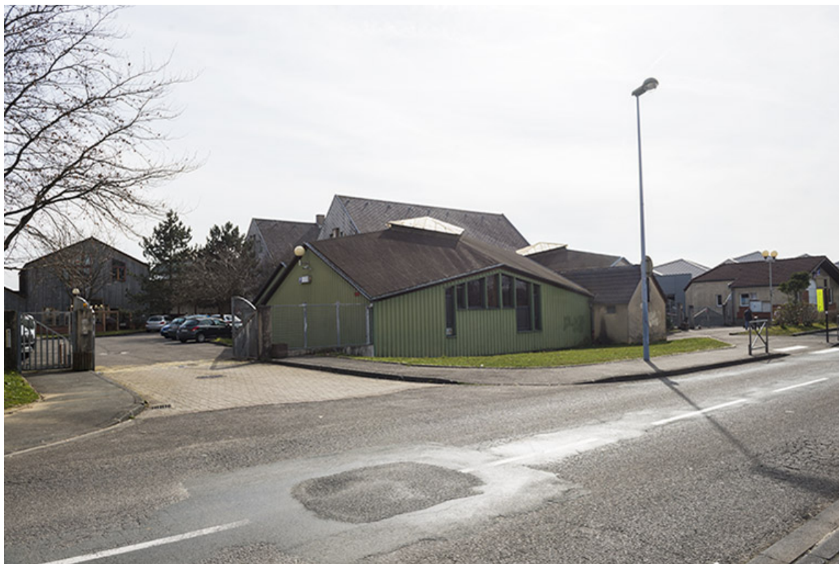
Vue des façades nord des ateliers depuis l'entrée nord-est de la rue d'Alembert.