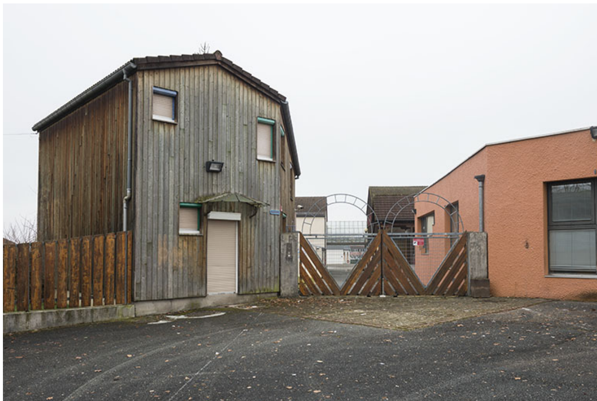
Vue sur l'entrée depuis la rue de Zaporojie à l'est.