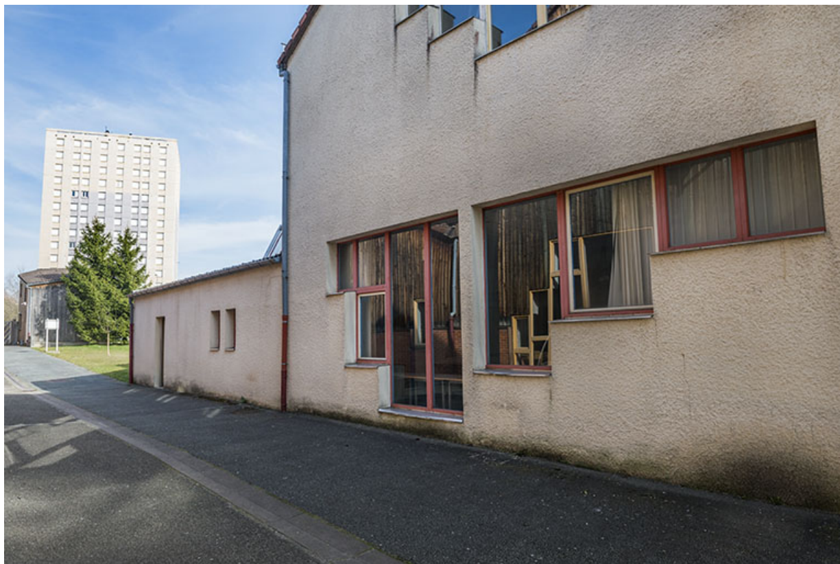
Façade nord de l'externat, sur la rue intérieure vers l'est, donnant rue de Zaporojie. 90, Baviillers rue d' Alembert