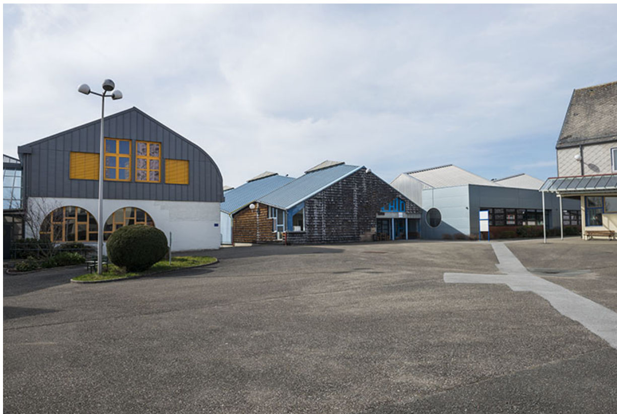
Bâtiments d'administration et ateliers bordant la place à l'ouest.