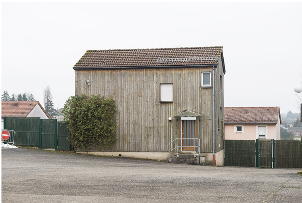
Vue de face de la façade antérieure du logement au sud de la cour.