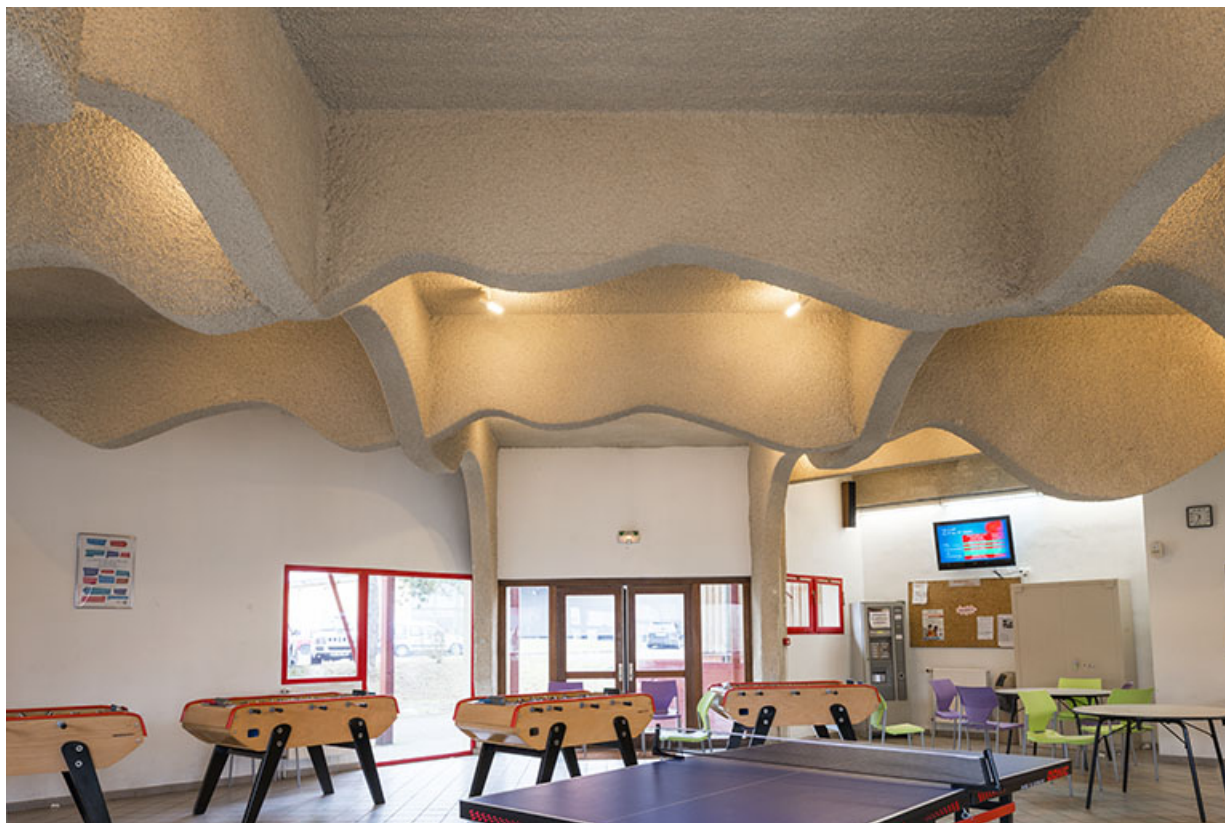
Détail de vue intérieure du foyer.