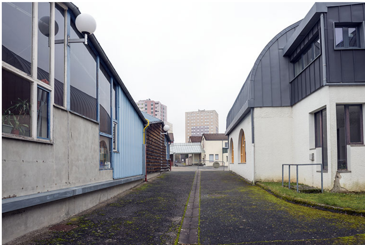
Depuis l'ouest, vue entre le bâtiment d'administration et les ateliers, face à la place.