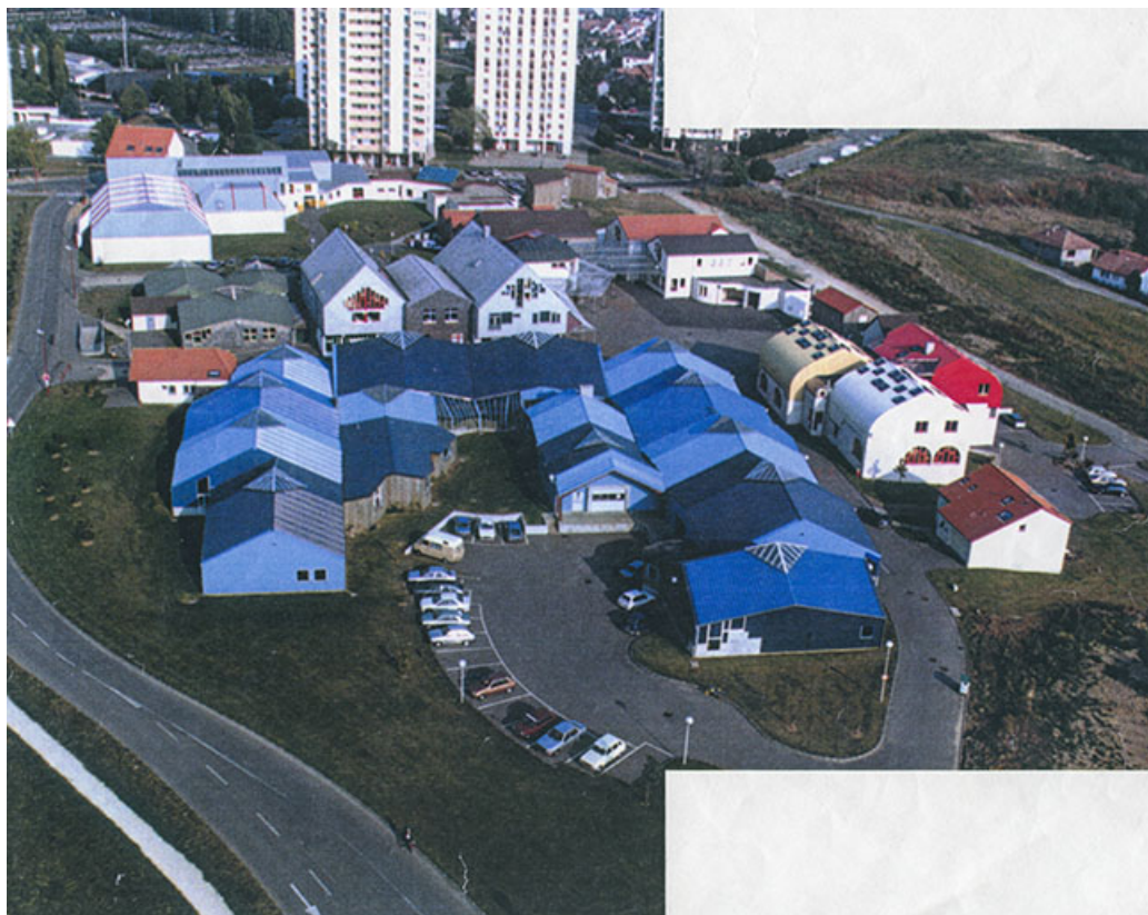
Vue aérienne (sans date). 90, Bavilliers rue d' Alembert