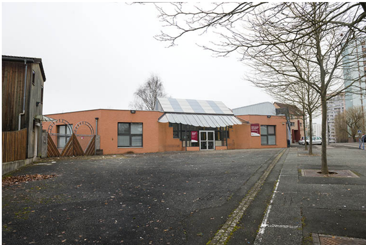
Vue sur l'entrée depuis la rue de Zaporojie à l'est.