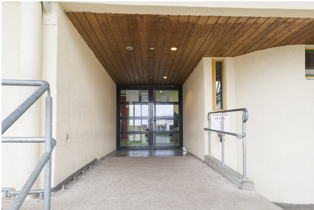
Détail de l'entrée du bâtiment abritant la vie scolaire.