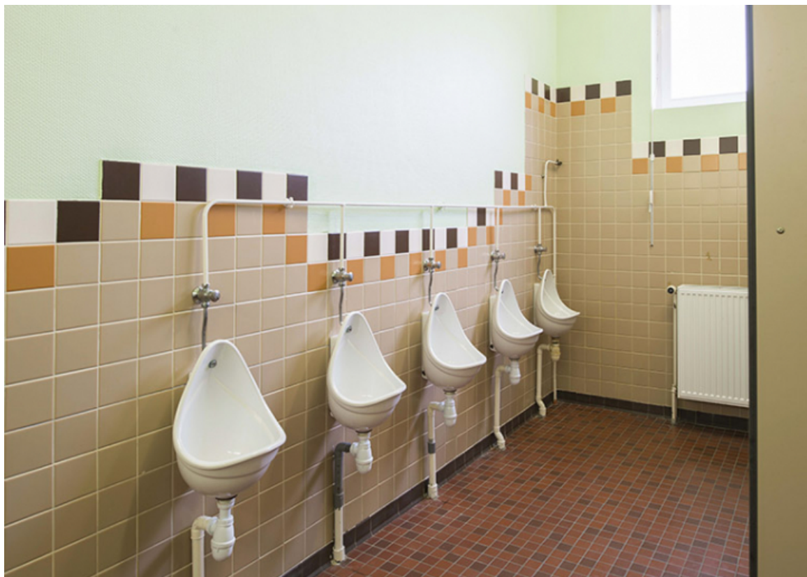
Détail intérieur dans la cantine.