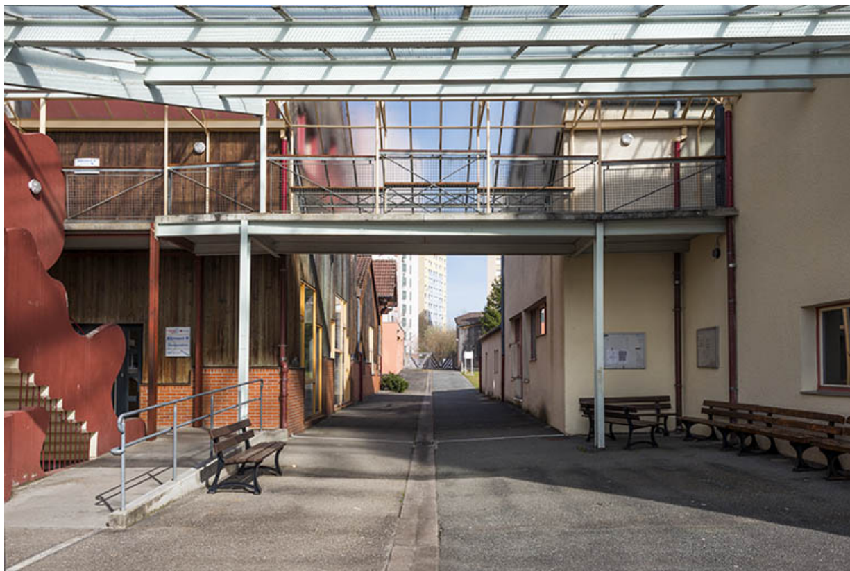
Rue intérieure vers l'est, donnant rue de Zaporojie.