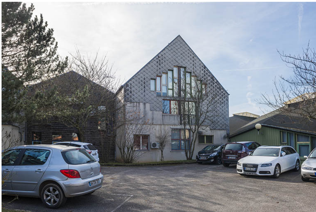
Façades postérieures est des externats du nord.