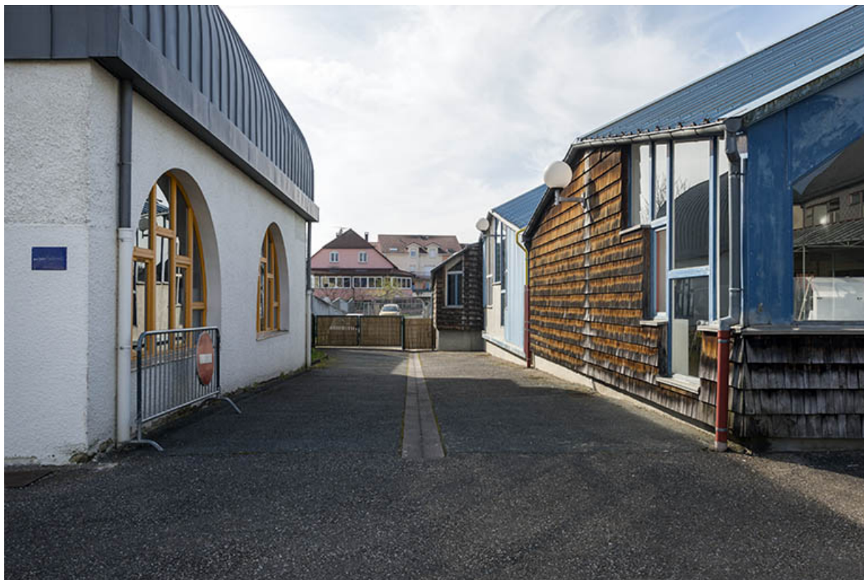
Vu depuis la place, l'axe intérieur vers l'ouest, entre le bâtiment d'administration et les ateliers.