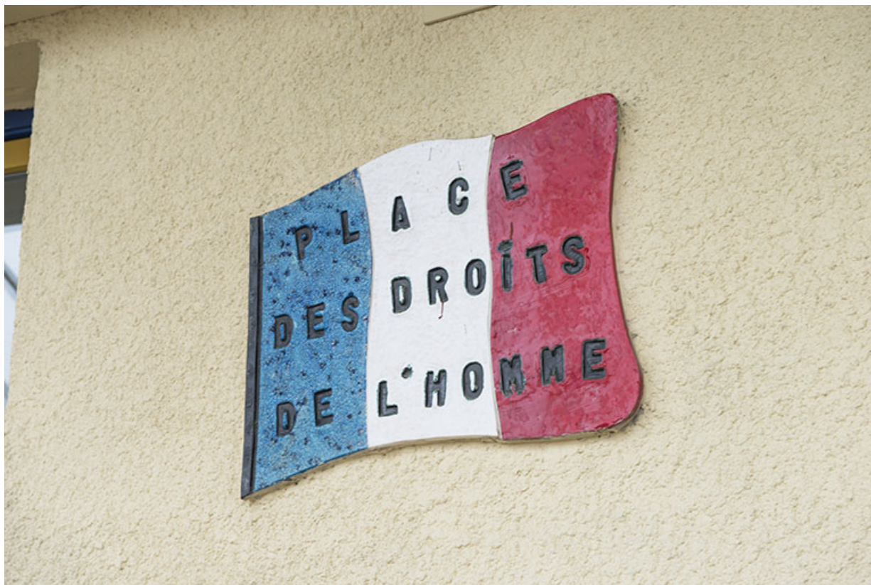
Détail de signalétique intérieure.