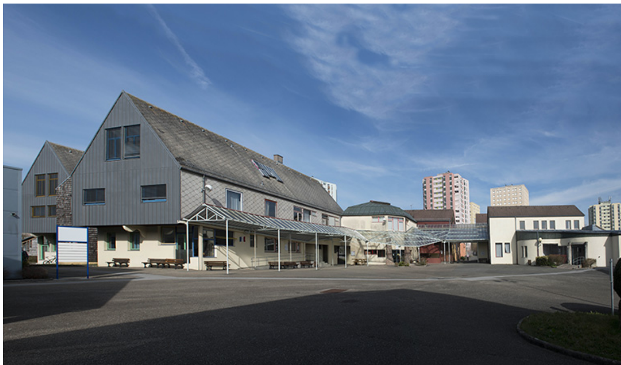
La place vue de l'ouest.