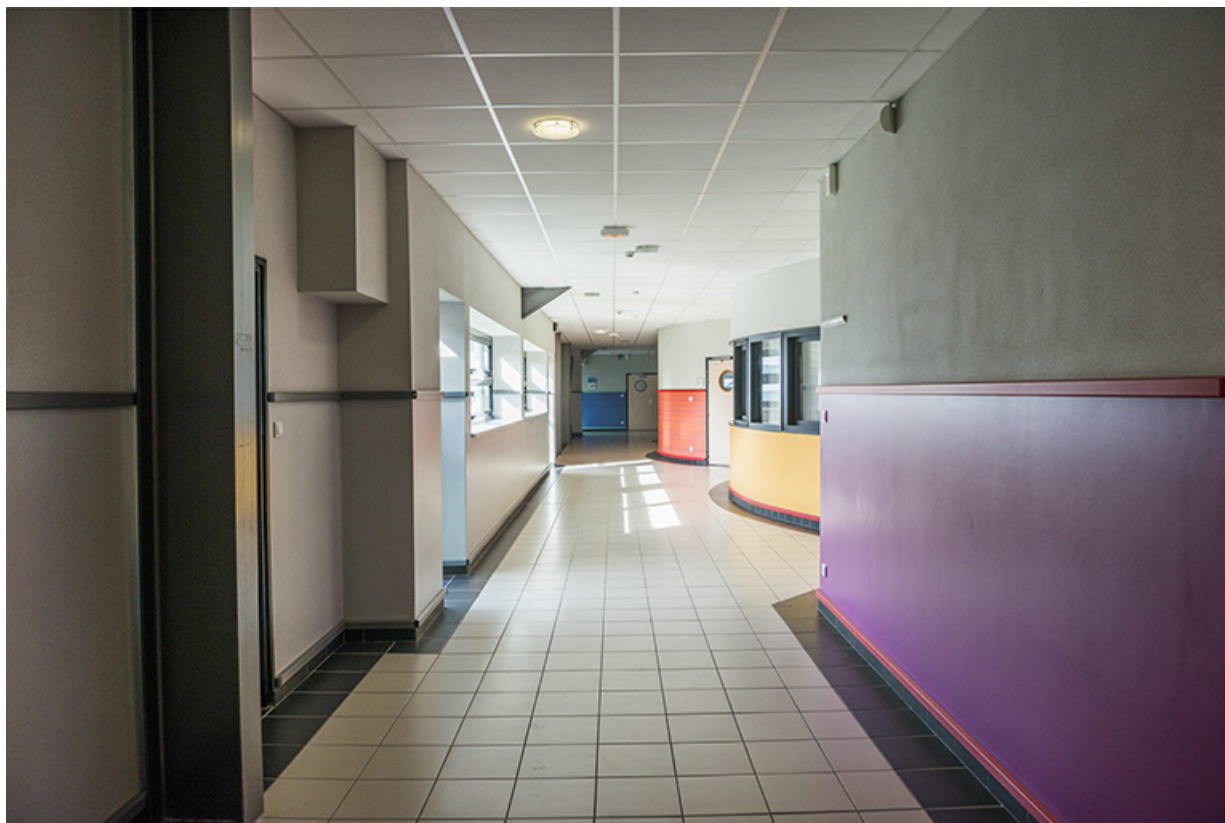
Circulation intérieure dans l'atelier mécanique.