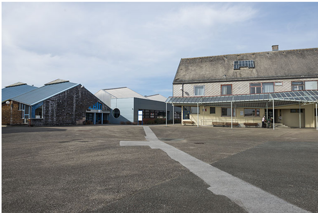
Cour, dite place des droits de l'homme, face à l'accueil au nord, façade est de l'atelier mécanique et son mur sud-est percé d'un oculus, face à l'externat.