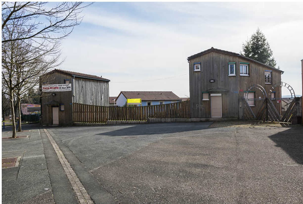
Deux logements orientaux du lycée vus depuis la rue de Zaporojie.