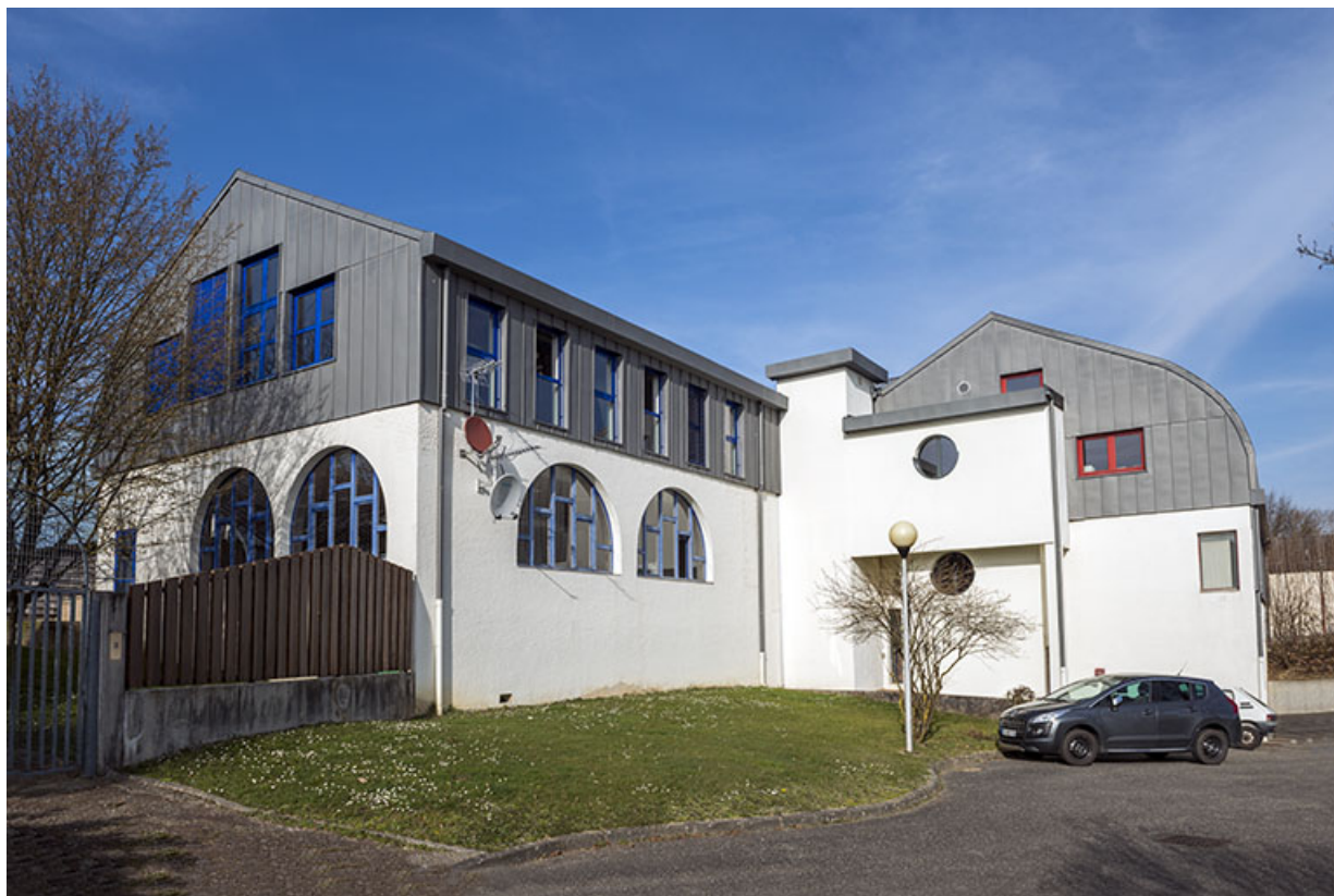
Façades sud et ouest de l'administration et de l'atelier électronique.