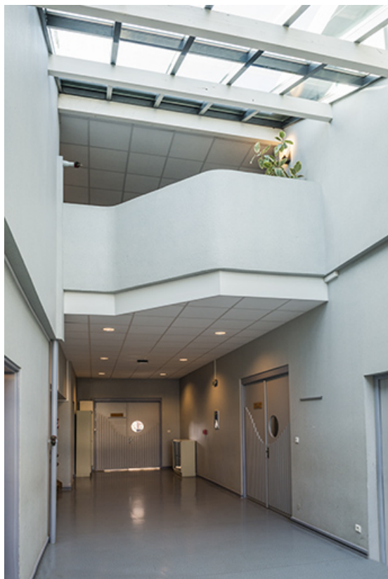
Vue intérieure du bâtiment d'administration.