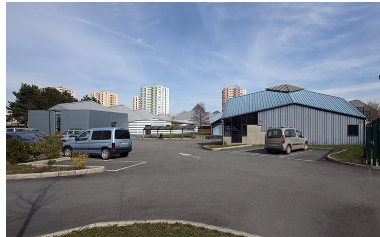
Aire de stationnement ouest et façades postérieures ouest des ateliers de mécanique.