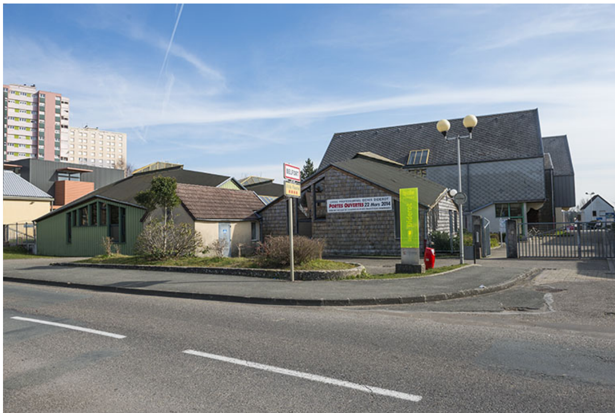
Entrée nord-ouest de la rue d'Alembert, donnant sur la place via la rue vers le nord.