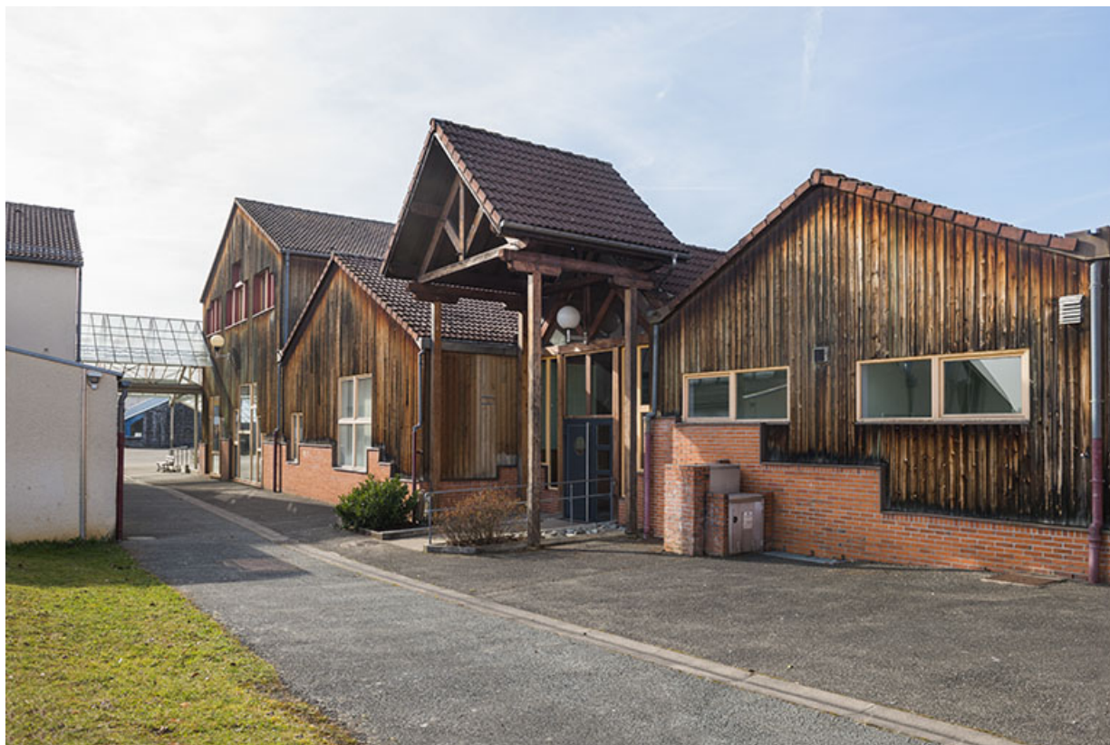
Façades sud de la restauration bordant la rue intérieure vers l'est.