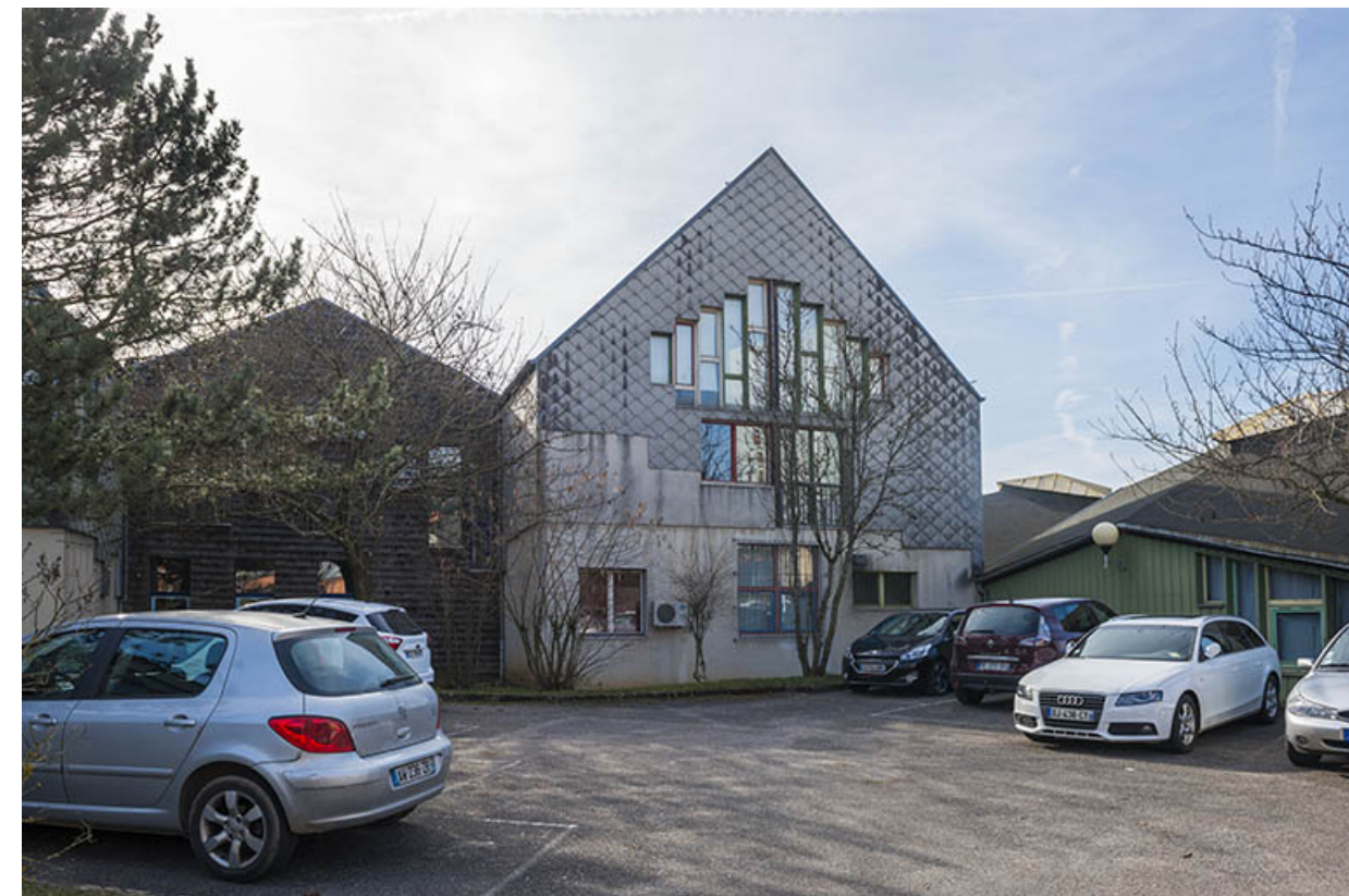
Façades postérieures est des externats du nord.