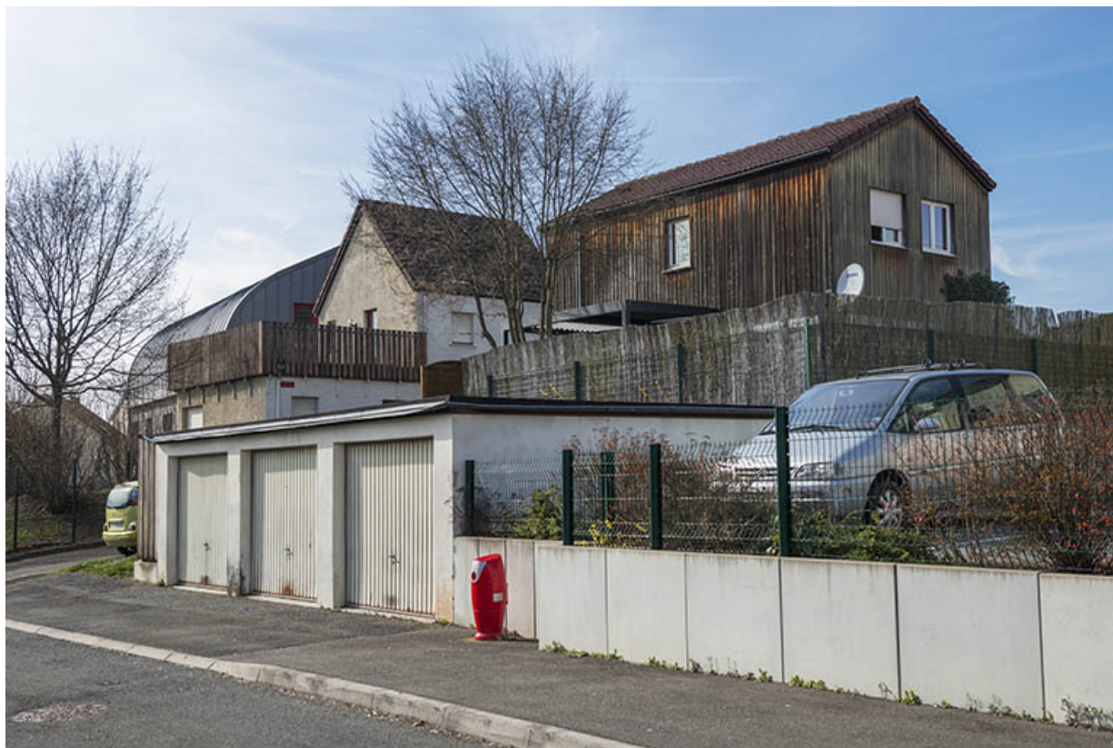
Façades sud de l'administration et du logement sud, garages bordant la rue du bocage.