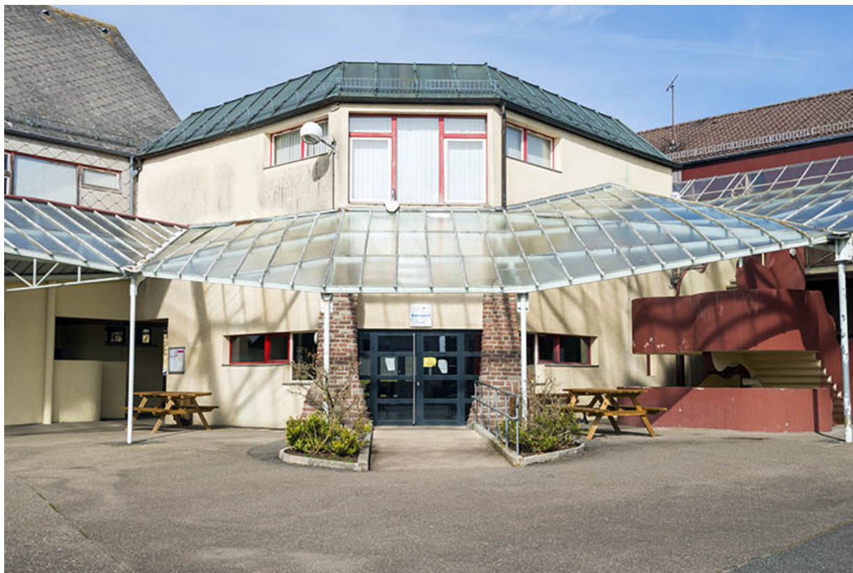
Cour, dite place des droits de l'homme, face au foyer à l'est.