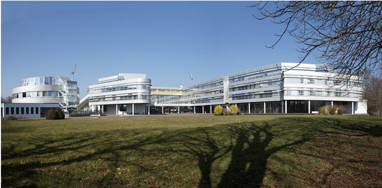
Belfort, lycée Gustave Courbet : vue d'ensemble depuis le sud.