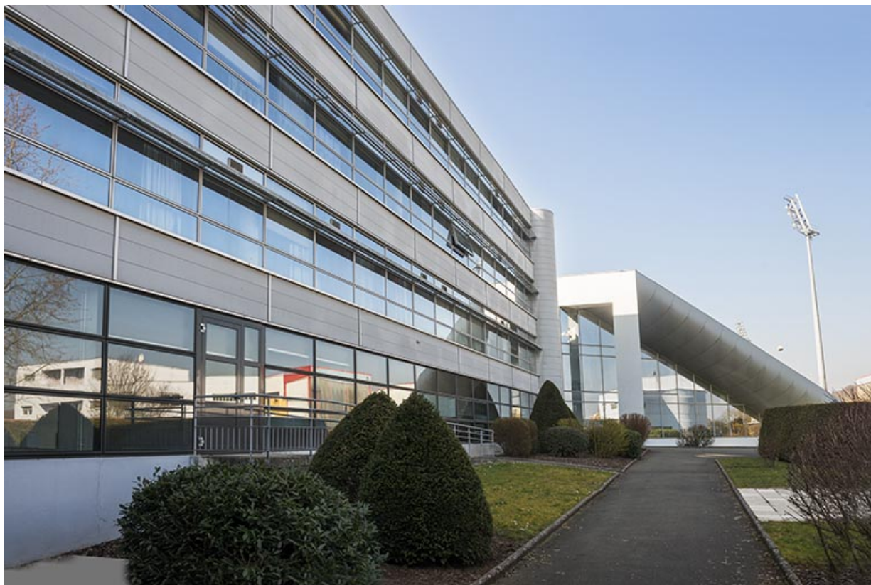
Façade est de l'aile est de l'externat.