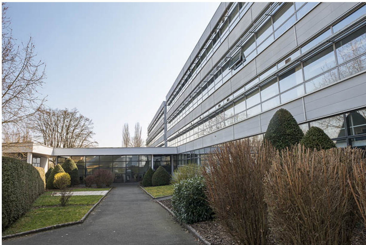
Façade est de l'aile est de l'externat.