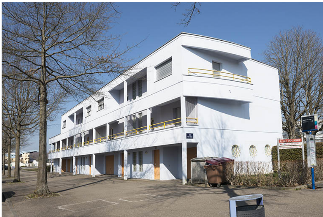
Angle sud-ouest des logements sud-ouest. 90, Belfort avenue du Général Gambiez