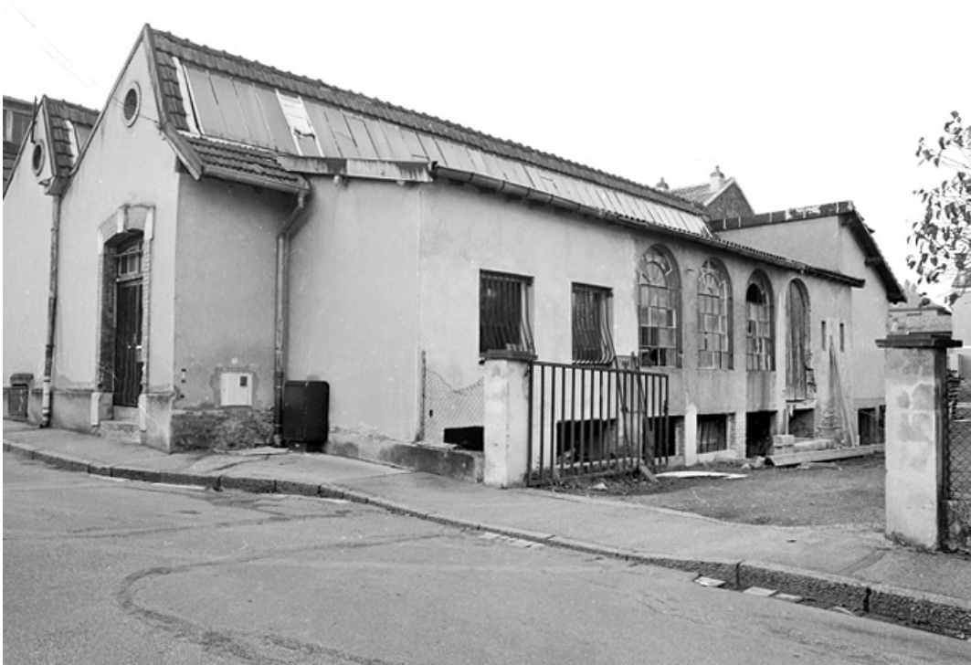
Atelier de fabrication vu de trois quarts.