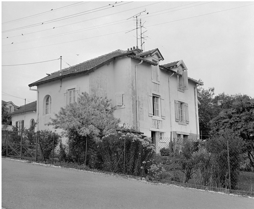
Maison jumelée rue des Fondateurs : façade postérieure. SRI. Enquête régionale sur les bâtiments industriels (1979-1981). 90, Beaucourt, lieudit : cité Adolphe Japy