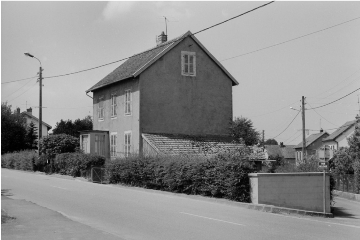
Maison (n° 18) de la rue Bellevue. SRI. Inventaire topographique du canton de Beaucourt (1981-1982). 90, Beaucourt, lieudit : cité Bellevue