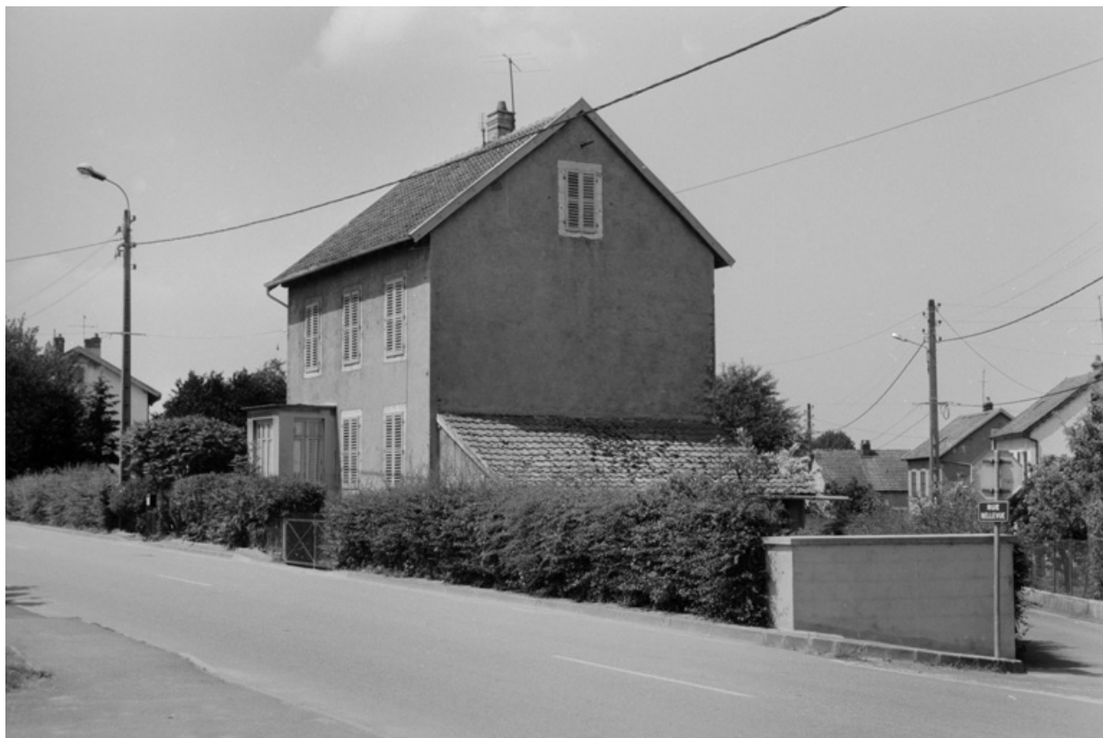
Maison (n° 18) de la rue Bellevue. SRI. Inventaire topographique du canton de Beaucourt (1981-1982). 90, Beaucourt, lieudit : cité Bellevue