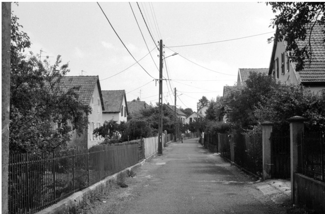
Rue n° 1 de la cité Bellevue. SRI. Inventaire topographique du canton de Beaucourt (1981-1982).