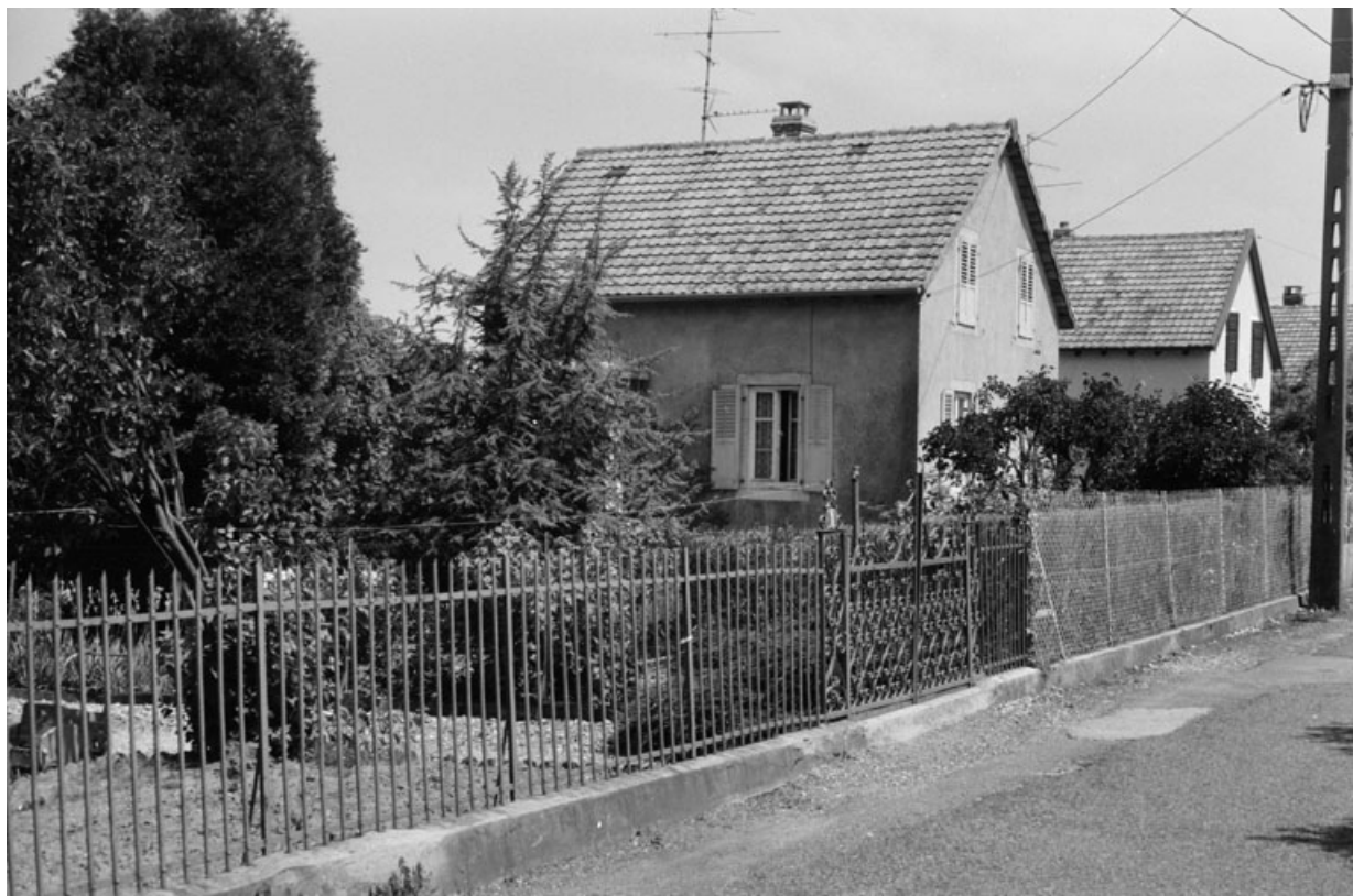
Maison (n° 3) de la rue n° 1 de la cité Bellevue. SRI. Inventaire topographique du canton de Beaucourt (1981-1982). 90, Beaucourt, lieudit : cité Bellevue