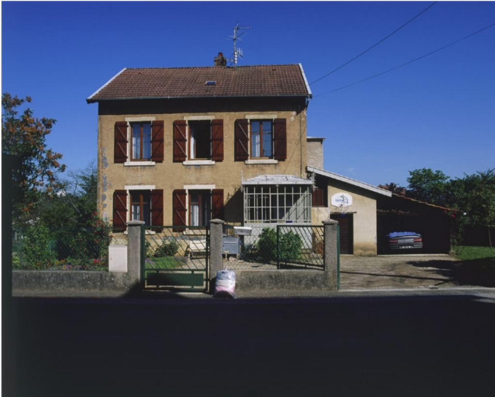
Maison au n° 9 de la rue : vue de face.