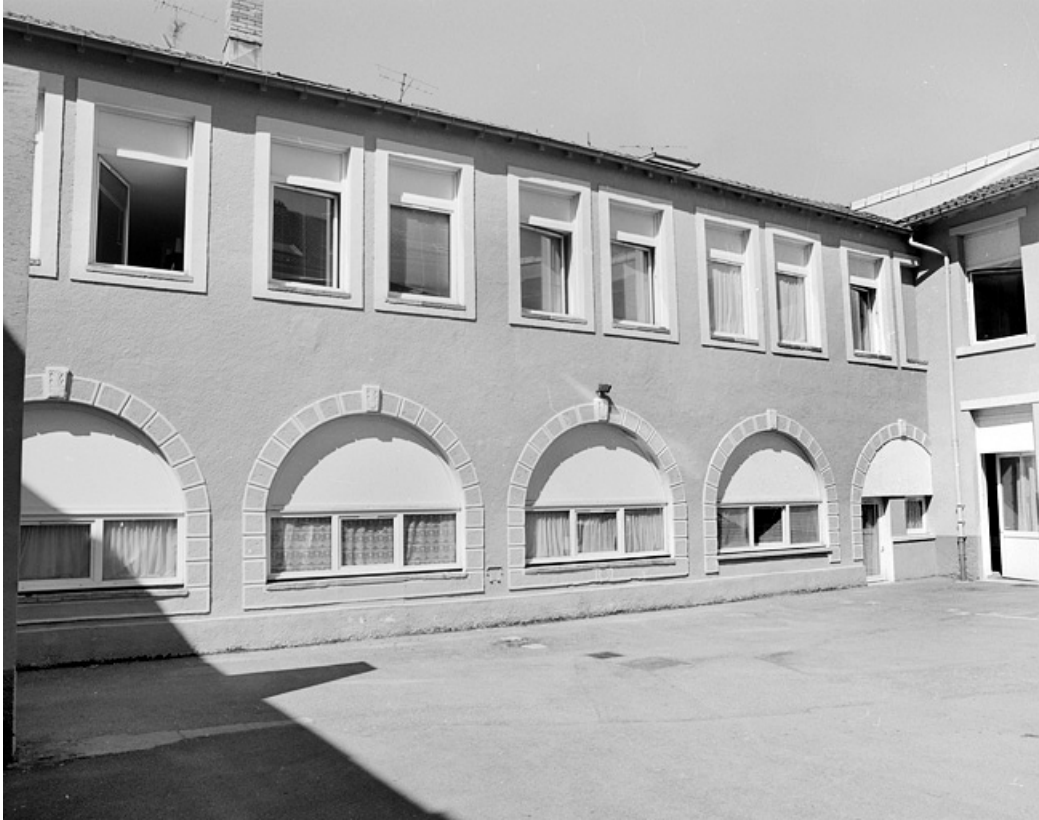
Elévation (remaniée) d'un atelier de fabrication depuis la cour.