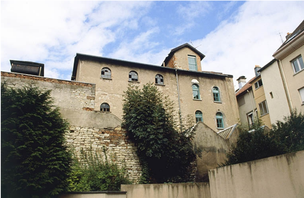
Façade postérieure de l'usine. 90, Belfort, 1 à 5 rue des Capucins