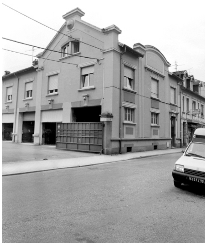
Vue de trois quarts du bâtiment abritant des remises et des logements.