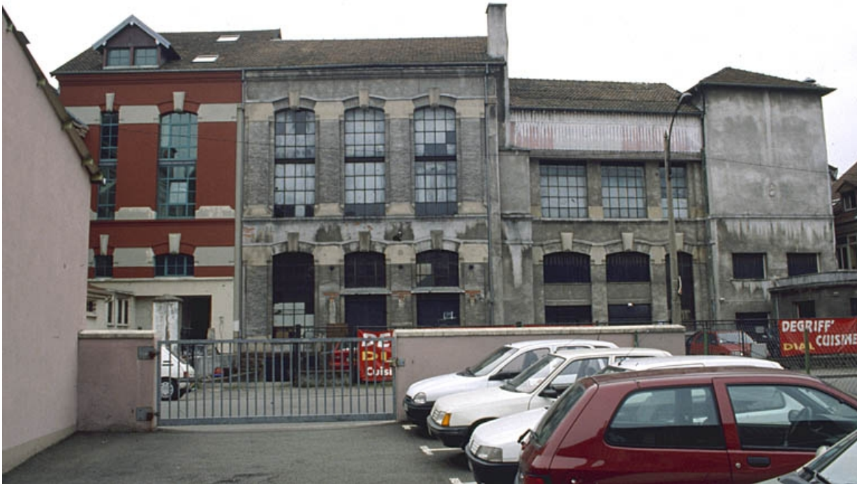
Façade antérieure de l'atelier de fabrication.