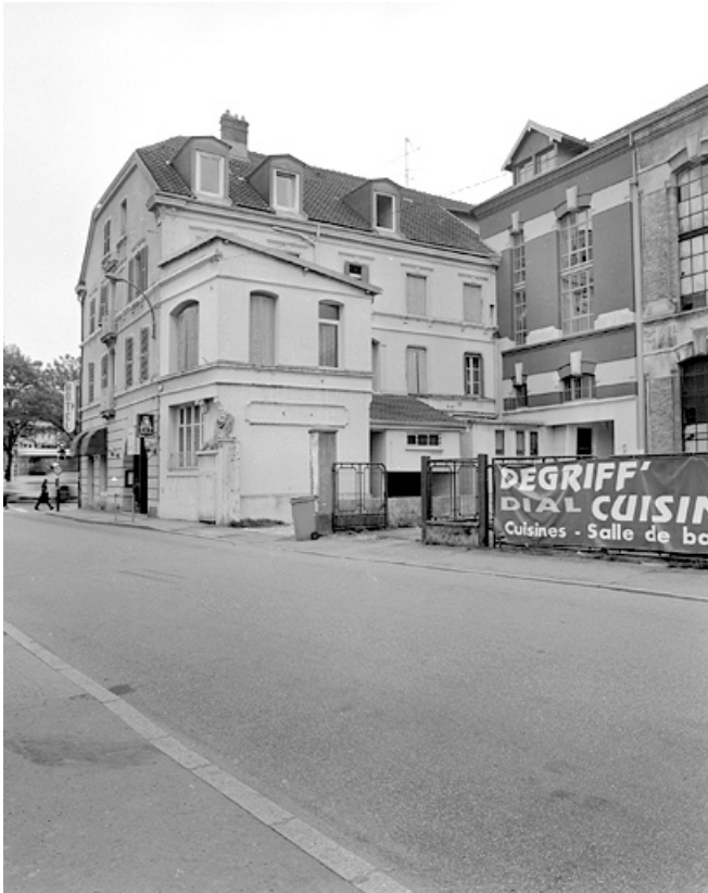
Bureau et façade de l'atelier de fabrication.