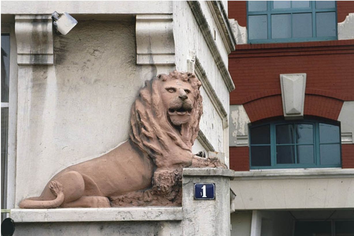
Détail du lion ornant l'entrée de l'usine.