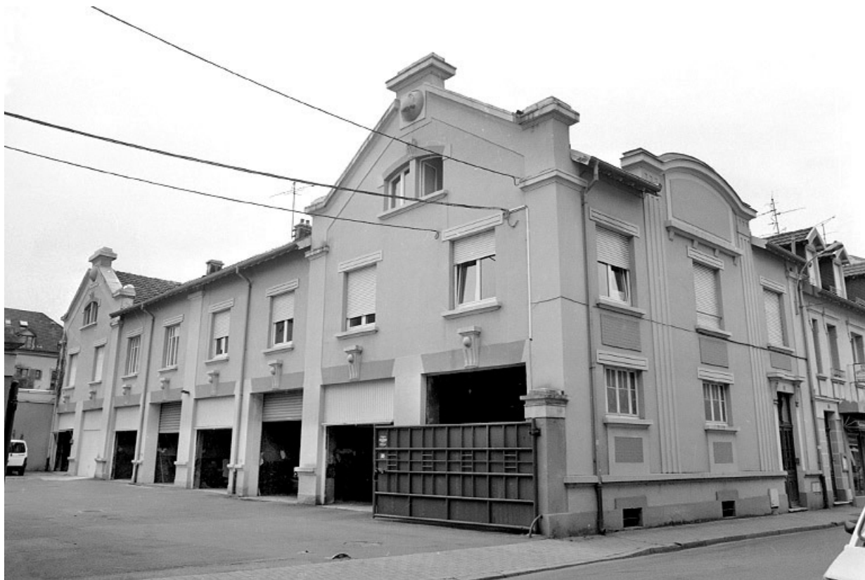
Bâtiment abritant des remises et des logements.