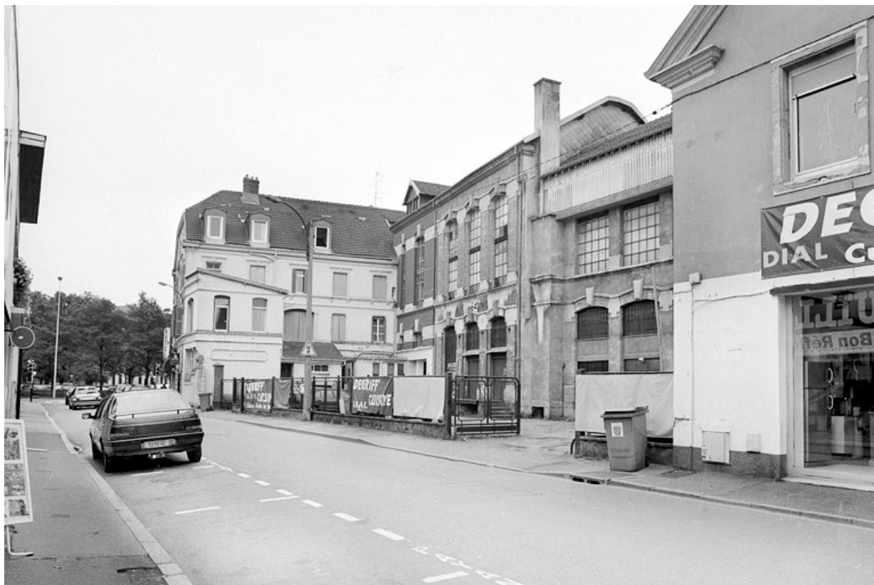
Vue d'ensemble depuis le nord-ouest.