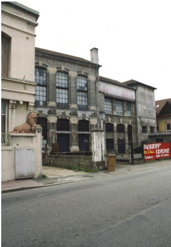
Vue de trois quarts gauche de la façade de l'atelier de fabrication.