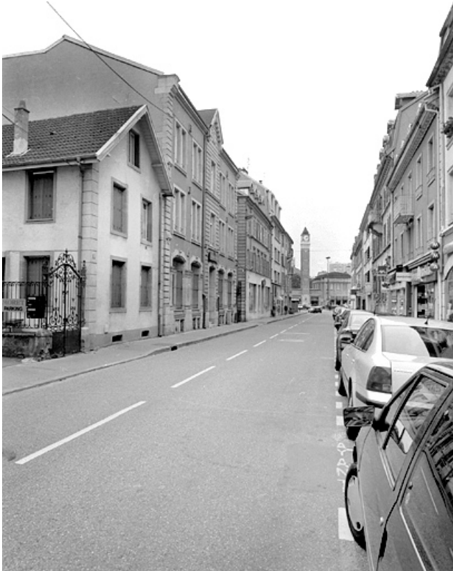
Façades sur rue depuis l'est.