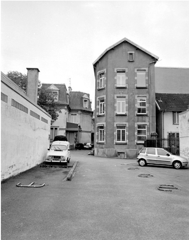
Logement patronal situé à l'arrière du n° 25.