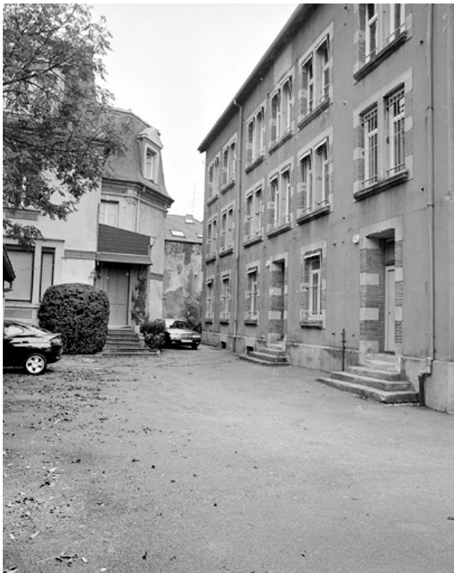
Façade postérieure du bâtiment situé au n° 25. 90, Belfort, 23, 25 rue Adolphe Thiers