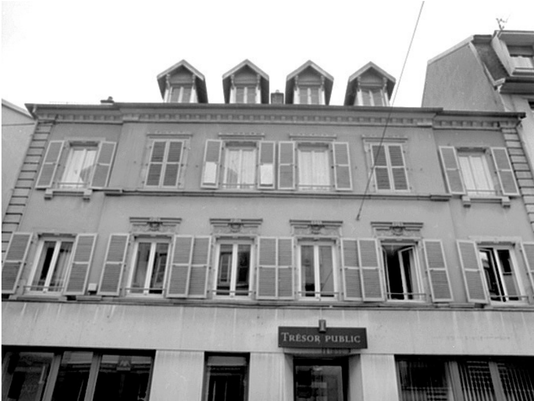
Etages du bâtiment sis au n° 25 (logements ?).