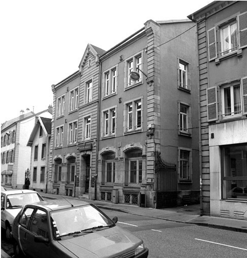
Façade antérieure du n° 23.