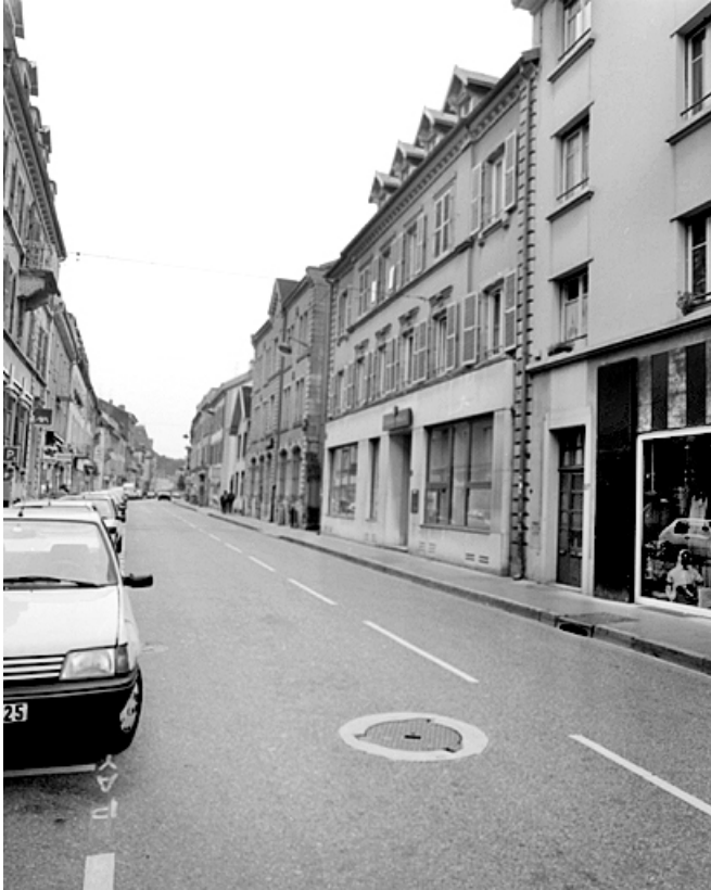
Façades sur rue depuis l'ouest.