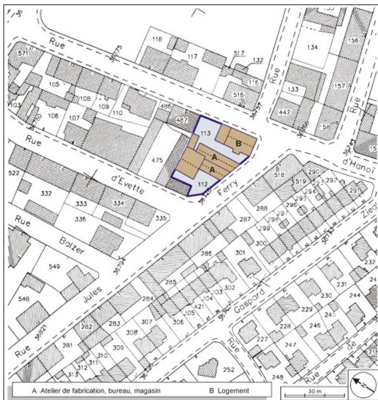
Plan-masse et de situation. Extrait du plan cadastral, 2001, section AE, 1:1000. 90, Belfort, 2 rue Jules Ferry