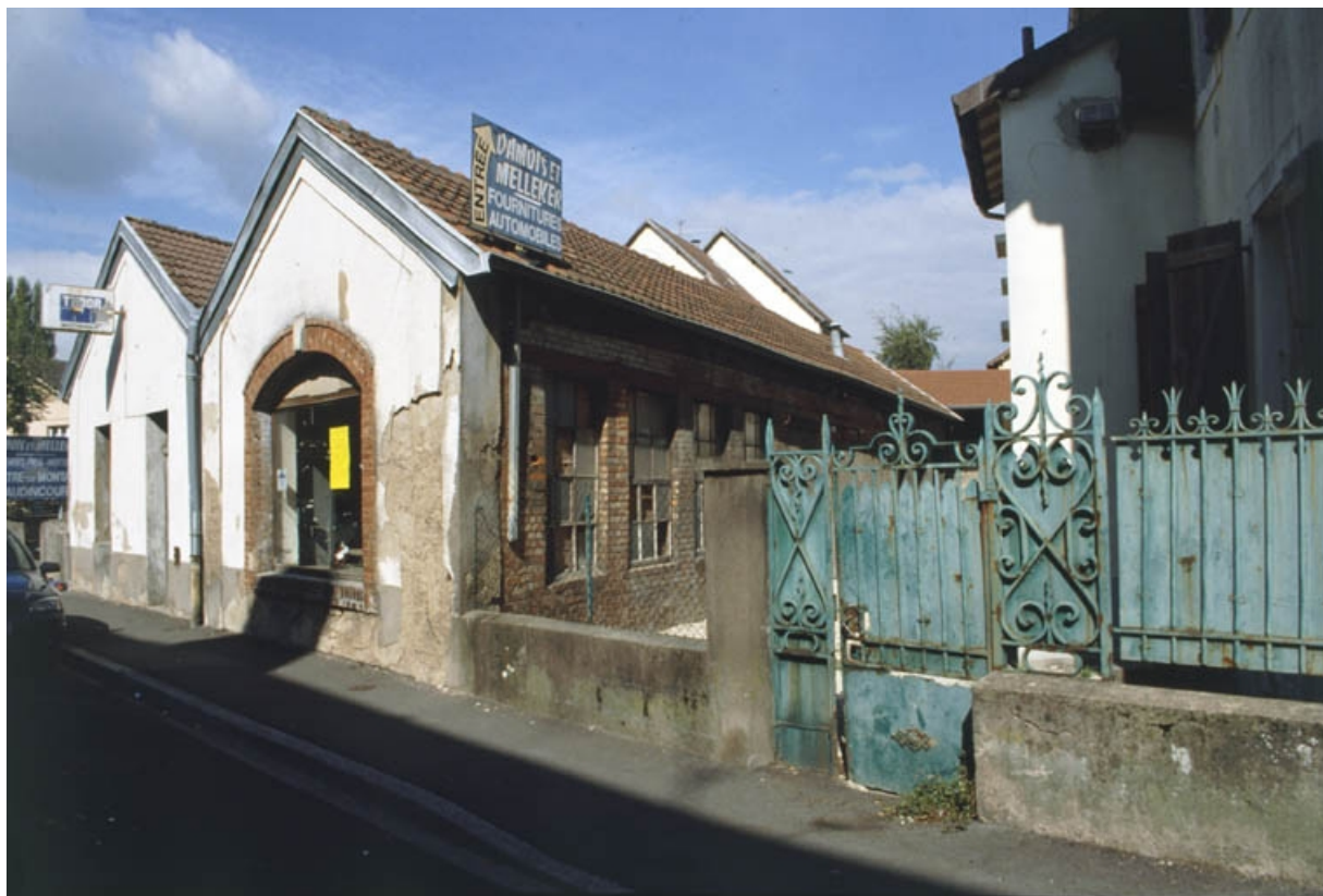
Vue depuis le sud.