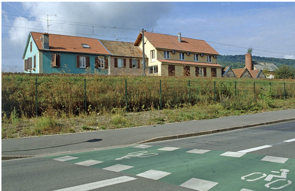
Logements et ateliers depuis le sud-est.