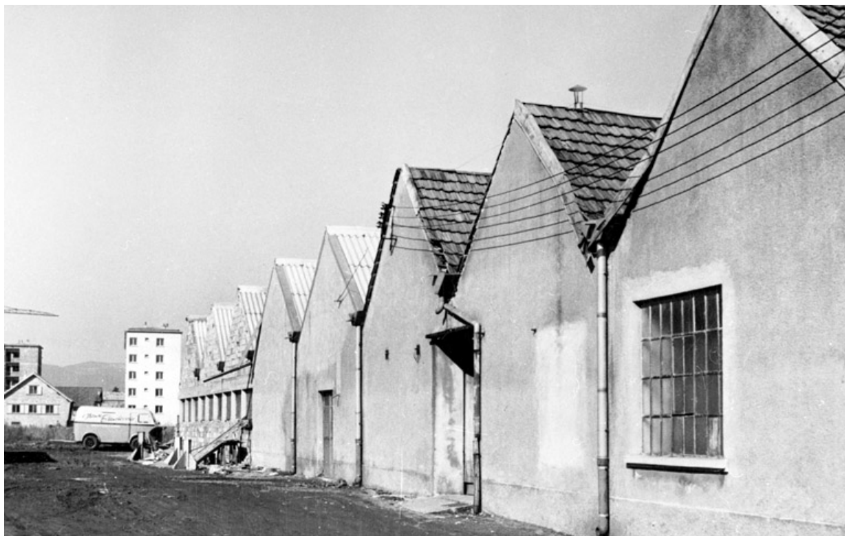
Extension nord de la blanchisserie.