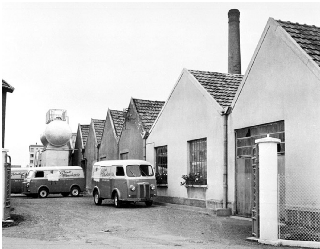
Pignons ouest des ateliers depuis l'entrée.