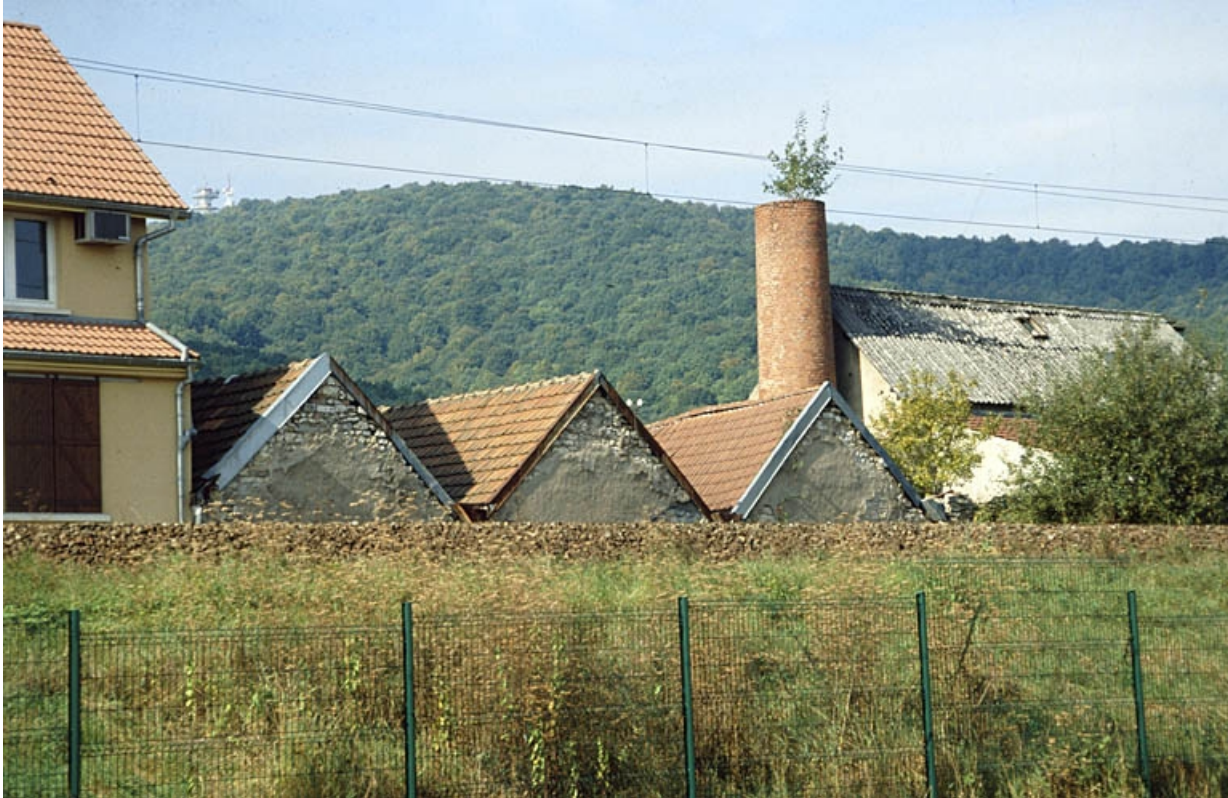
Pignons est des ateliers et cheminée tronquée.