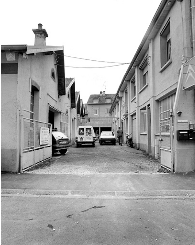
Passage entre l'atelier et le logement.