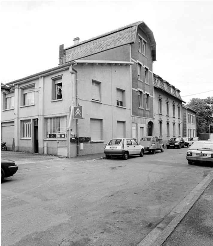
Logement (à gauche).