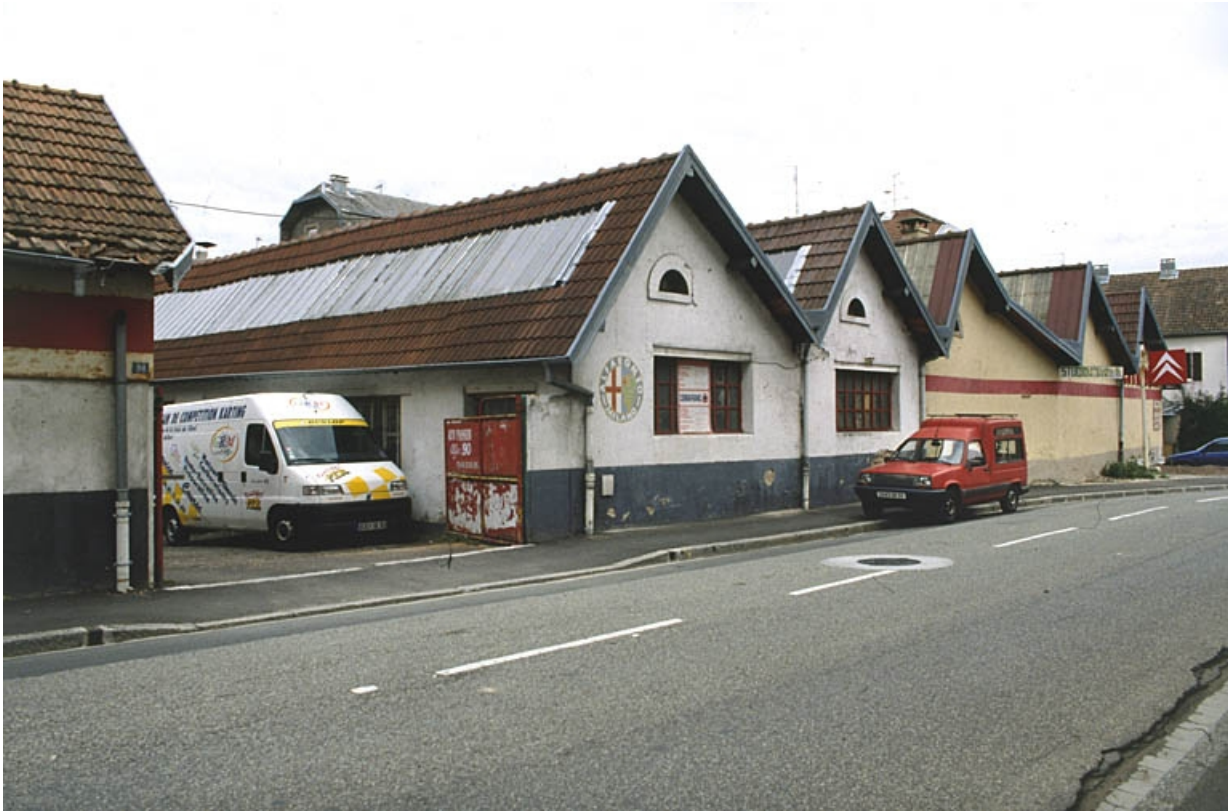
Pignons des ateliers depuis le nord-ouest.