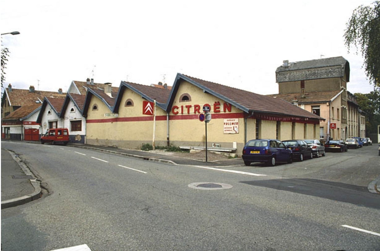
Vue d'ensemble depuis le sud.