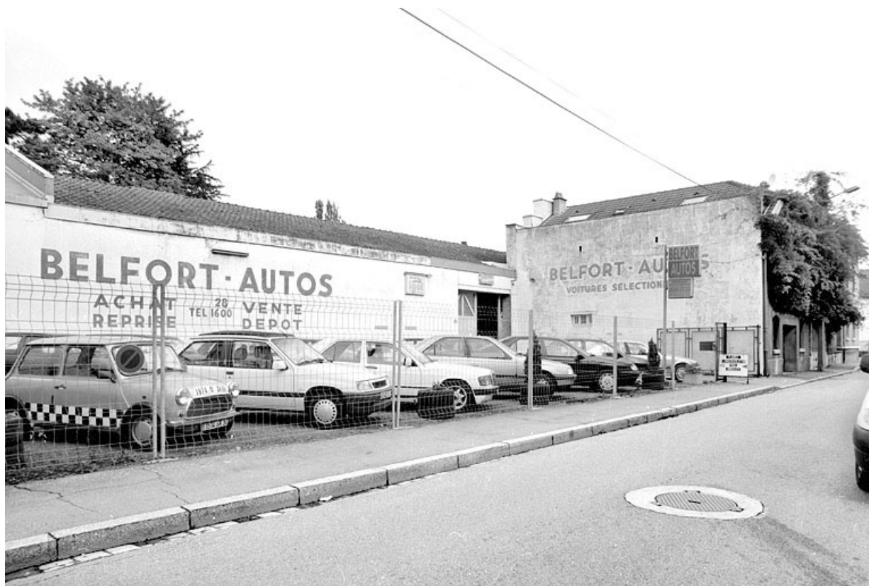
Vue depuis le sud-ouest. Le plan de 1912 mentionne l'existence (ou le projet de construction) de l'atelier à l'emplacement du parc de stationnement.