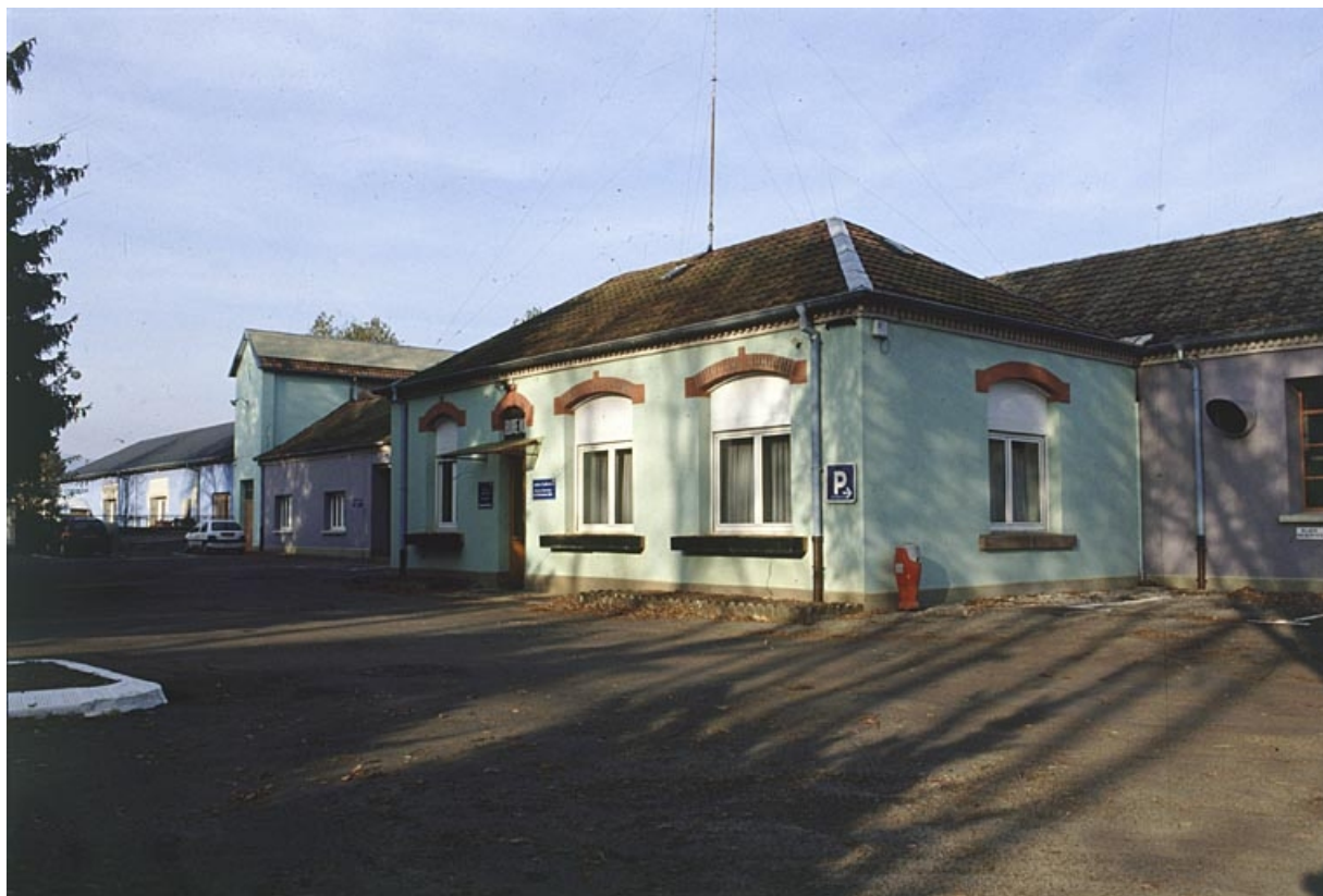
Façade antérieure de l'usine.