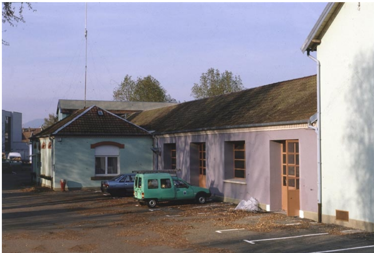
Bureaux et façade de l'atelier du tissage.