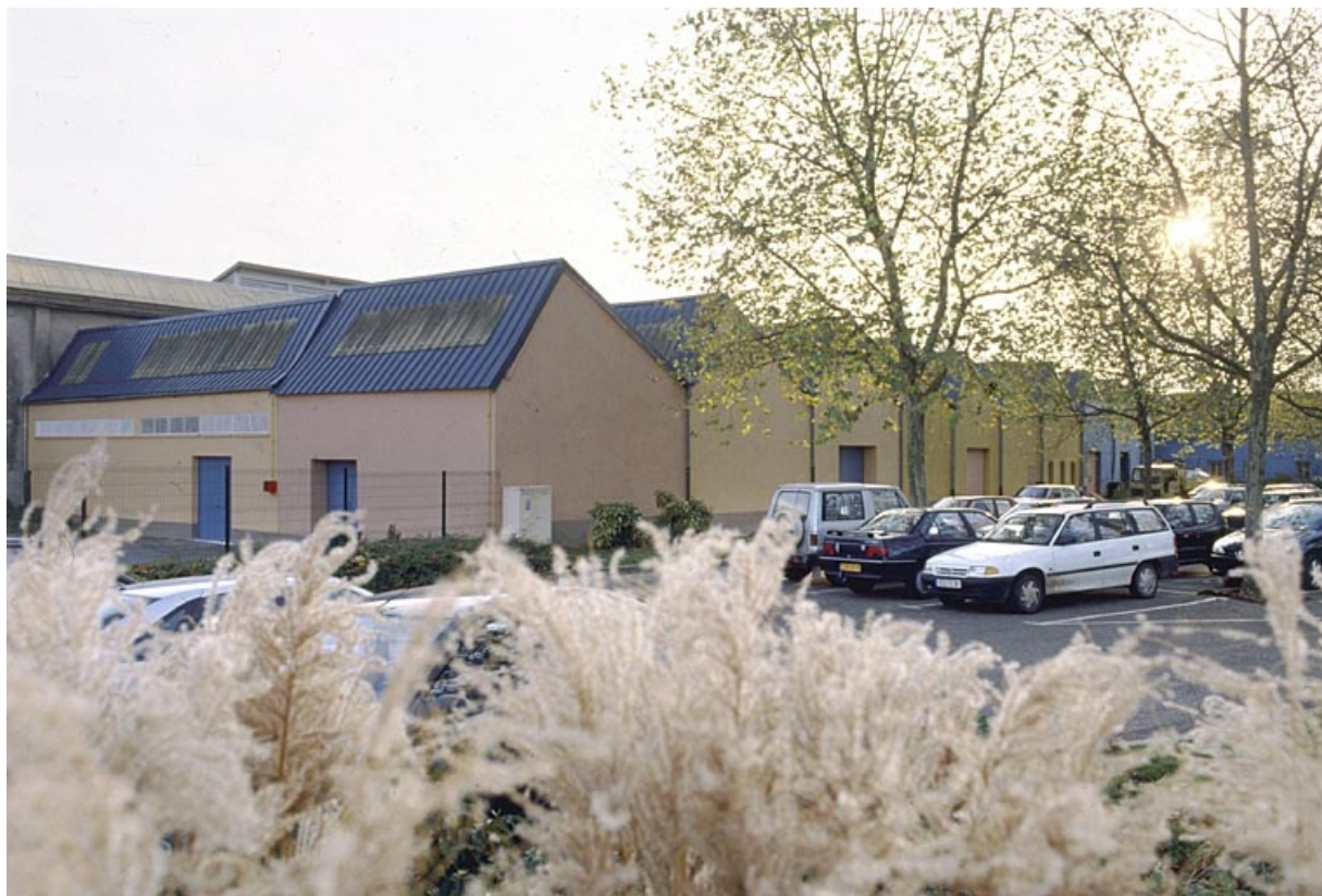
Murs-pignons nord de l'atelier de filature.