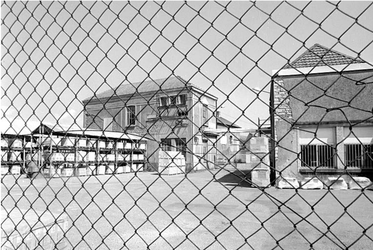
Transformateur électrique (?) vu au travers du grillage depuis la rue du Salbert.