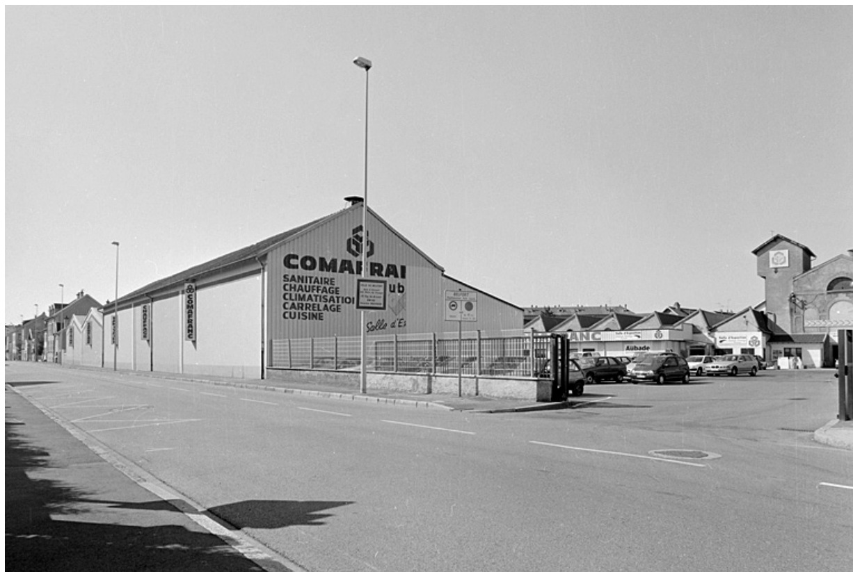
Vue de l'entrée depuis l'avenue Jean Jaurès.