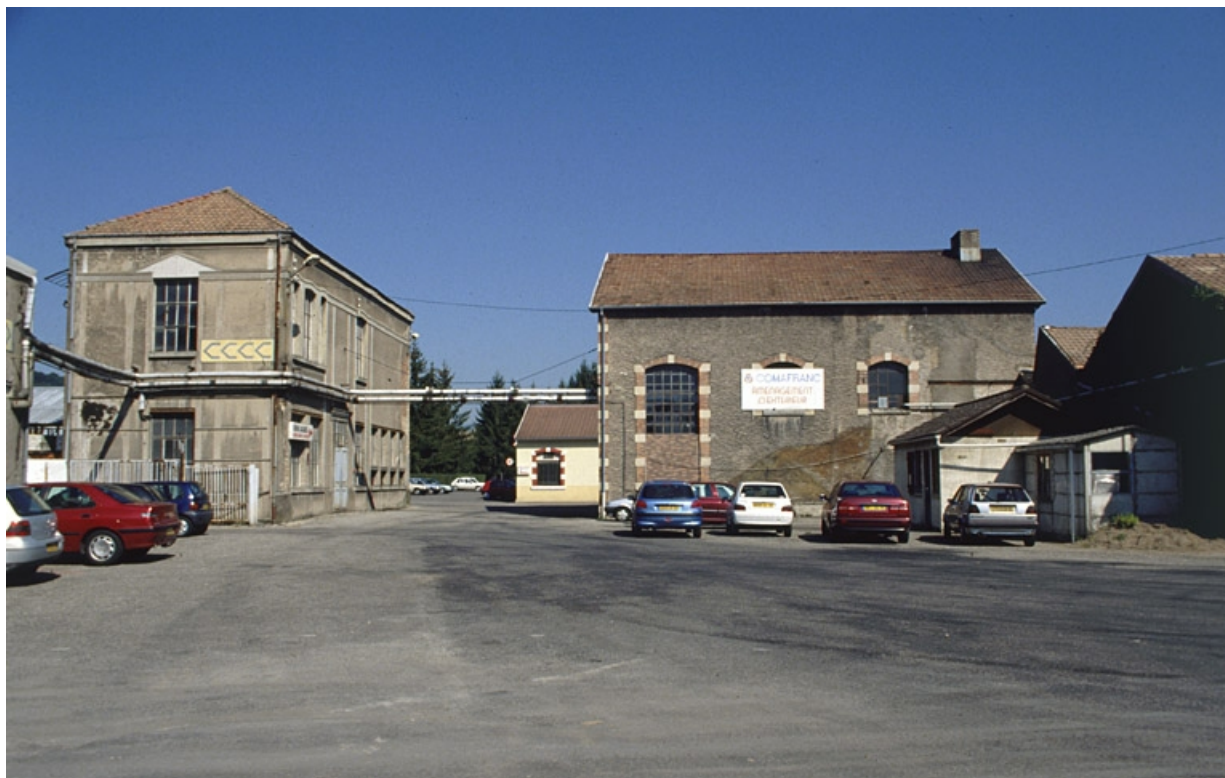
Transformateur électrique et ancienne salle des machines du tissage (?).