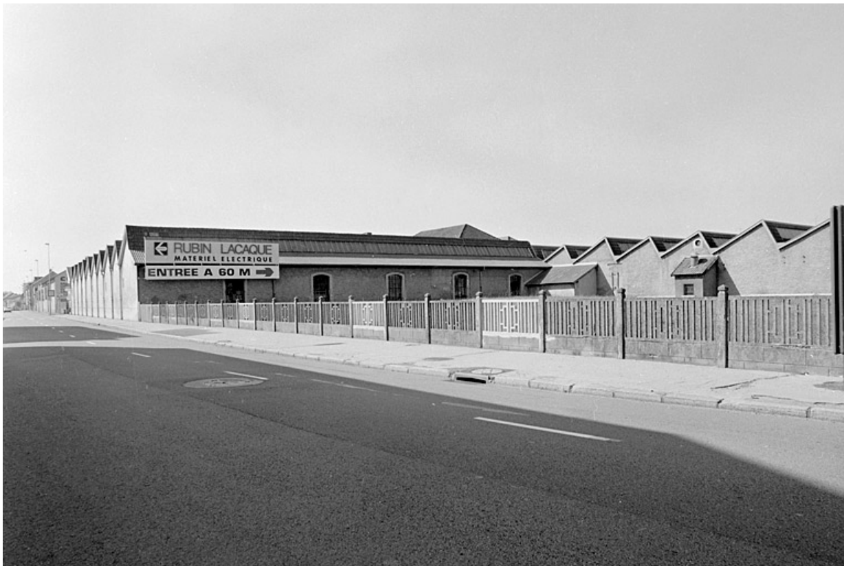
Vue d'ensemble des ateliers de tissage depuis le nord de l'avenue Jean Jaurès.