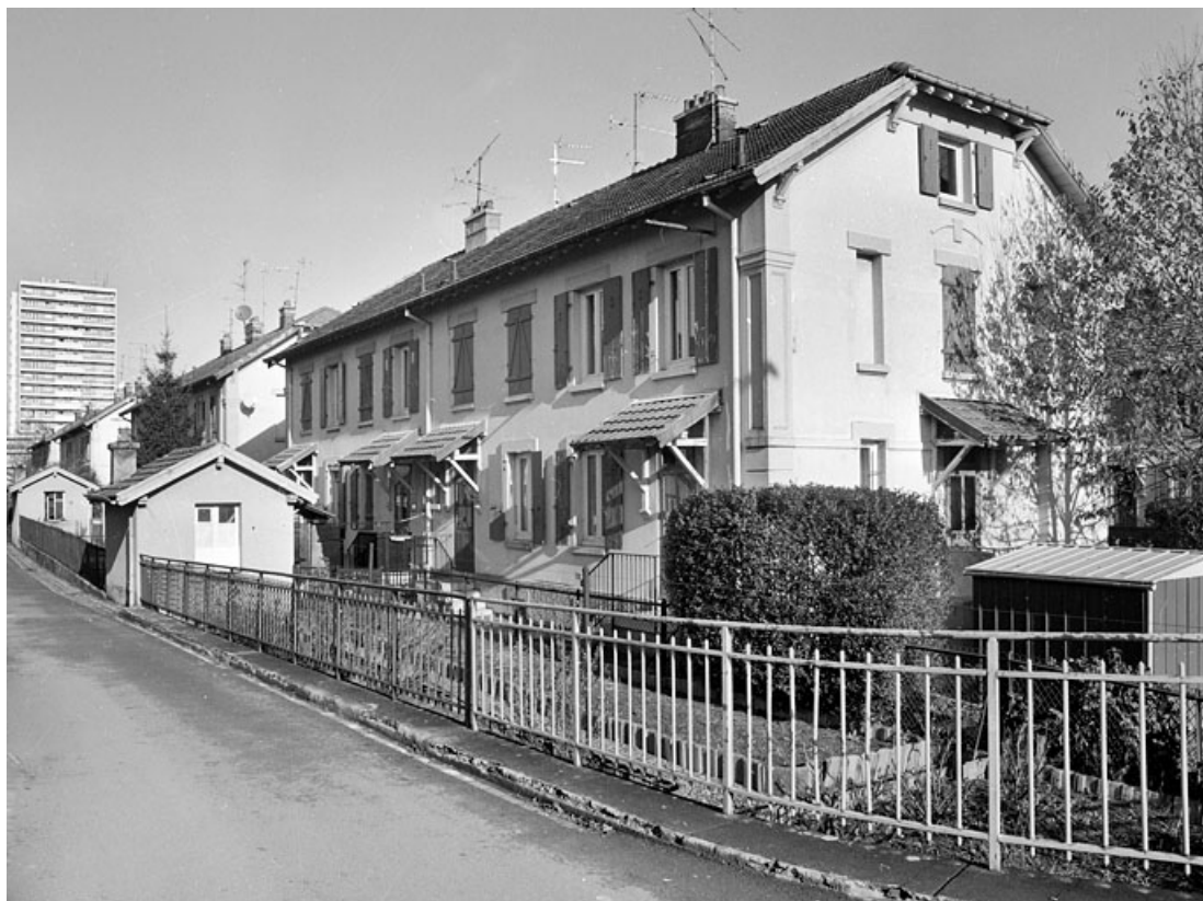
Une rue vue de trois quarts.