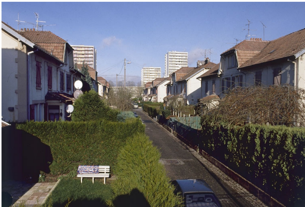
Vue d'ensemble d'une rue.