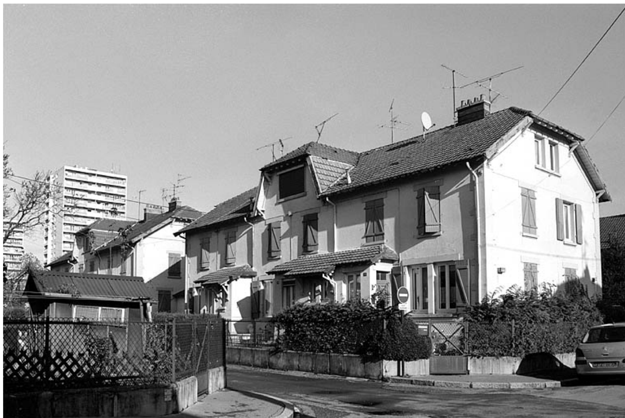
Vue de trois quarts d'un logement ouvrier.