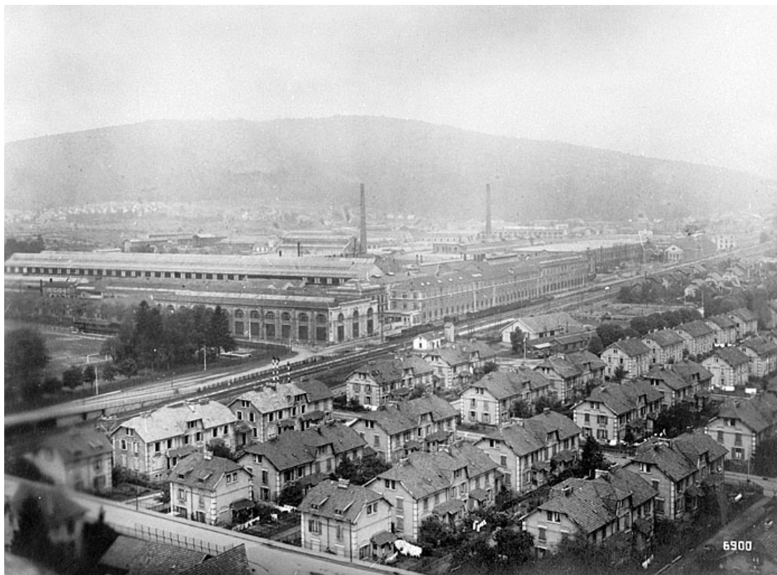
Vue générale panoramique des usines de Belfort.