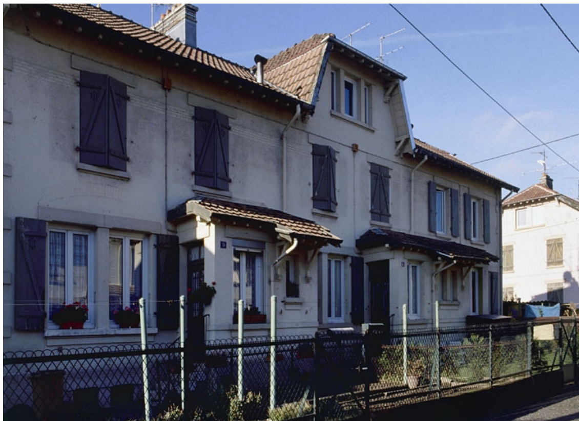
Logement ouvrier vu de trois quarts.