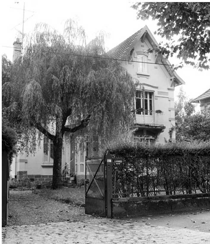
Maison de contremaître rue d'Alsace.