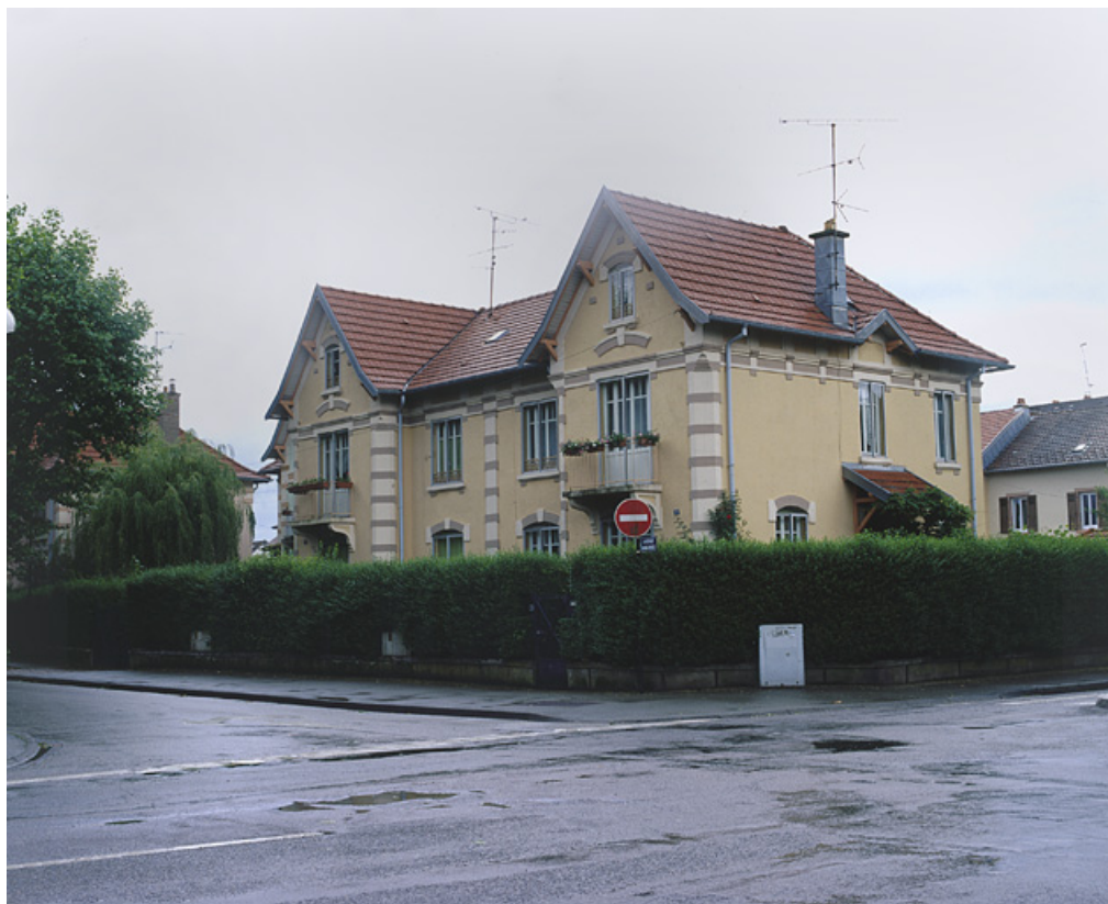
Logement double de contremaître rue d'Alsace.