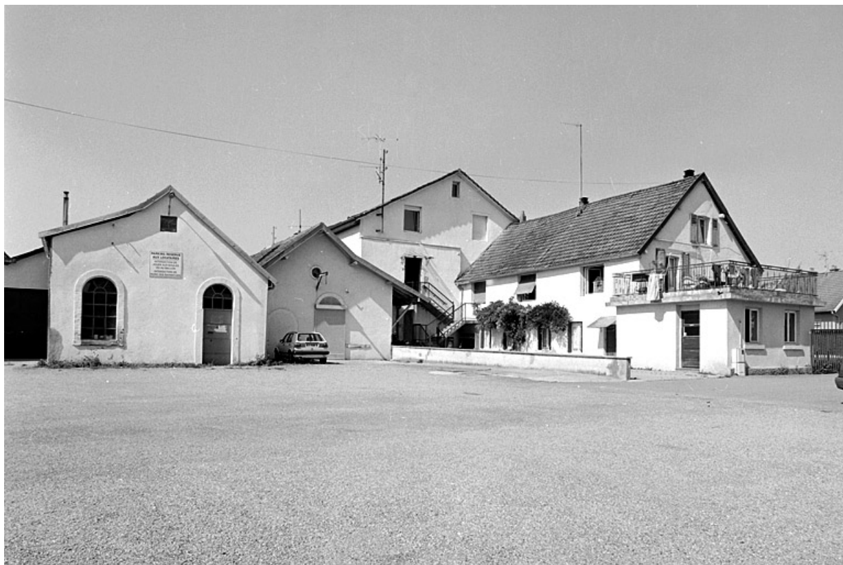
Pignons des ateliers depuis la cour.