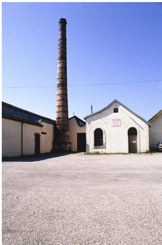
Cheminée et salle des machines.