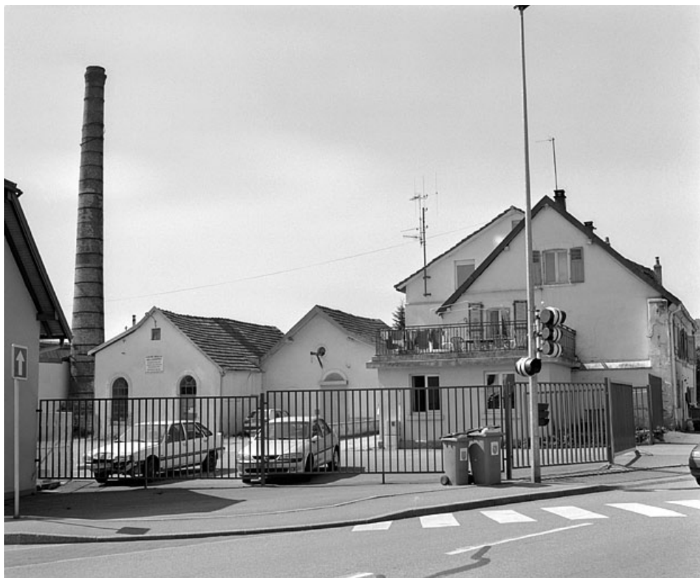
Pignons est des ateliers de fabrication.