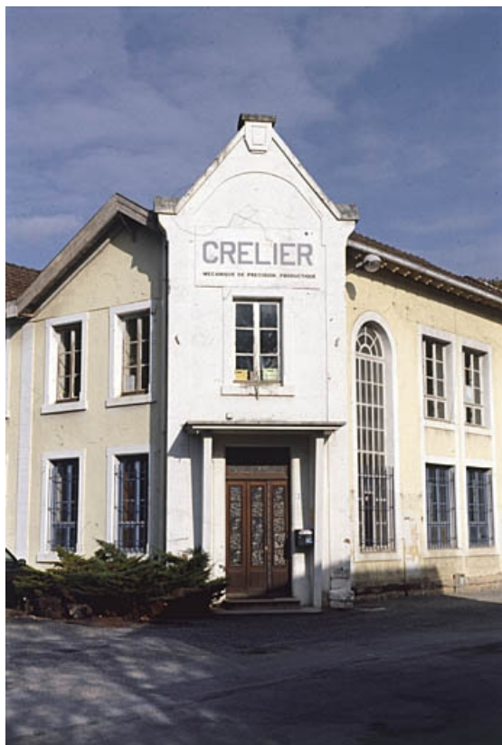
Bâtiment d'entrée : bureaux.