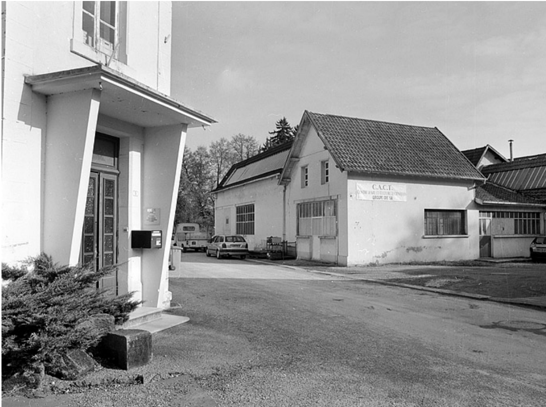
Ateliers de fabrication sud depuis le bâtiment des bureaux.