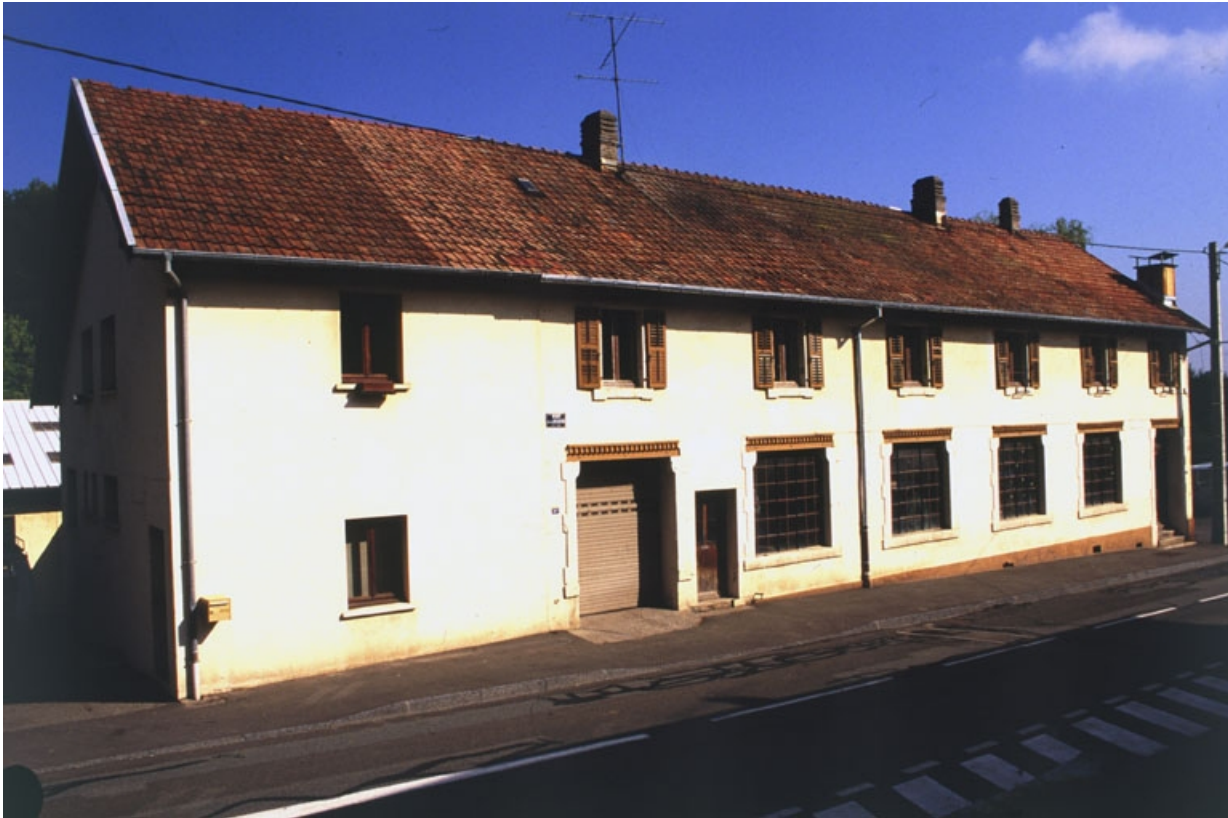
Façade sur rue de l'atelier de fabrication.

90, Delle, 30, 30 bis rue de la Libération