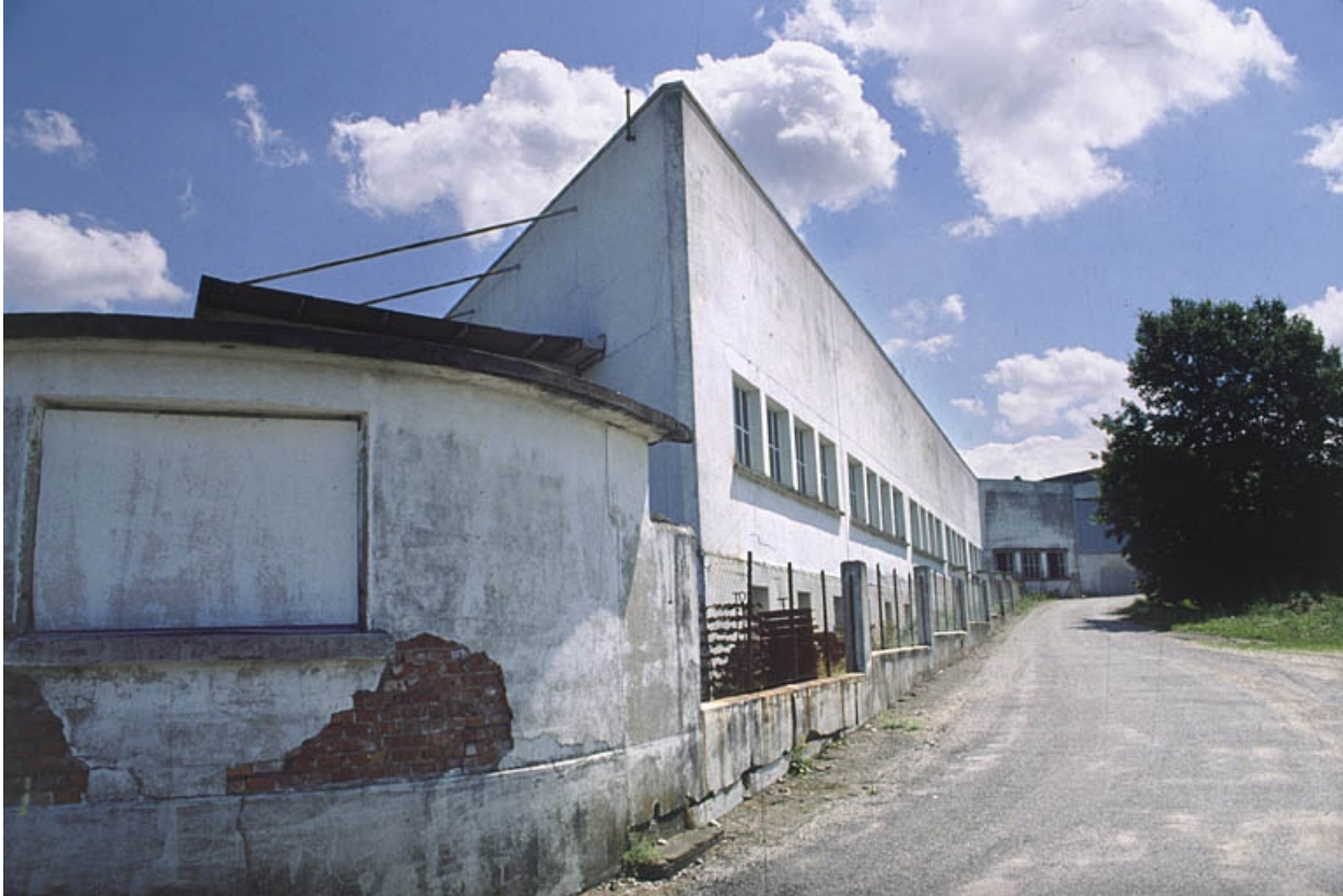
Fonderie et atelier d'usinage du zamak.