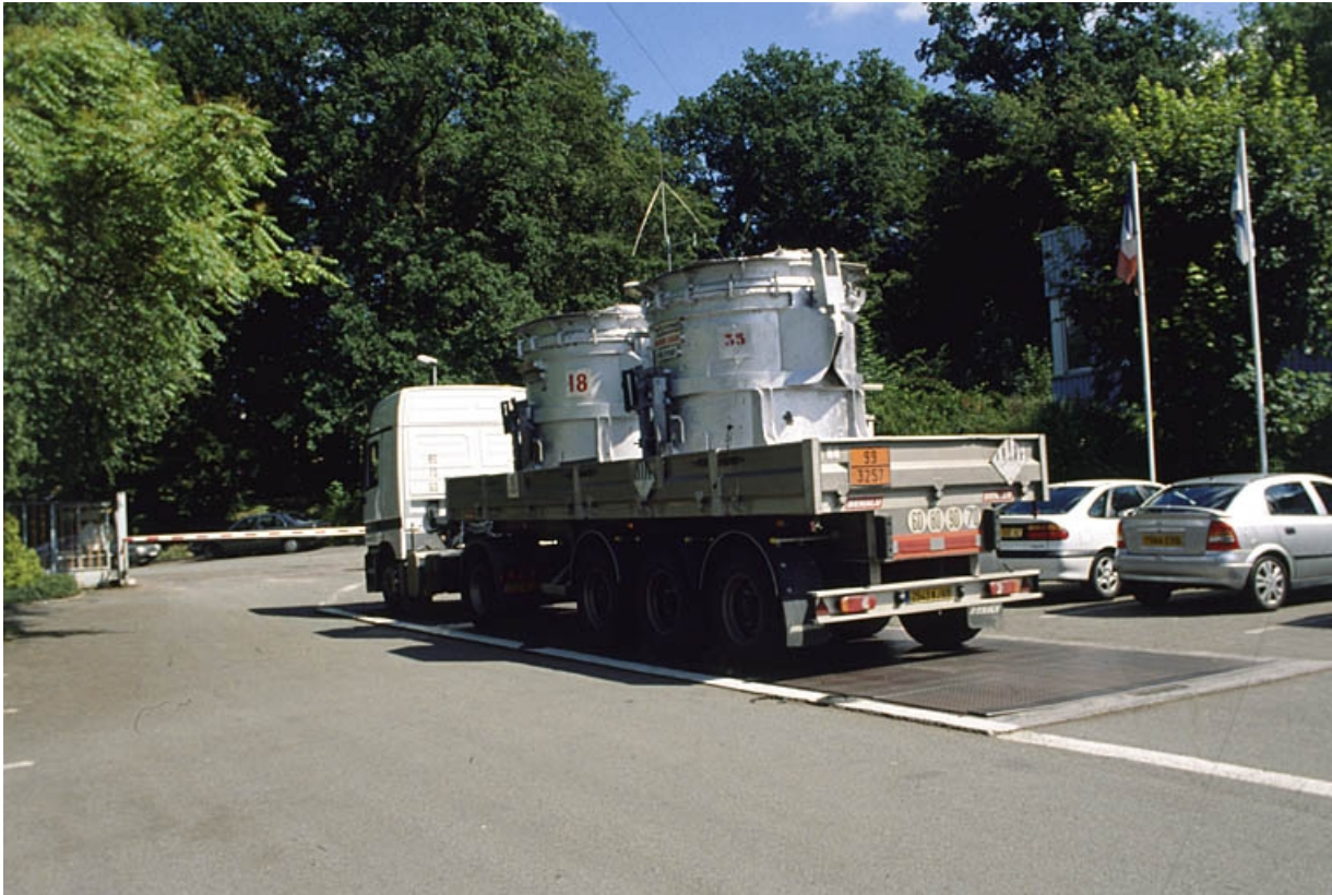
Camion chargé de deux poches d'aluminium liquide.