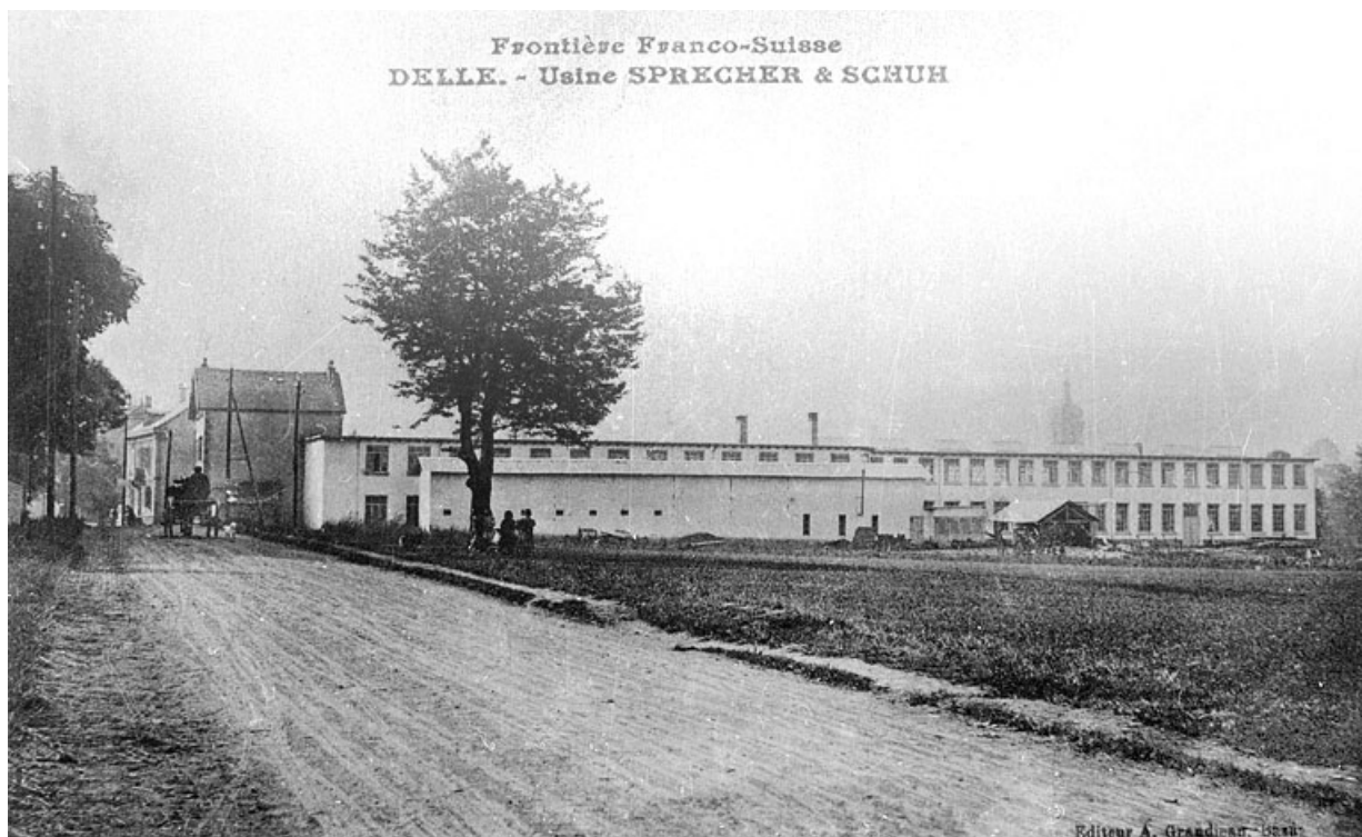
Delle. - Usine Sprecher & Schuh.