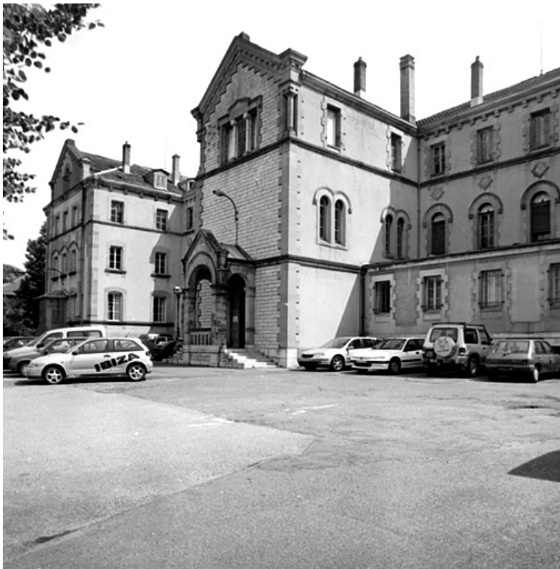
Façade antérieure de l'ancien couvent (actuellement bureaux).