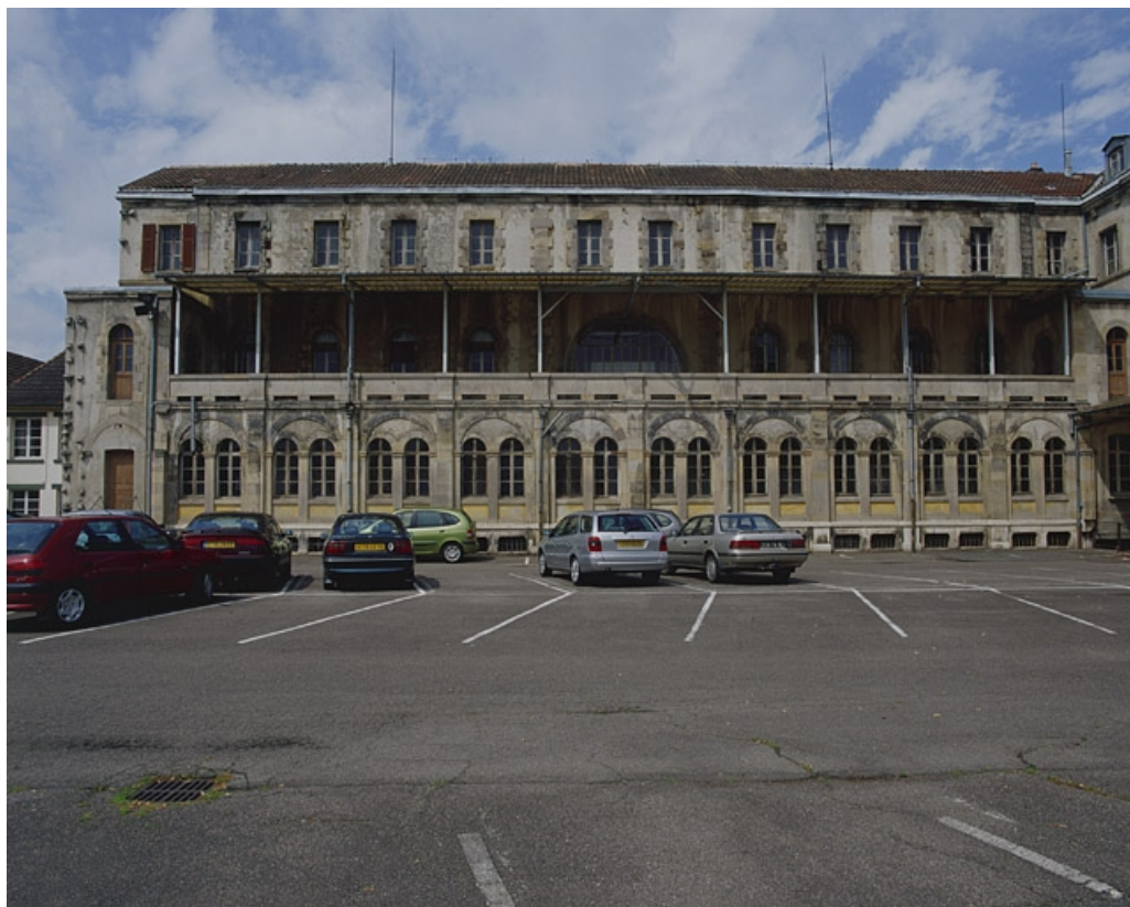
Façade postérieure de l'ancien couvent (actuellement bureaux).