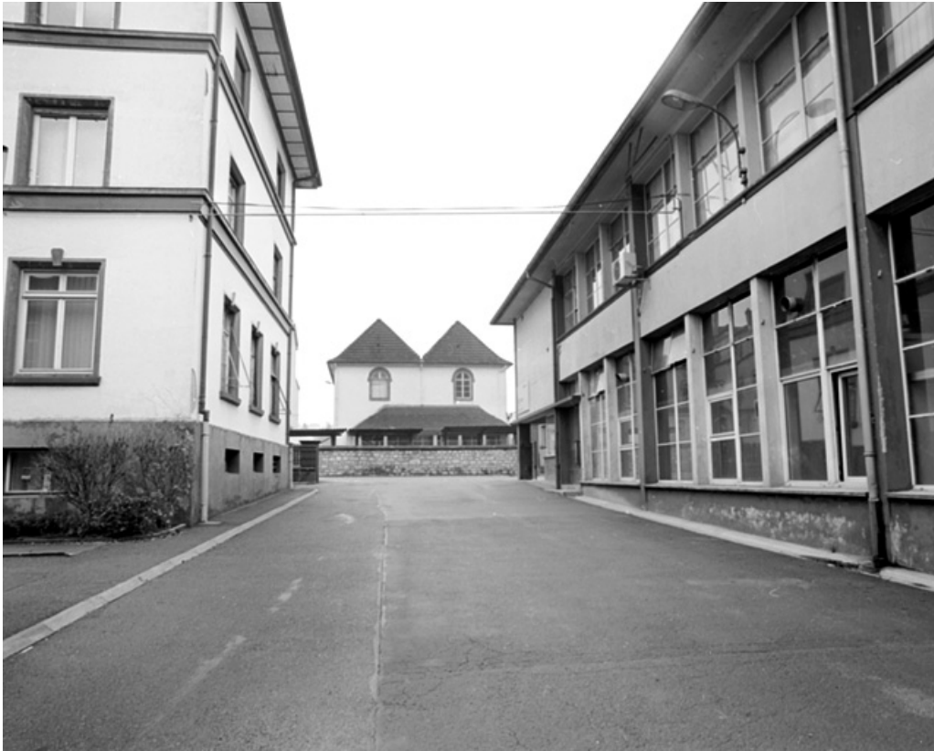
Bureaux (à gauche) et bâtiment abritant des fonctions productives et sociales (à droite). 90, Delle, 27 faubourg de Belfort