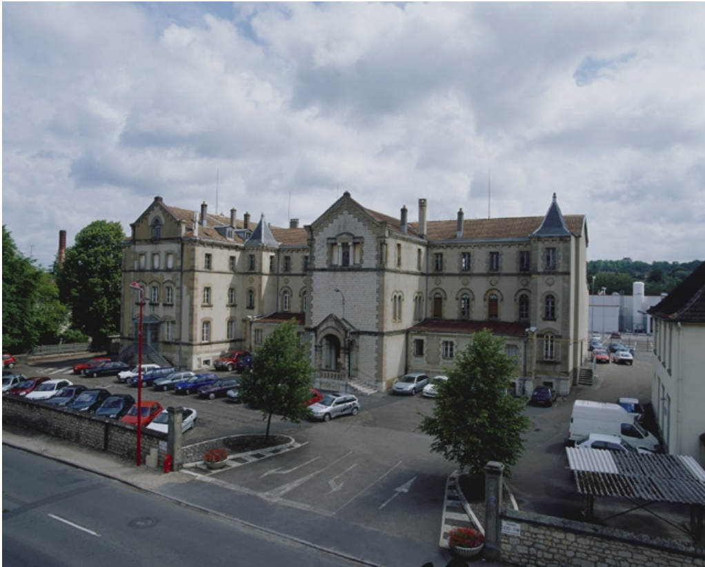
Vue d'ensemble de l'ancien couvent (actuellement bureaux).