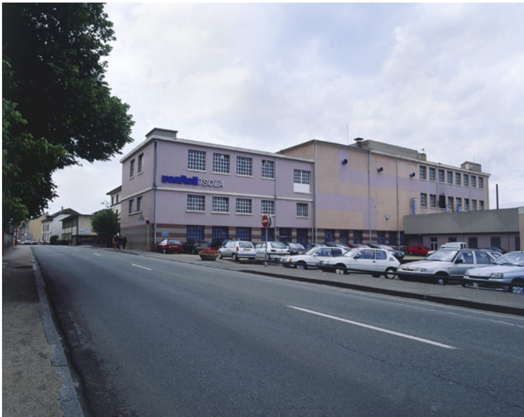
Atelier d'enduction verticale depuis le nord.