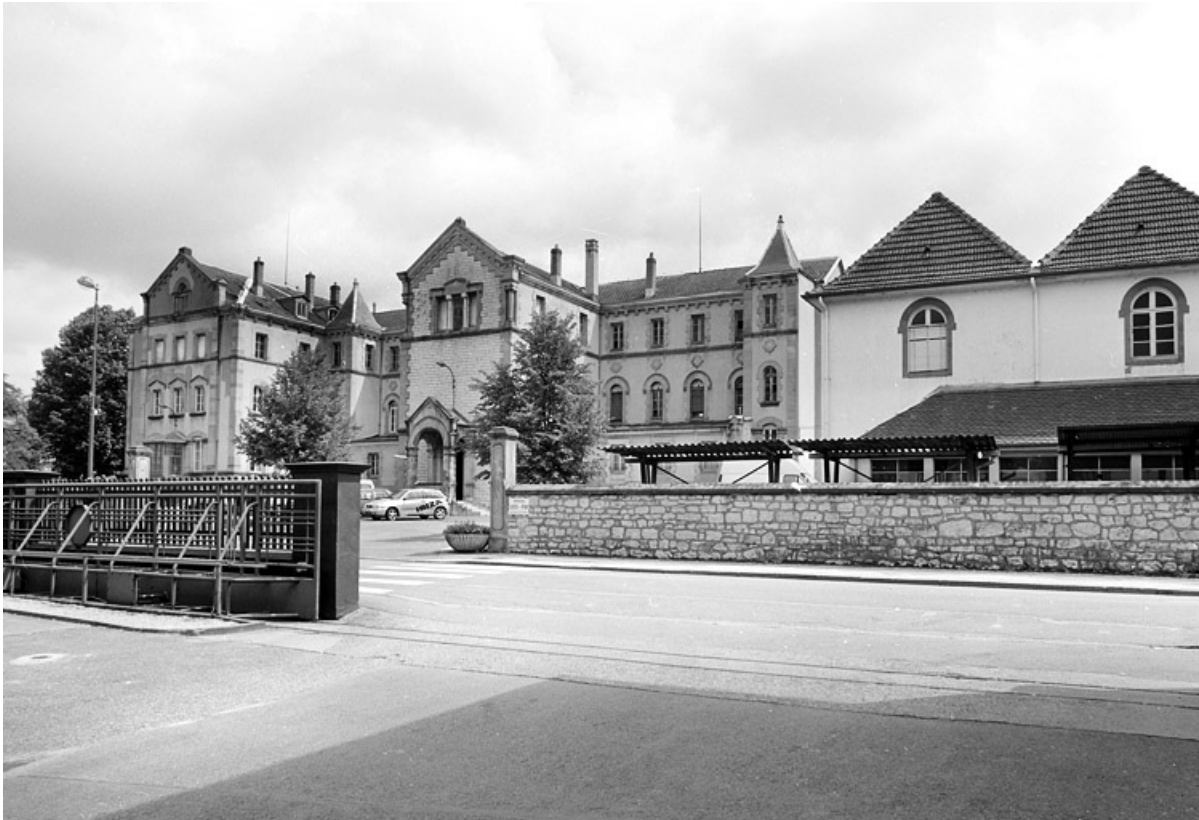
Bâtiment administratif (ancien couvent) et laboratoire.