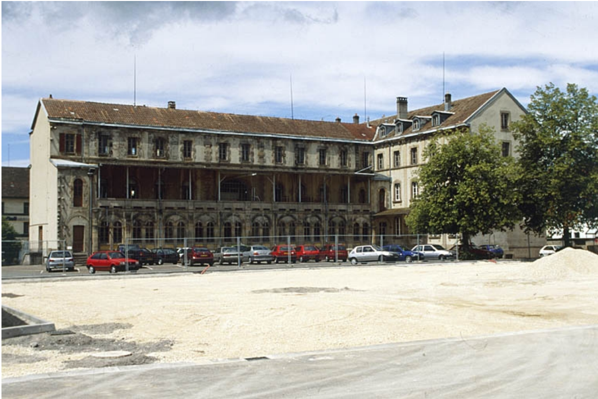
Façade est de l'ancien couvent de dominicaines.