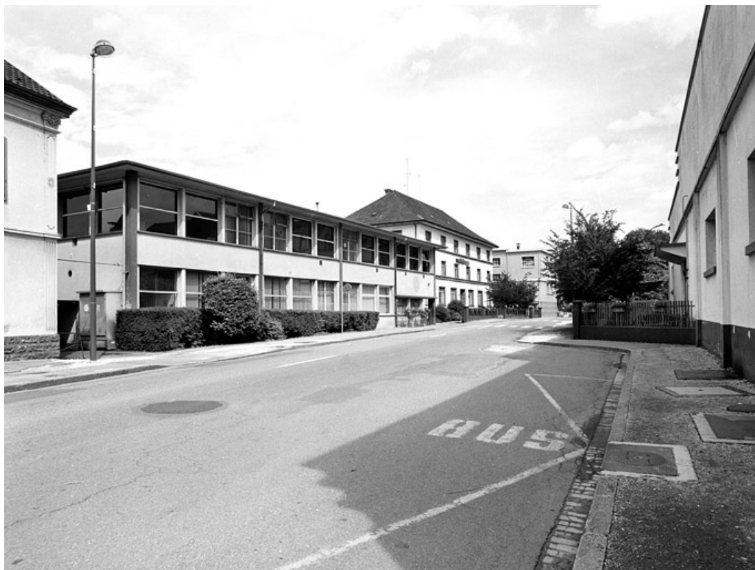
Façades sur rue de bâtiments administratifs.