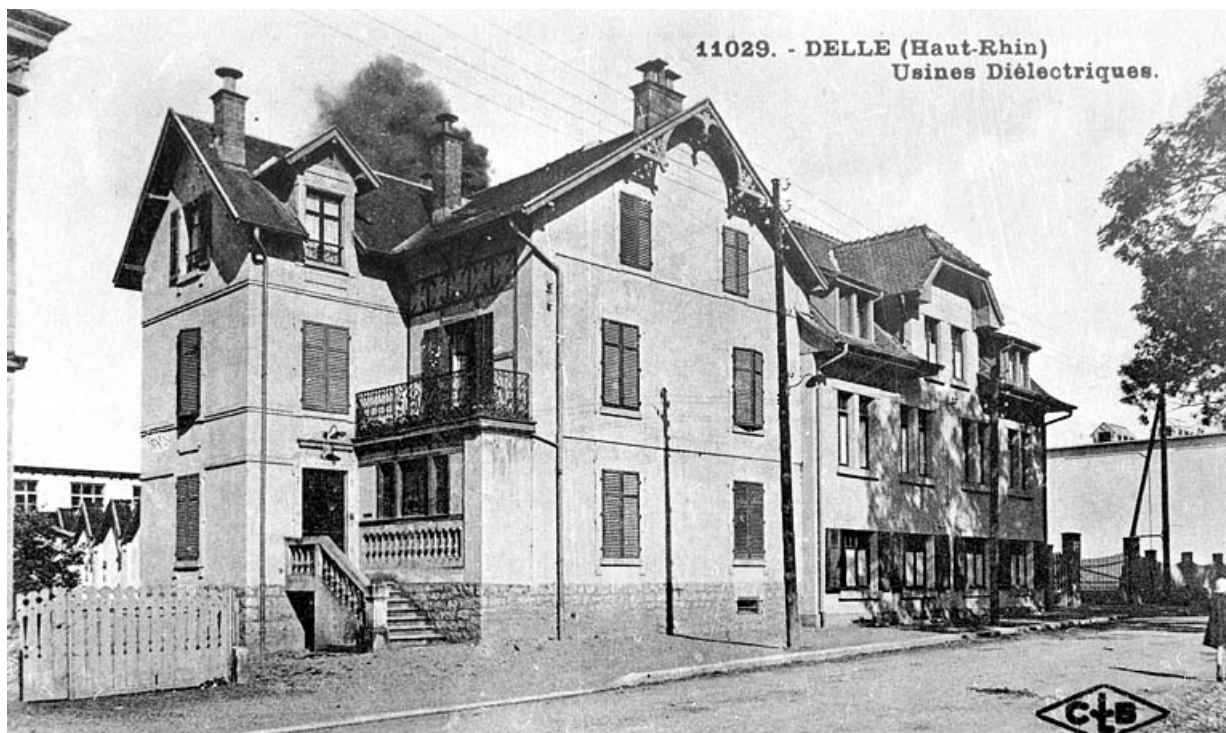
Delle (Haut-Rhin) - Usines Diélectriques.