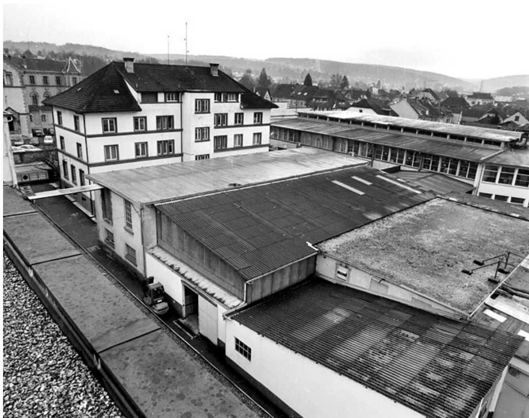
Vue plongeante sur les bureaux, le magasin d'expédition et l'ancienne chaufferie.