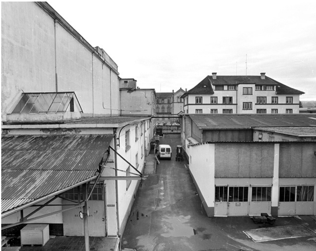
Atelier de fabrication (à droite), ancien couvent (au fond) et bureaux (à droite). 90, Delle, 27 faubourg de Belfort