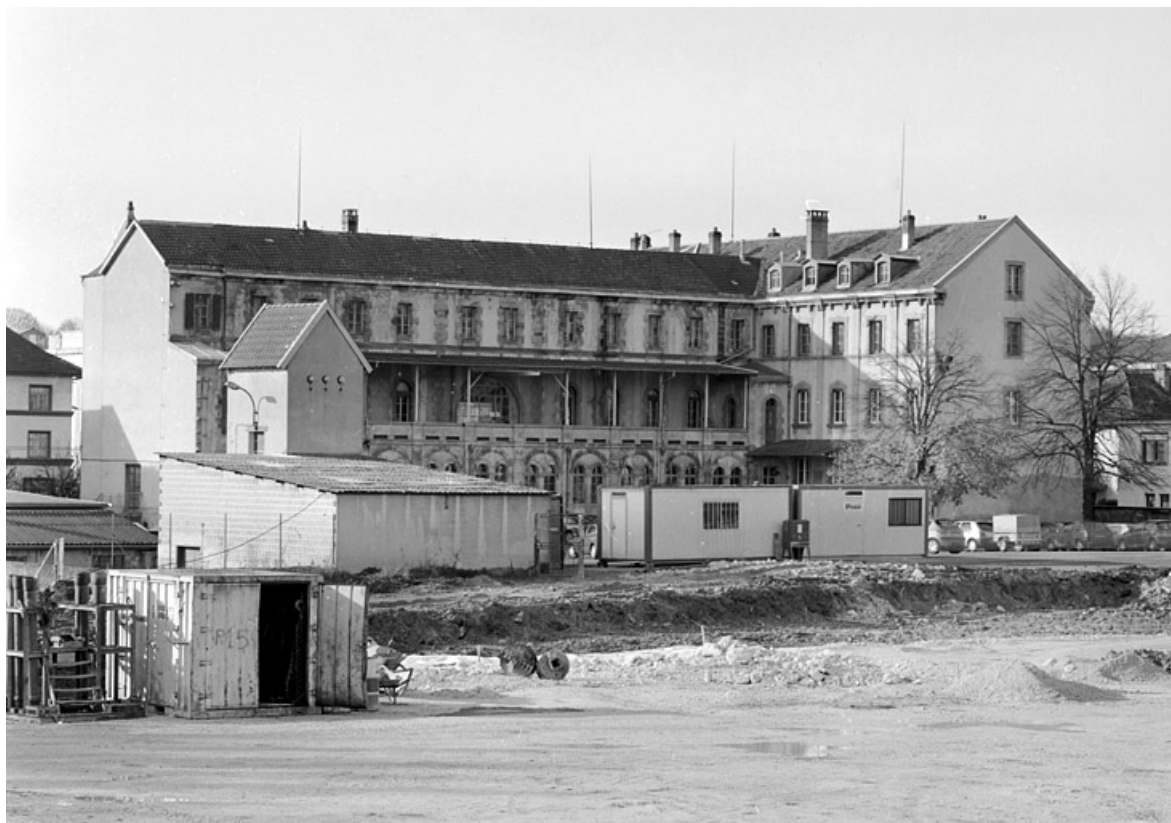
Vue de trois quarts arrière de l'ancien couvent de dominicaines.