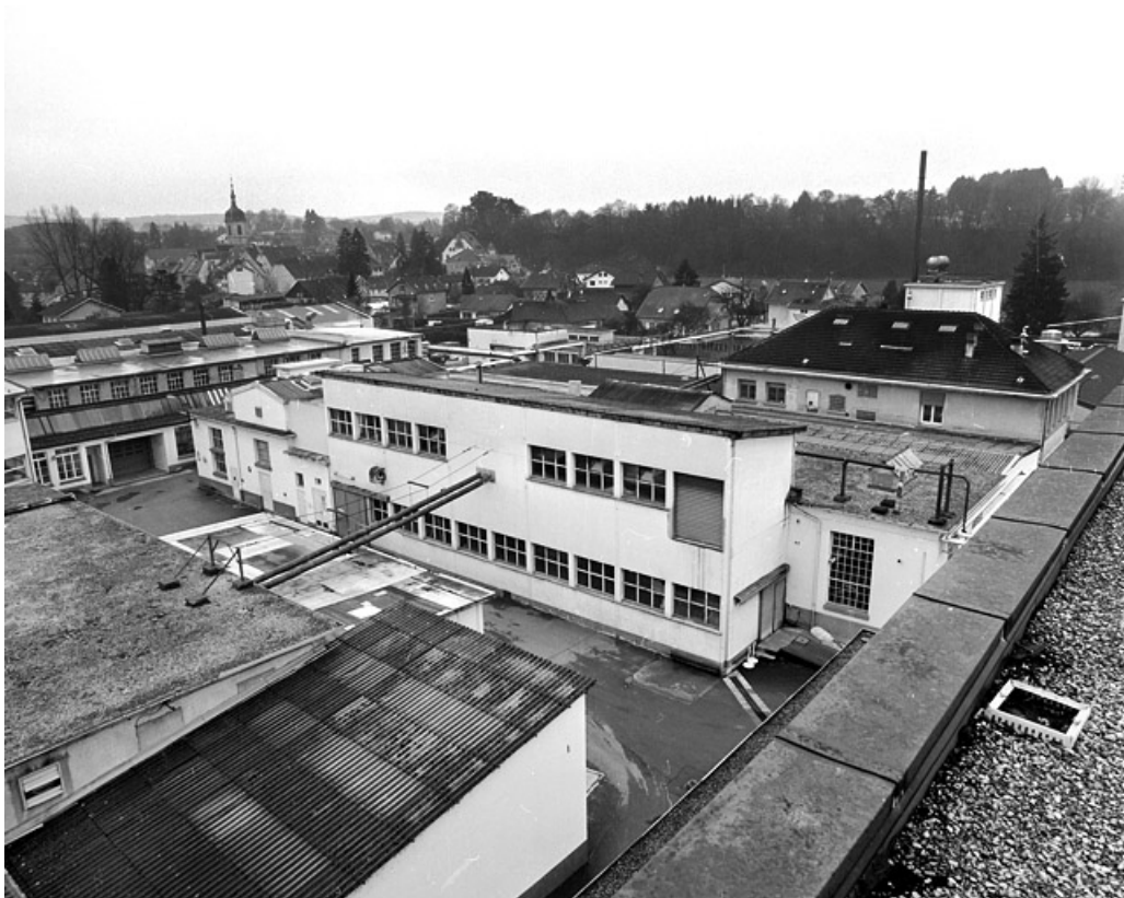
Vue plongeante vers le sud-ouest.