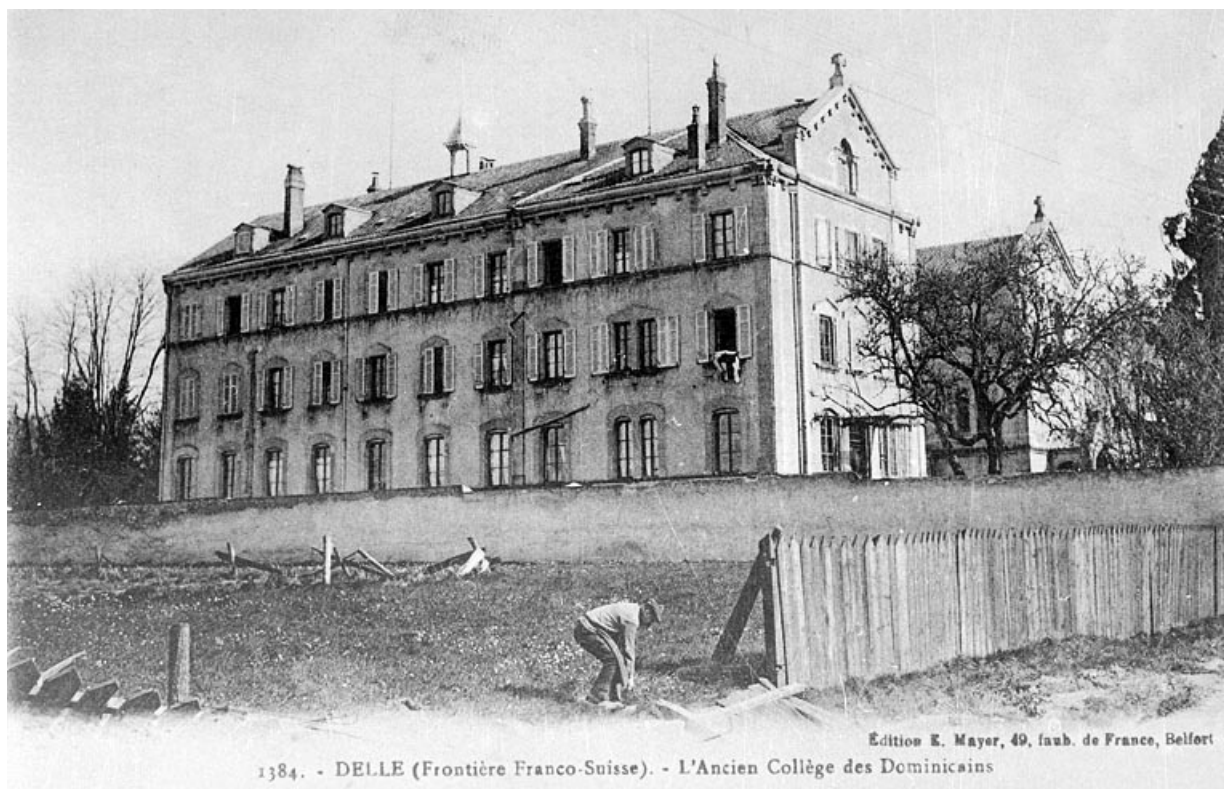
Delle (Frontière franco-suisse). L'ancien collège des Dominicains.