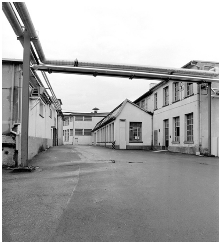
Atelier de fabrication (amiantes, ambérites).