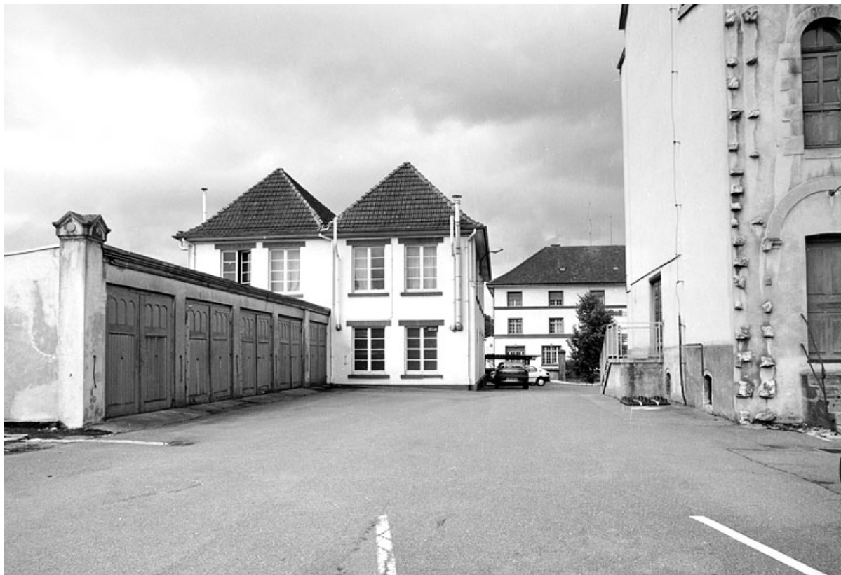
Remises et laboratoire depuis l'est.