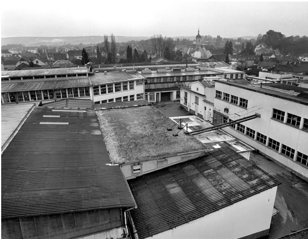
Vue plongeante vers le sud.