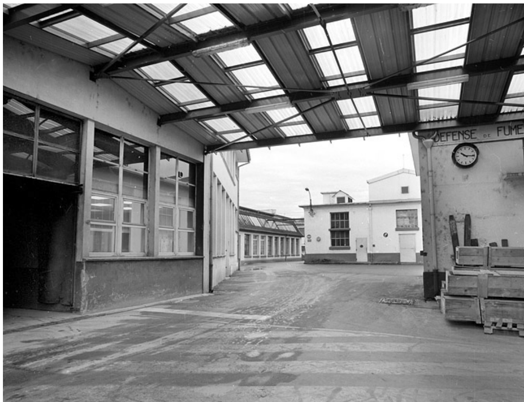
Ateliers de fabrication depuis l'est.