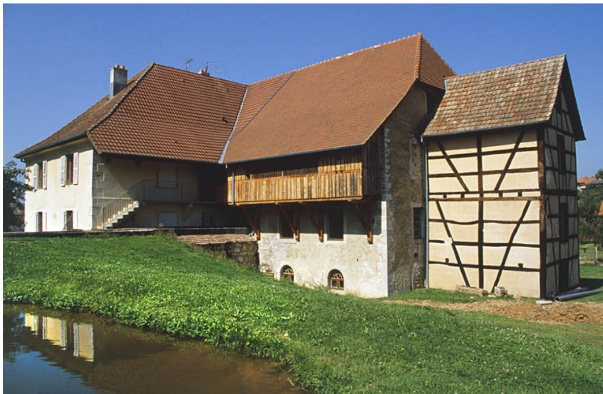
Façade postérieure du logement et des ateliers de fabrication.