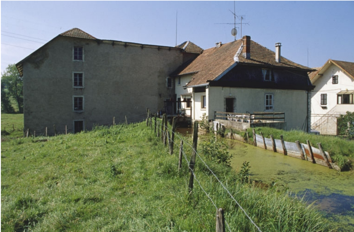
Canal d'amenée et extension de l'atelier de fabrication.