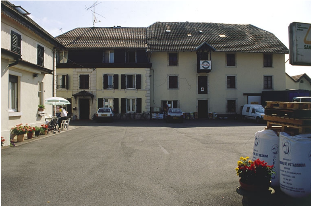
Façade du logement et de l'atelier de fabrication.