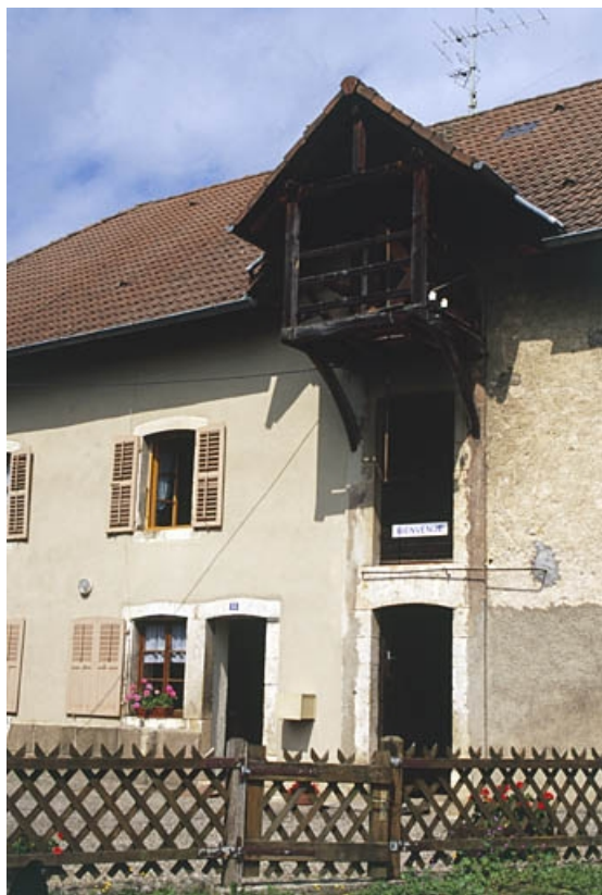
Logement accolé à la minoterie.