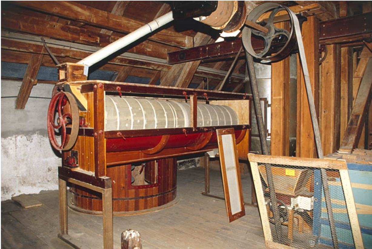
Bluterie à l'étage en surcroît.