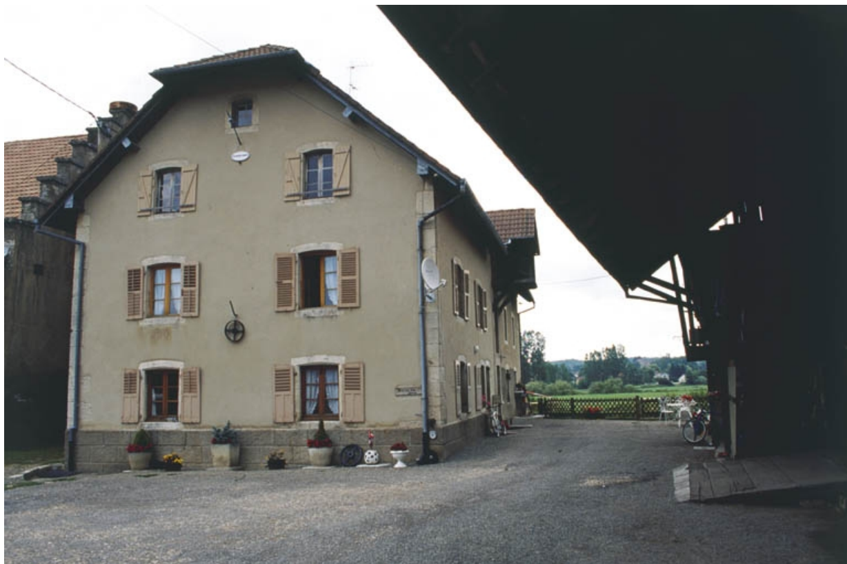
La minoterie et son logement depuis l'ouest.