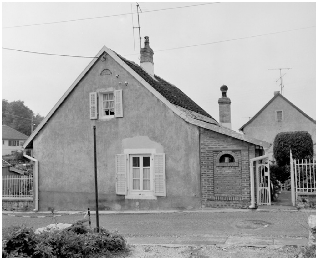
Maison au n° 10, rue des Mélèzes : façade sur rue en 1981. SRI. Enquête régionale sur les bâtiments industriels (1979-1981). 90, Beaucourt, lieudit : cité Pierre Japy