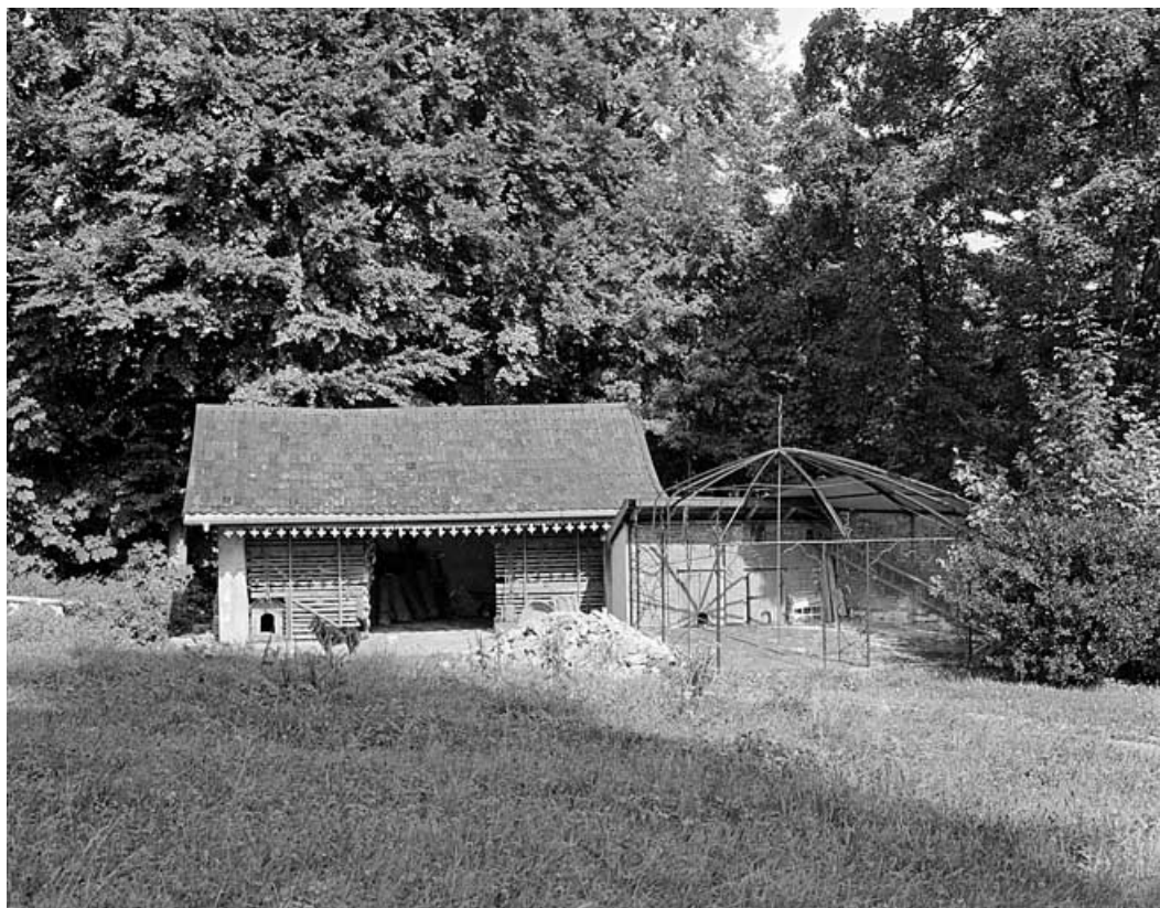
Bûcher et chenil en 1981. SRI. Enquête régionale sur les bâtiments industriels (1979-1981). 90, Beaucourt rue Sous les Vignes