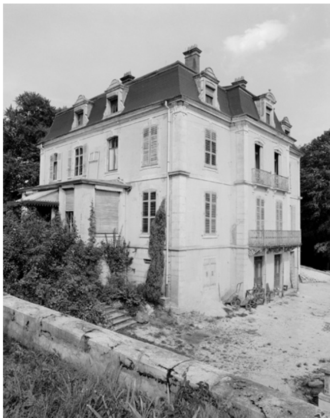
Façades ouest et sud en 1981. SRI. Enquête régionale sur les bâtiments industriels (1979-1981). 90, Beaucourt rue Sous les Vignes