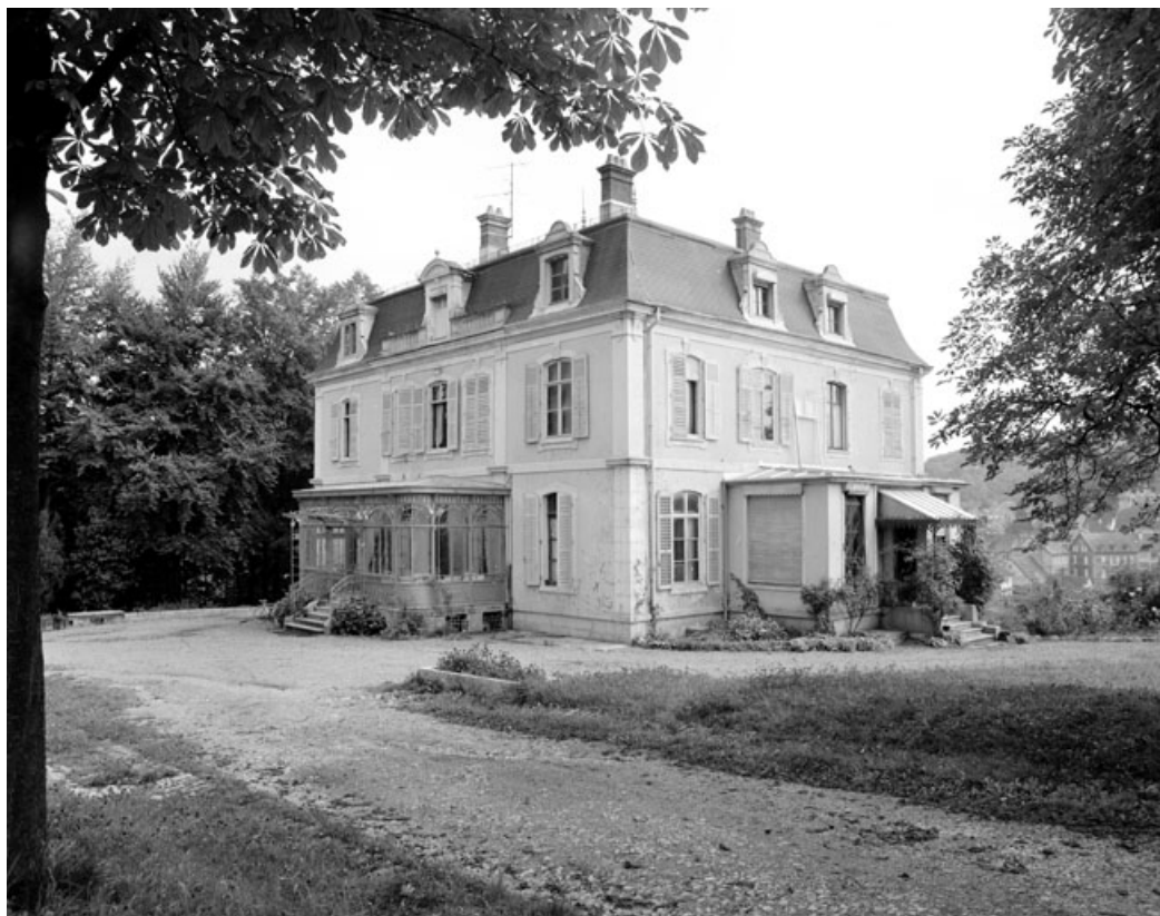
Vue de trois quarts depuis le nord-ouest en 1981. SRI. Enquête régionale sur les bâtiments industriels (1979-1981). 90, Beaucourt rue Sous les Vignes