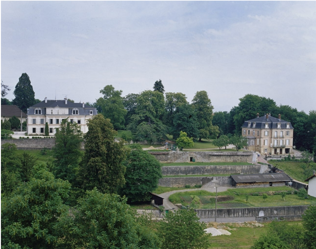
Vue d'ensemble depuis le sud (à droite).