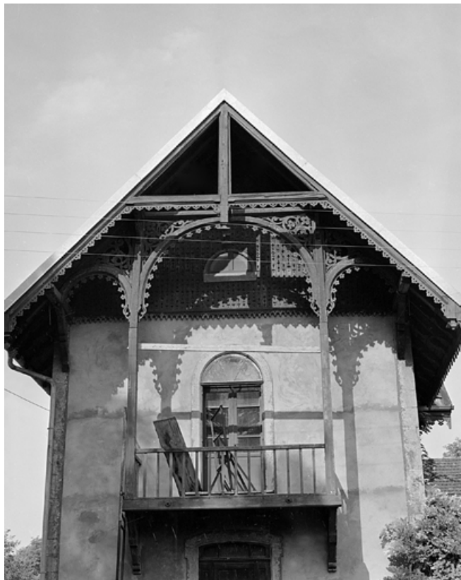
Détail du pignon de la conciergerie en 1981. SRI. Enquête régionale sur les bâtiments industriels (1979-1981). 90, Beaucourt rue Sous les Vignes