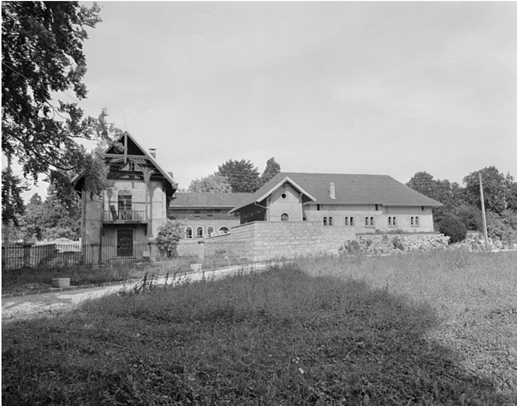
Bâtiments agricoles depuis le sud en 1981. SRI. Enquête régionale sur les bâtiments industriels (1979-1981). 90, Beaucourt rue Sous les Vignes