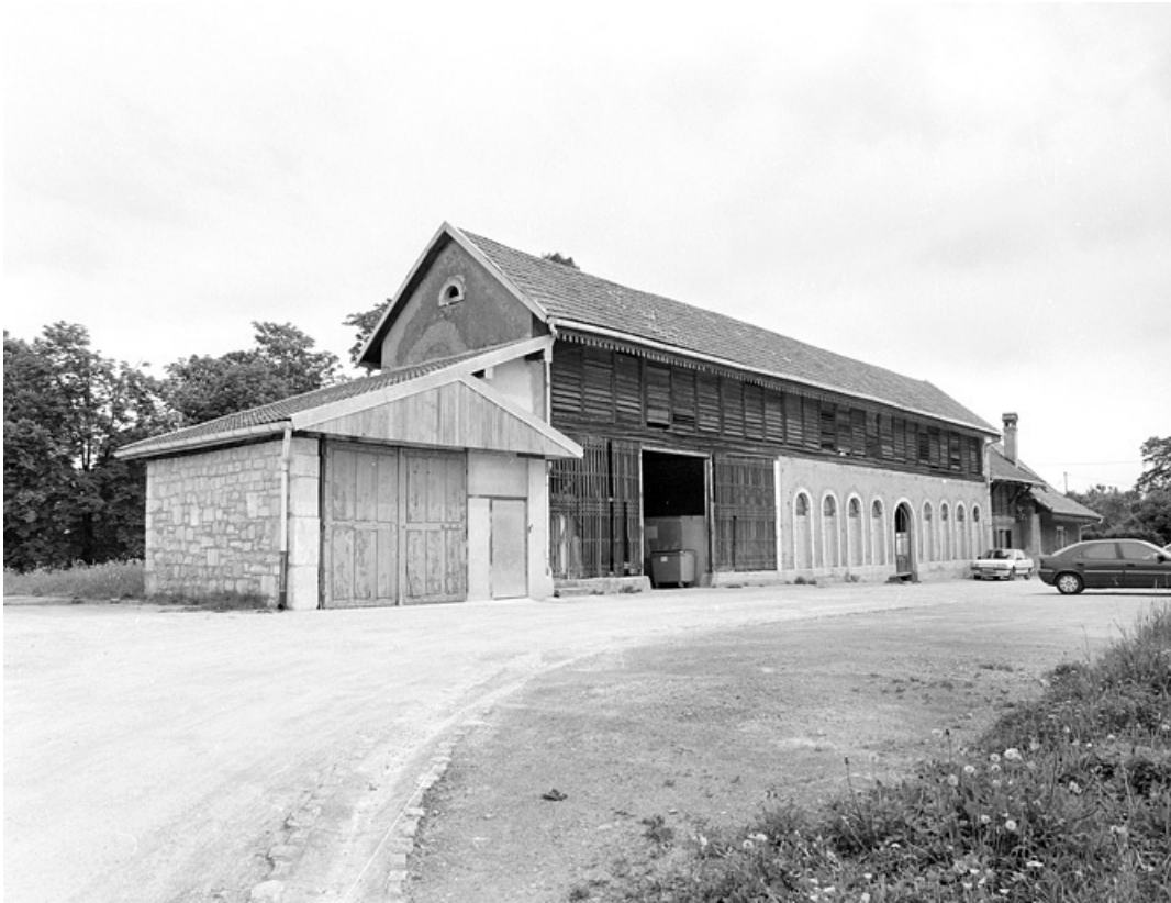
Vue de trois quarts de l'orangerie.