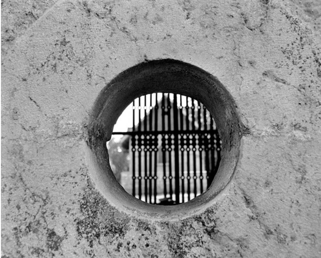
L'orangerie en 1981. Détail d'une baie d'aération. SRI. Enquête régionale sur les bâtiments industriels (1979-1981). 90, Beaucourt rue Sous les Vignes