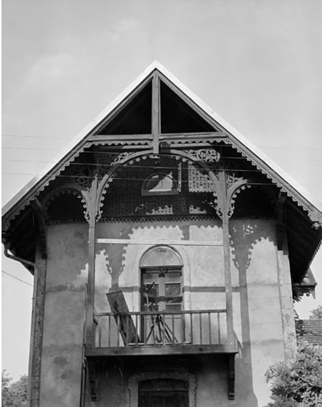
Détail du pignon de la conciergerie en 1981. 90, Beaucourt rue Sous les Vignes