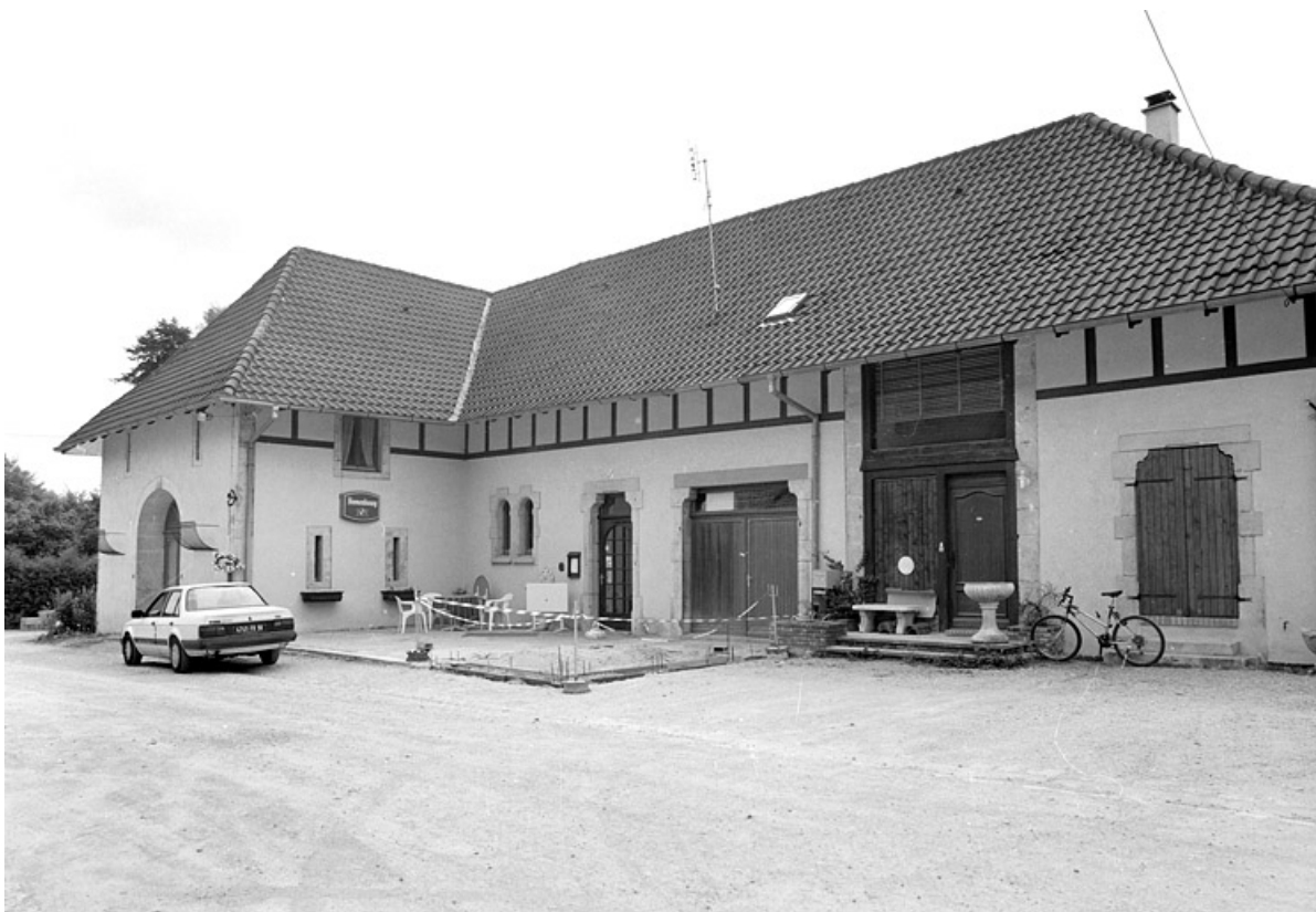
Bâtiment à usage agricole (étable, fenil).