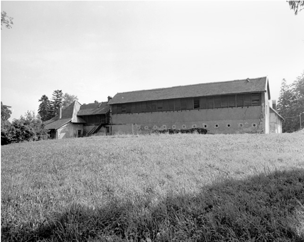
Façade nord de l'orangerie en 1981. SRI. Enquête régionale sur les bâtiments industriels (1979-1981). 90, Beaucourt rue Sous les Vignes