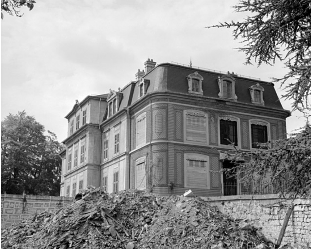
Façades sud et nord vues de trois quarts en 1981. SRI. Enquête régionale sur les bâtiments industriels (1979-1981). 90, Beaucourt rue Sous les Vignes