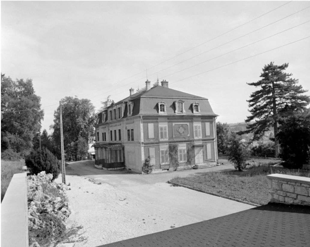
Vue de trois quarts arrière en 1981. SRI. Enquête régionale sur les bâtiments industriels (1979-1981). 90, Beaucourt rue Sous les Vignes