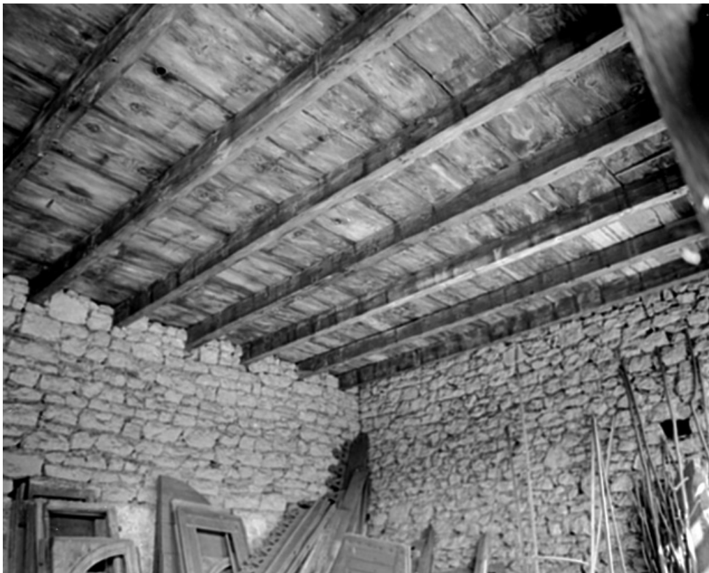
Intérieur de l'orangerie en 1981. SRI. Inventaire topographique du canton de Beaucourt (1981-1982). 90, Beaucourt rue Sous les Vignes