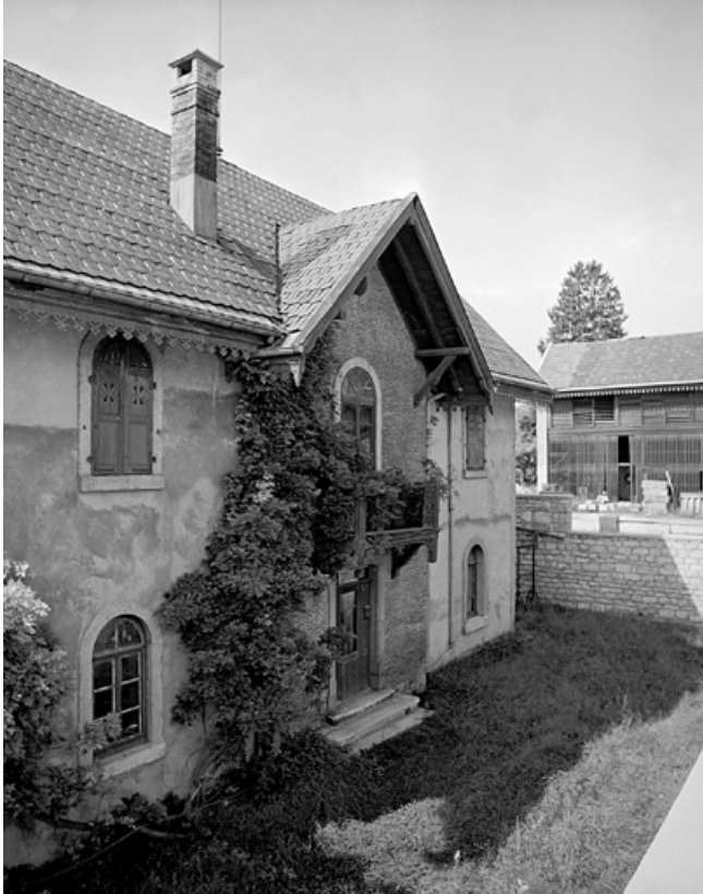
Façade est de la conciergerie en 1981. SRI. Enquête régionale sur les bâtiments industriels (1979-1981). 90, Beaucourt rue Sous les Vignes