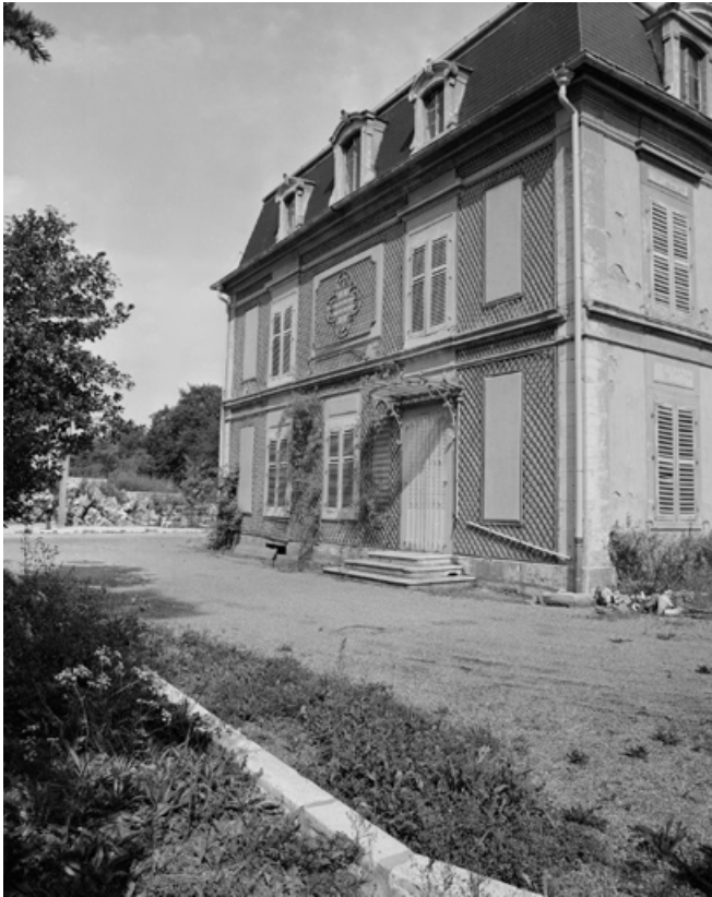
Façade ouest vue de trois quarts en 1981. SRI. Enquête régionale sur les bâtiments industriels (1979-1981). 90, Beaucourt rue Sous les Vignes