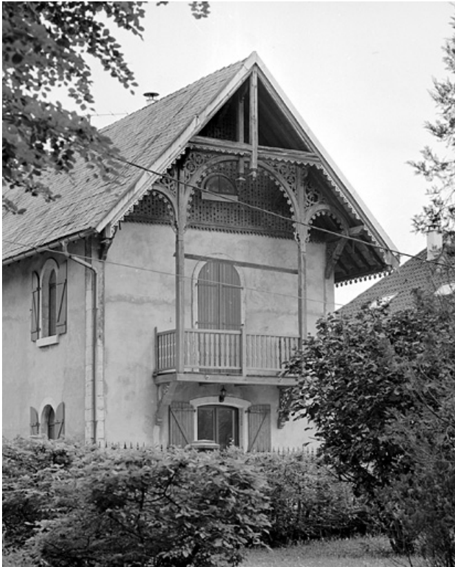
Détail du pignon de la conciergerie.