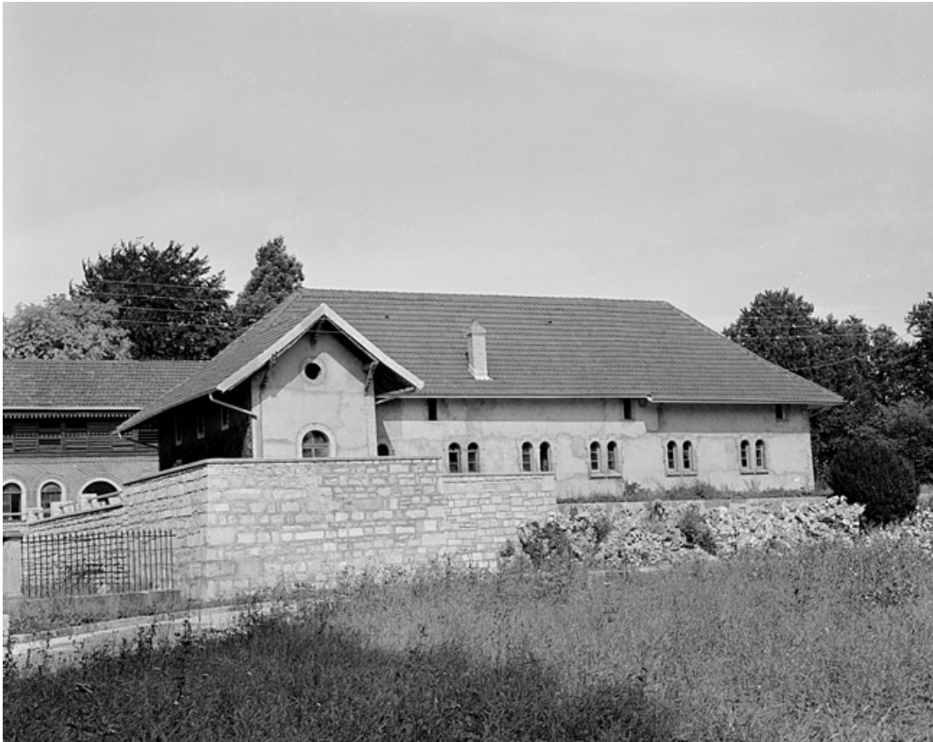
Façade sud des écuries en 1981. SRI. Enquête régionale sur les bâtiments industriels (1979-1981). 90, Beaucourt rue Sous les Vignes