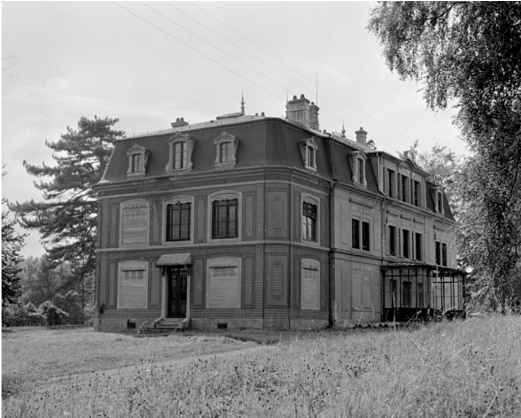
Façades est et nord vues de trois quarts en 1981. SRI. Enquête régionale sur les bâtiments industriels (1979-1981). 90, Beaucourt rue Sous les Vignes