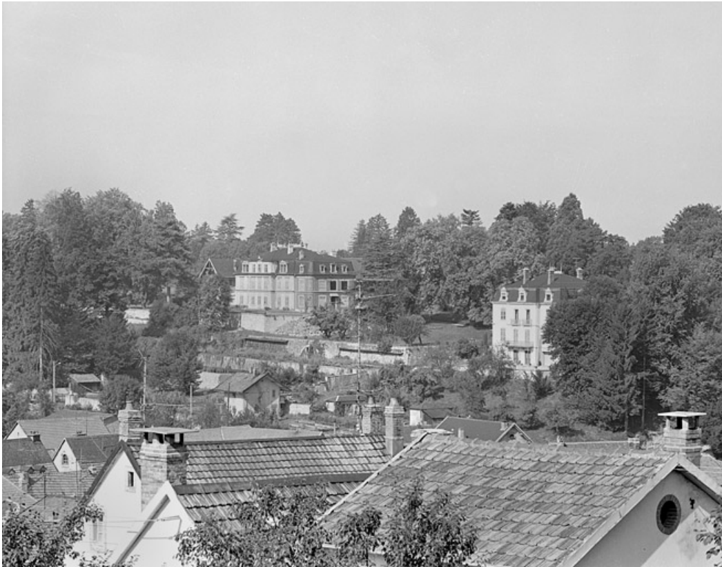
Vue d'ensemble depuis le sud-est (à gauche) en 1981. SRI. Enquête régionale sur les bâtiments industriels (1979-1981). 90, Beaucourt