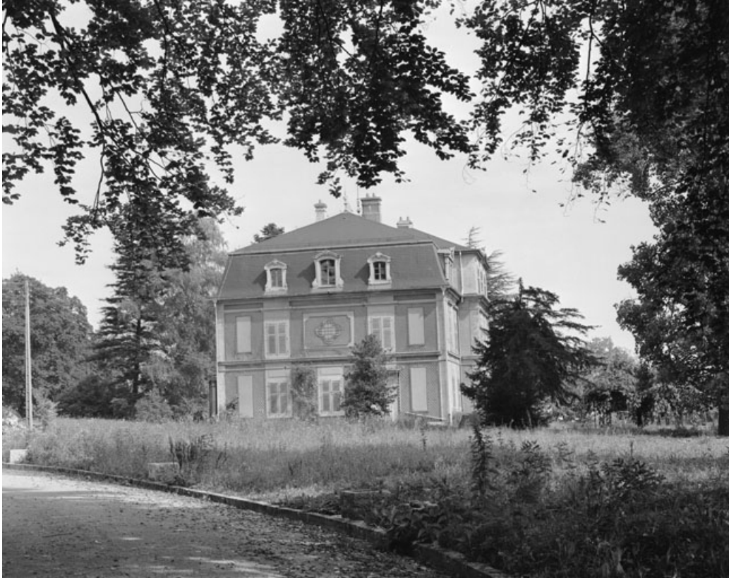
Façade ouest en 1981. SRI. Enquête régionale sur les bâtiments industriels (1979-1981). 90, Beaucourt rue Sous les Vignes