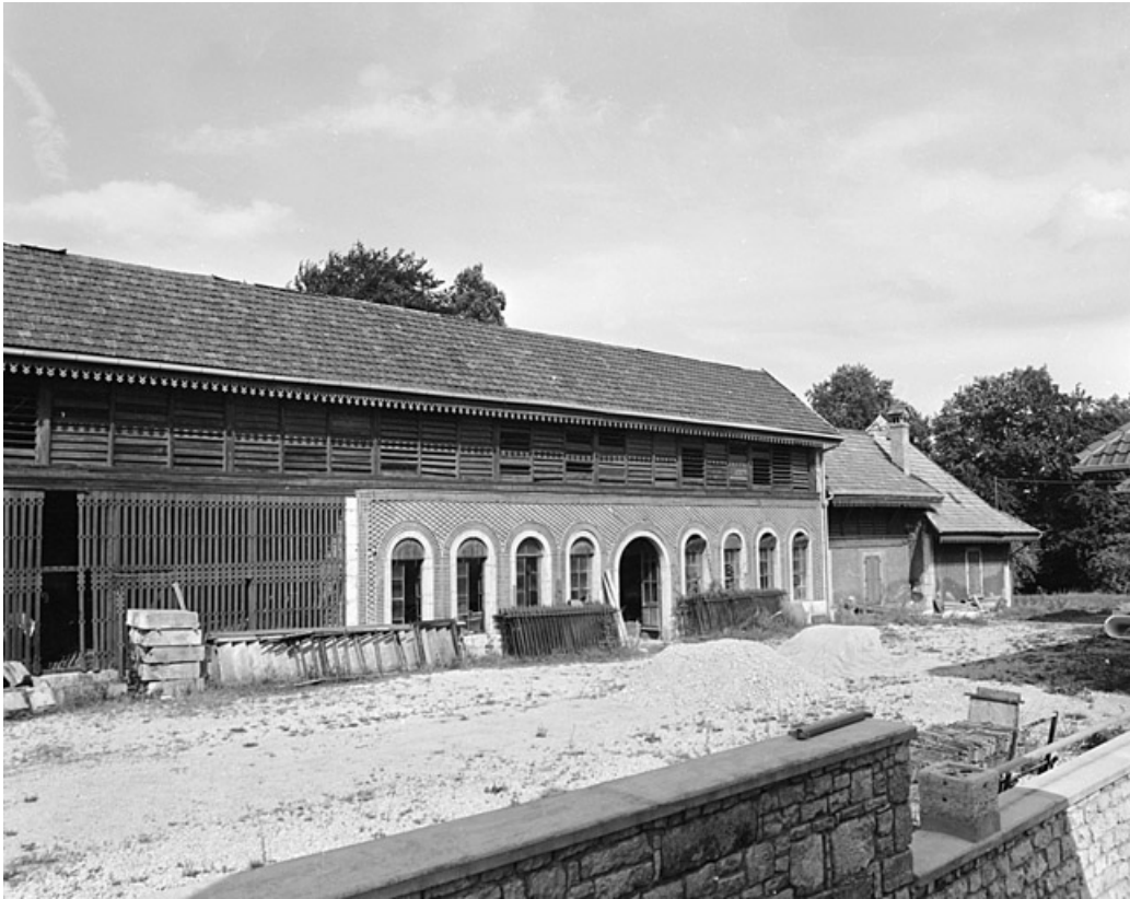
Façade sud de l'orangerie en 1981. SRI. Enquête régionale sur les bâtiments industriels (1979-1981). 90, Beaucourt rue Sous les Vignes