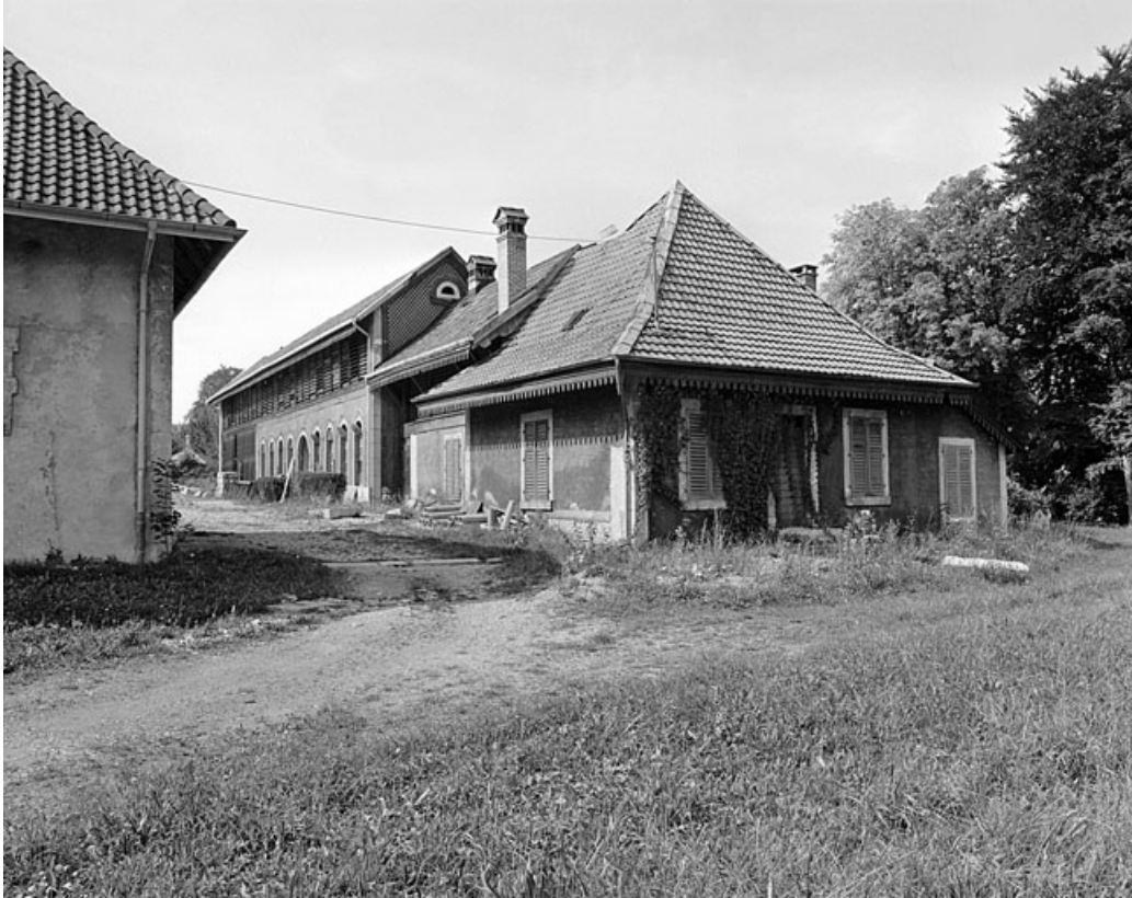
Vue de trois quarts de l'orangerie et du logement en 1981. SRI. Enquête régionale sur les bâtiments industriels (1979-1981). 90, Beaucourt rue Sous les Vignes