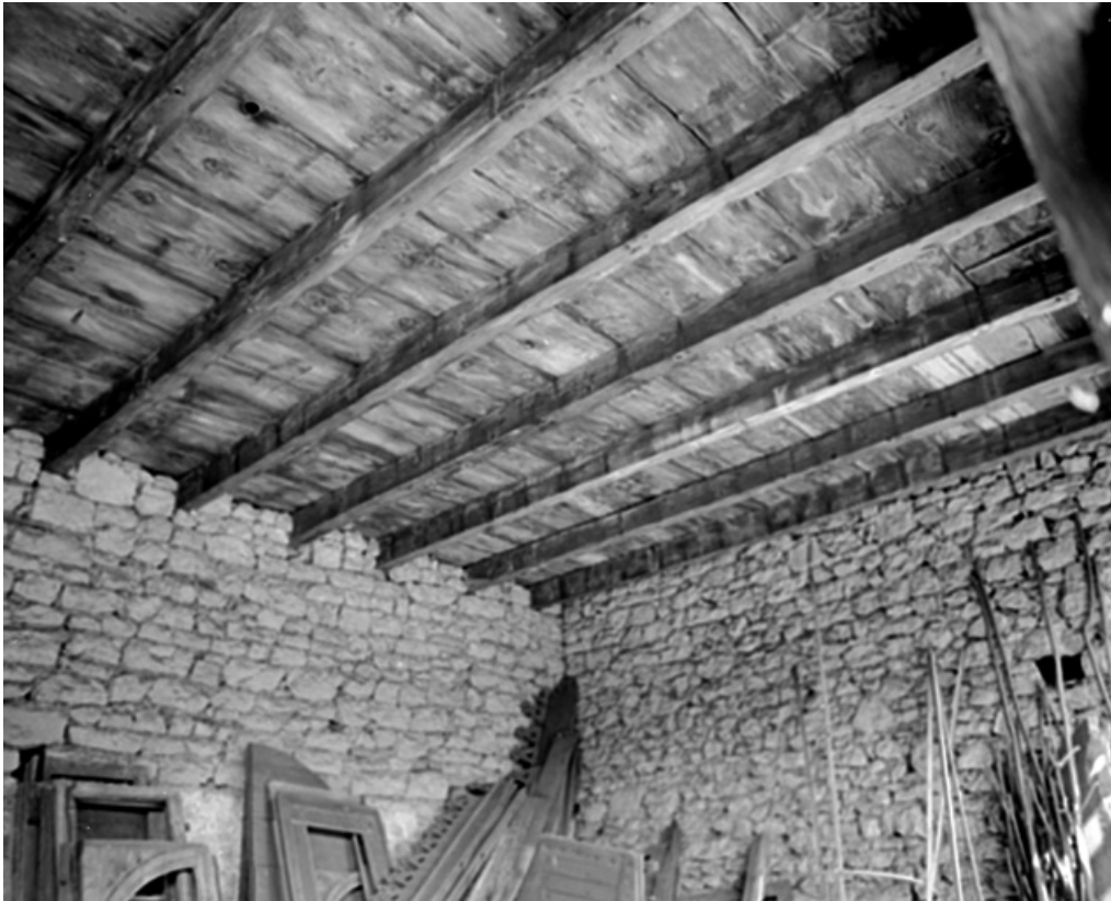
Intérieur de l'orangerie en 1981. SRI. Inventaire topographique du canton de Beaucourt (1981-1982). 90, Beaucourt rue Sous les Vignes