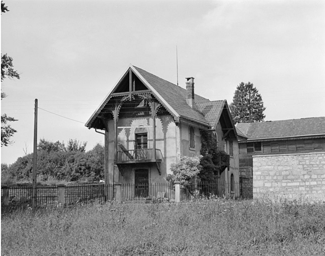
La conciergerie depuis le sud en 1981. SRI. Enquête régionale sur les bâtiments industriels (1979-1981). 90, Beaucourt rue Sous les Vignes