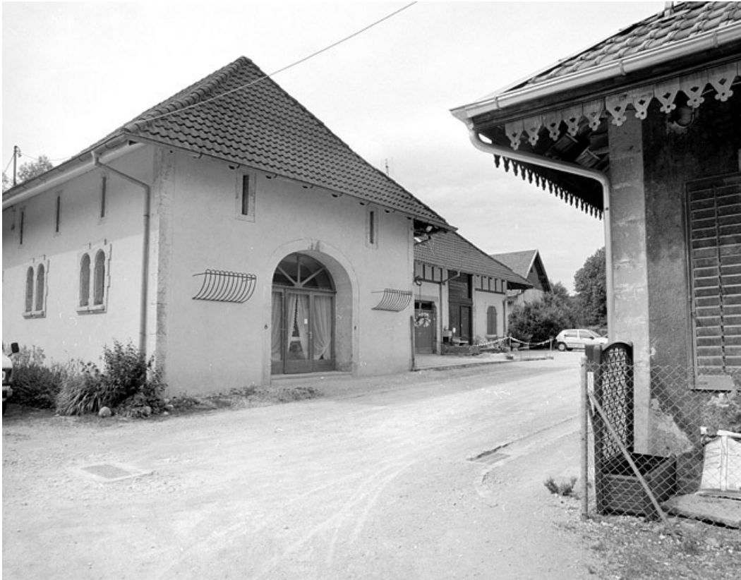
Vue de trois quarts du bâtiment à usage agricole (étable, fenil).