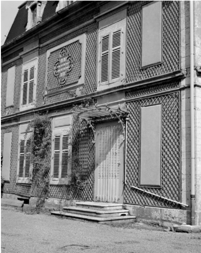
Détail de la façade ouest en 1981. SRI. Enquête régionale sur les bâtiments industriels (1979-1981). 90, Beaucourt rue Sous les Vignes