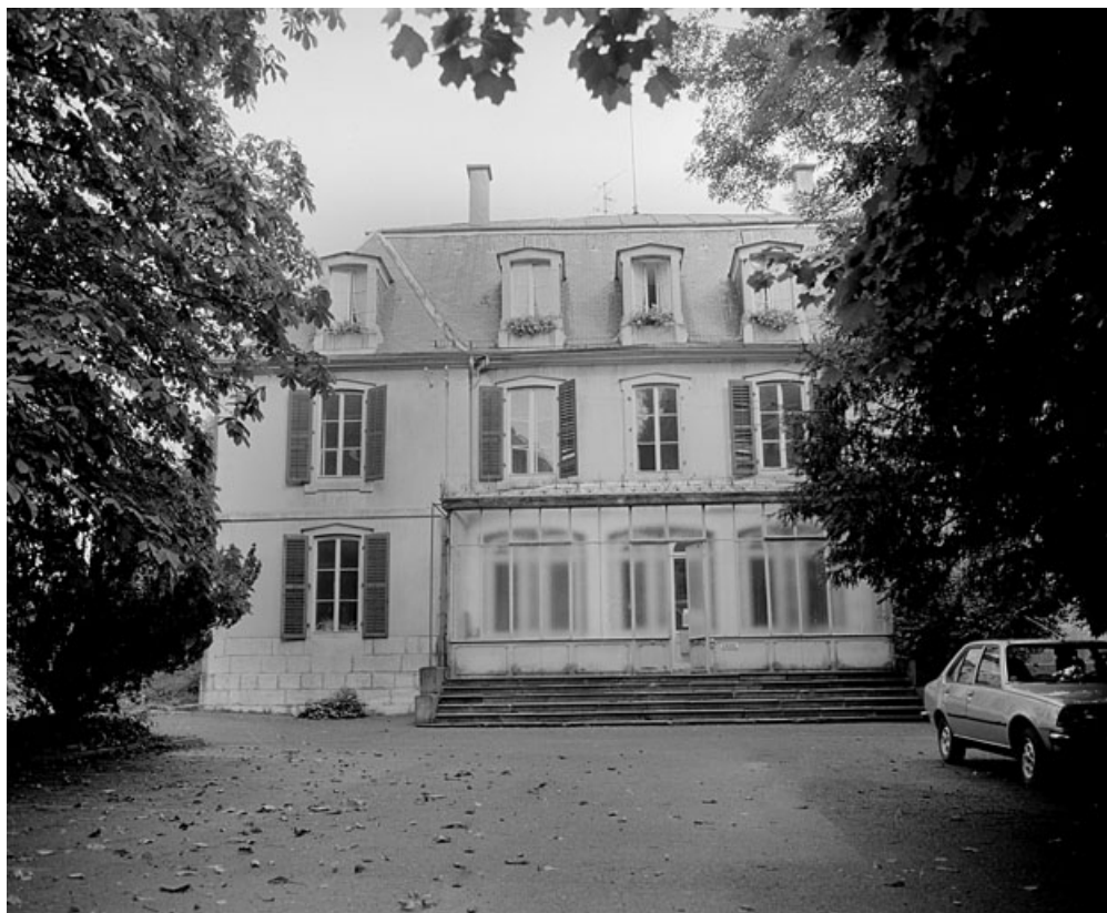
Façade sud en 1981. SRI. Enquête régionale sur les bâtiments industriels (1979-1981). 90, Beaucourt parc des Cèdres