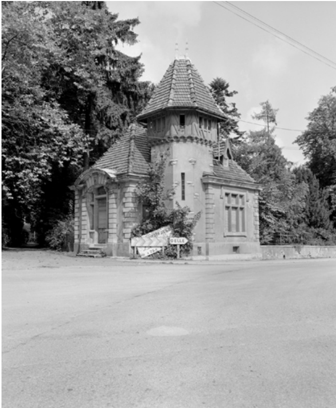
Conciergerie en 1981. SRI. Enquête régionale sur les bâtiments industriels (1979-1981). 90, Beaucourt parc des Cèdres