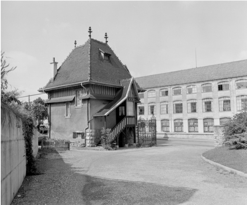
Conciergerie. Vue depuis le sud-est en 1981. SRI. Enquête régionale sur les bâtiments industriels (1979-1981). 90, Beaucourt, 7 rue Frédéric Japy