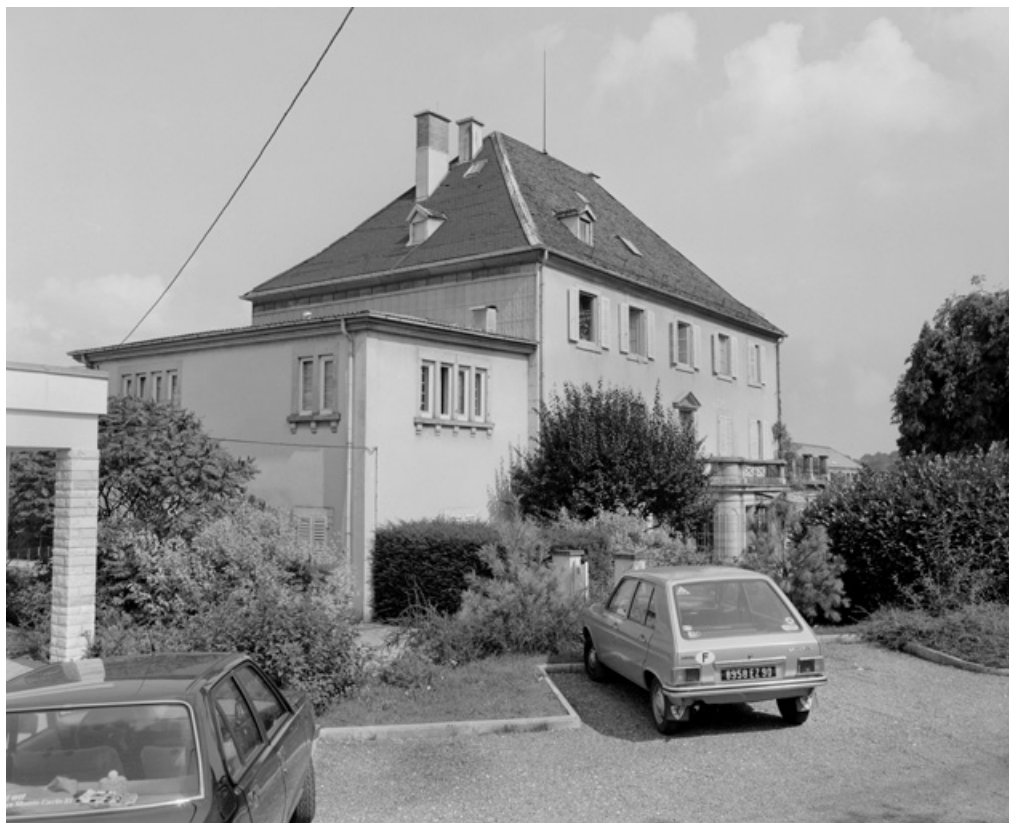
Façade postérieure en 1981. SRI. Enquête régionale sur les bâtiments industriels (1979-1981). 90, Beaucourt, 7 rue Frédéric Japy