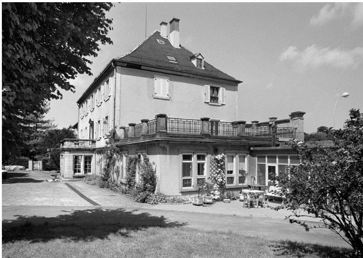
Vue depuis l'est.