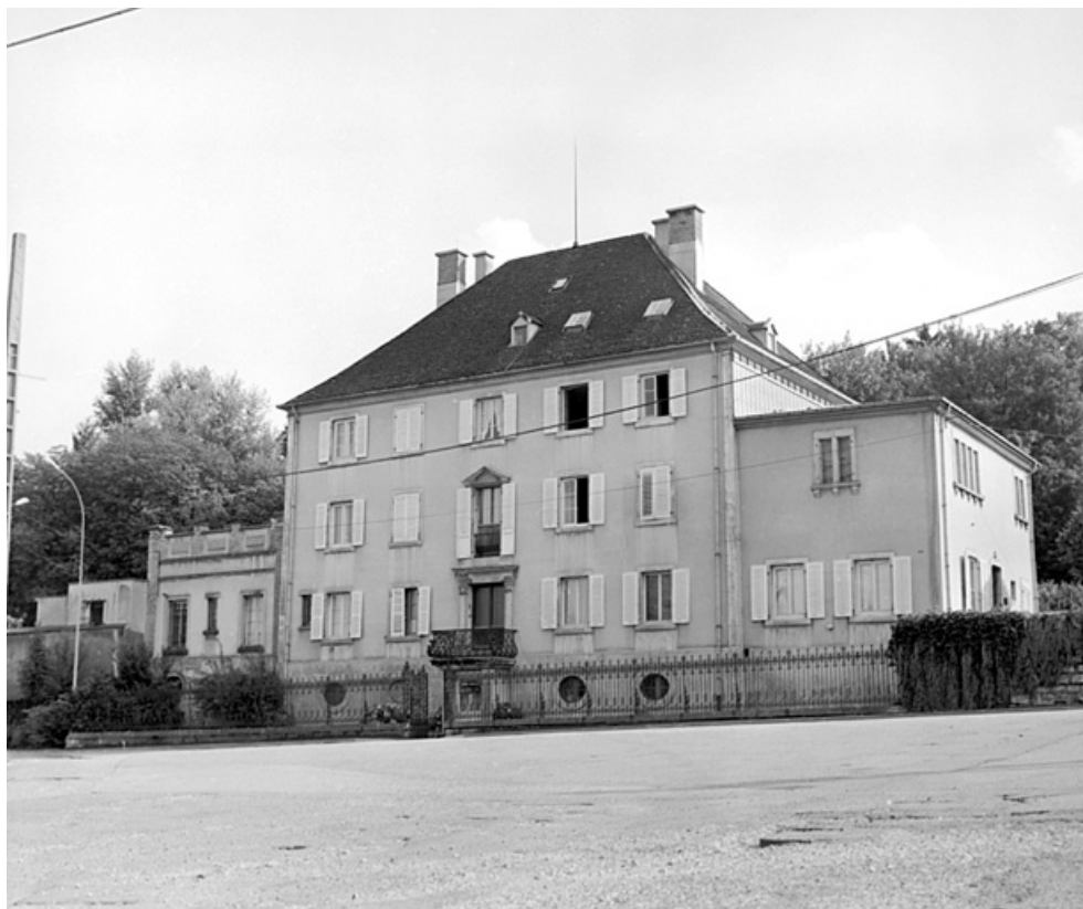
Façade sur rue en 1981. SRI. Enquête régionale sur les bâtiments industriels (1979-1981). 90, Beaucourt, 7 rue Frédéric Japy