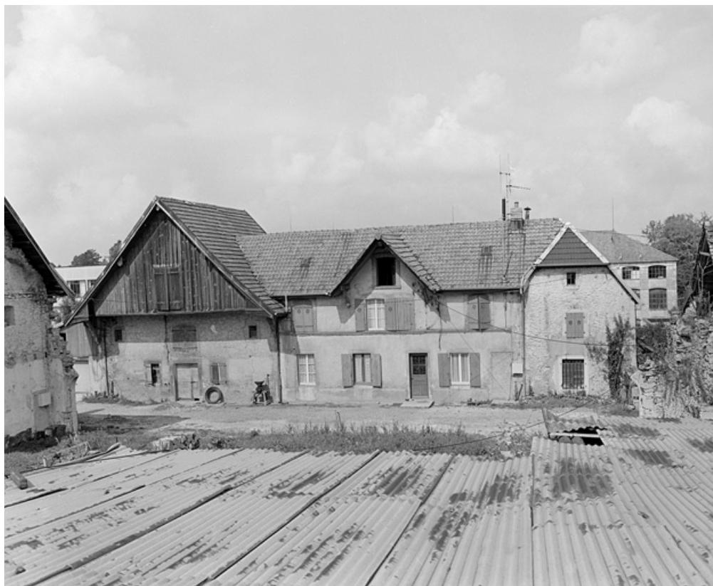
Dépendances : ferme des Grandes Planches. Façade postérieure en 1981. SRI. Enquête régionale sur les bâtiments industriels (1979-1981).