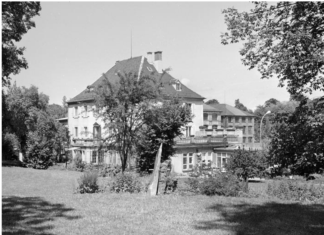
Vue d'ensemble depuis le jardin.