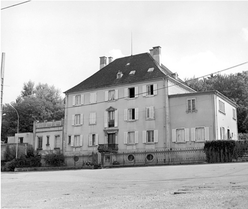
Façade sur rue en 1981. SRI. Enquête régionale sur les bâtiments industriels (1979-1981). 90, Beaucourt, 7 rue Frédéric Japy