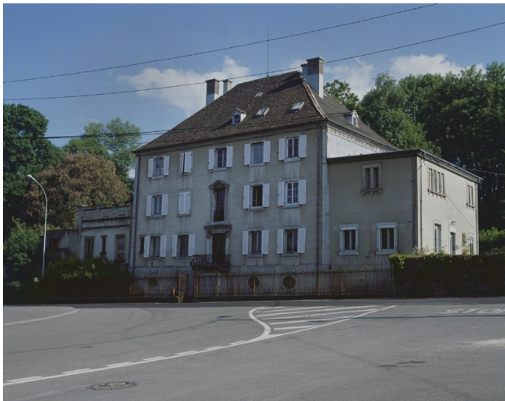
Vue d'ensemble depuis le nord-ouest.