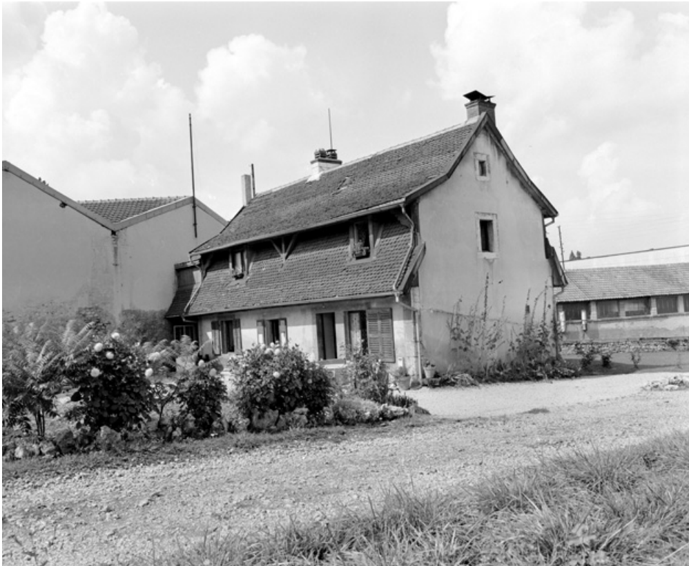
Logement du jardinier. Façade postérieure en 1981. SRI. Enquête régionale sur les bâtiments industriels (1979-1981). 90, Beaucourt, 7 rue Frédéric Japy