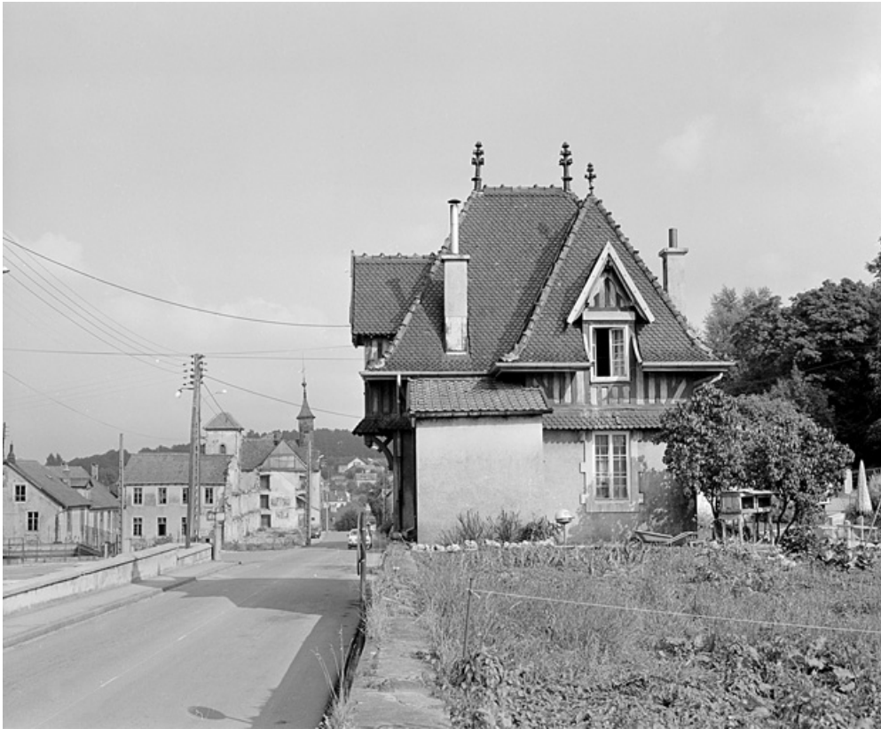
Conciergerie. Façade ouest en 1981. SRI. Enquête régionale sur les bâtiments industriels (1979-1981). 90, Beaucourt, 7 rue Frédéric Japy