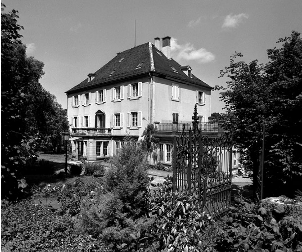
Vue de trois quarts depuis le sud-est.