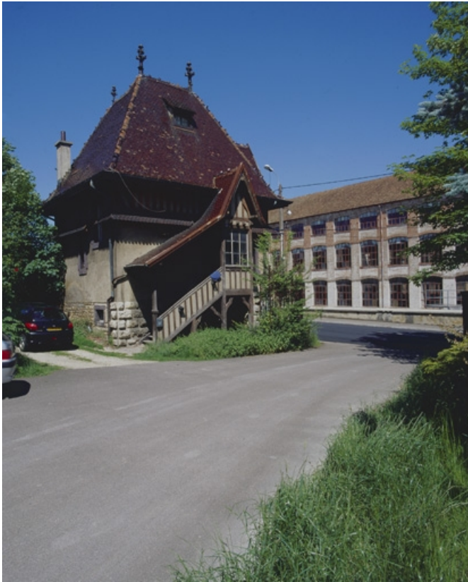
Vue de trois quarts de la conciergerie.