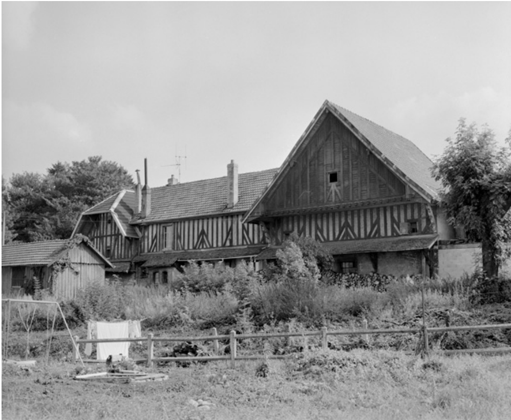
Dépendances : ferme des Grandes Planches. Façade antérieure en 1981. SRI. Enquête régionale sur les bâtiments industriels (1979-1981).