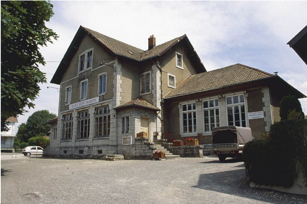
Façade antérieure depuis l'ouest.