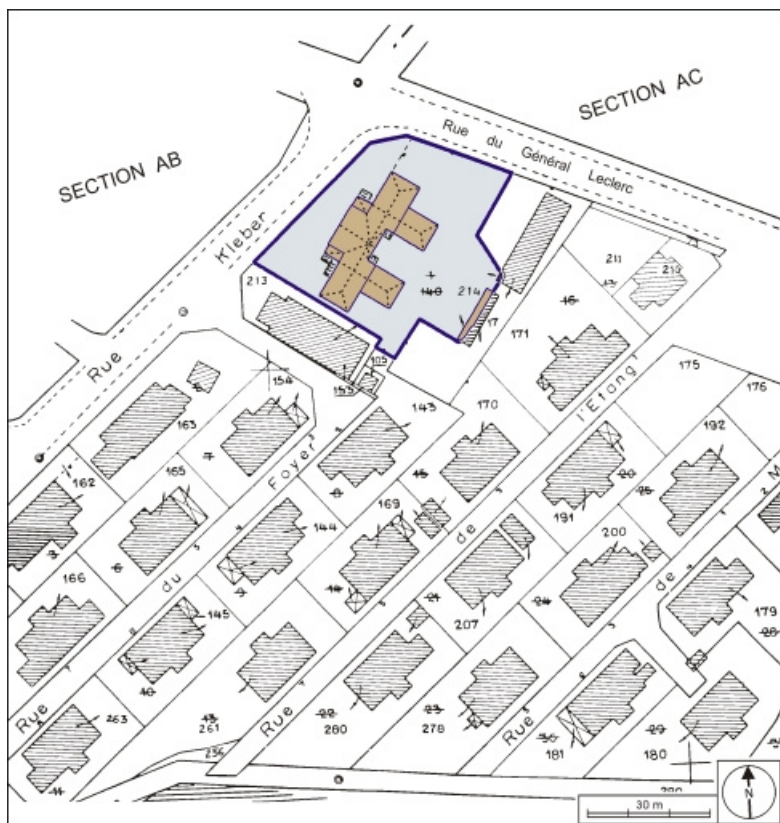
Plan-masse et de situation. Extrait du plan cadastral, 1984, section AH, 1:1000. 90, Grandvillars, 2 rue Kléber