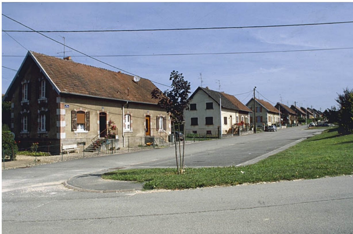
Vue d'ensemble de la rue des Combes.

90, Grandvillars, lieudit : cité Bellevue