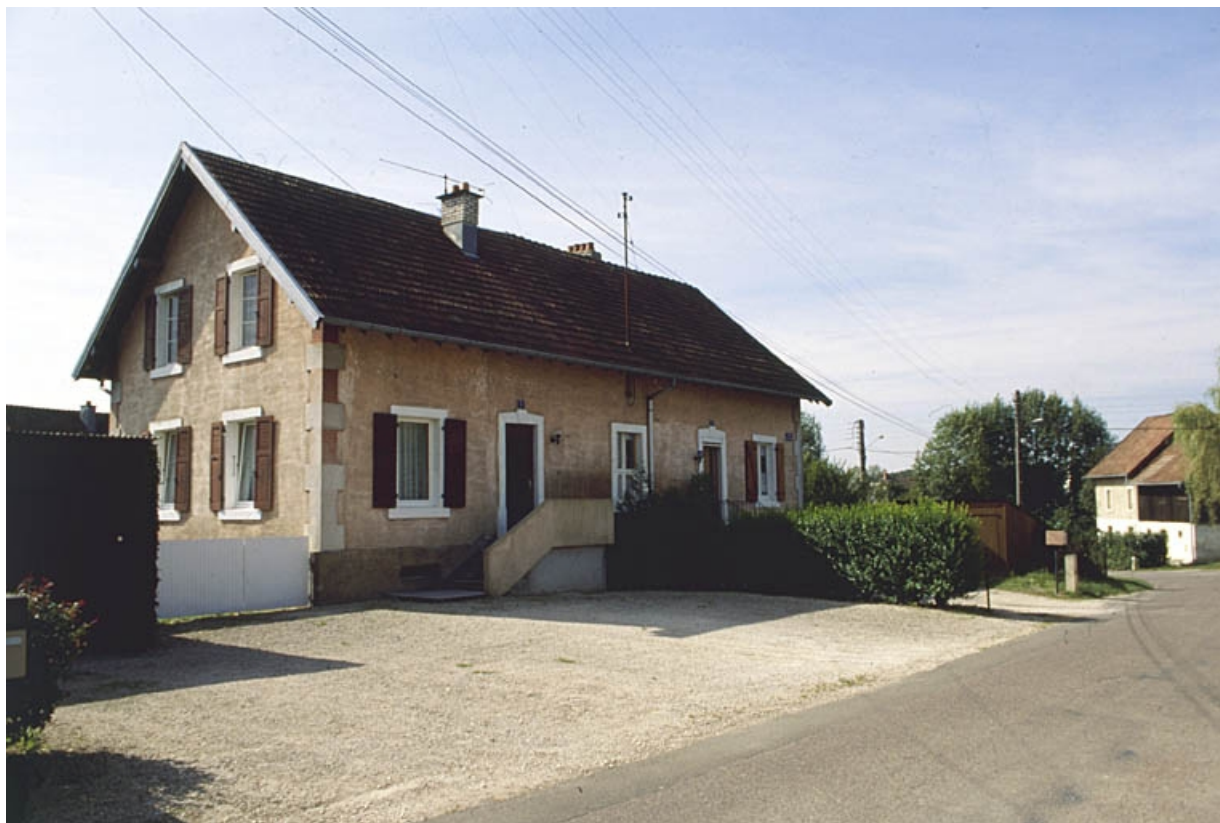
Maisons à deux logements (datée 1922) rue du Bois Lachat.

90, Grandvillars, lieudit : cité Bellevue