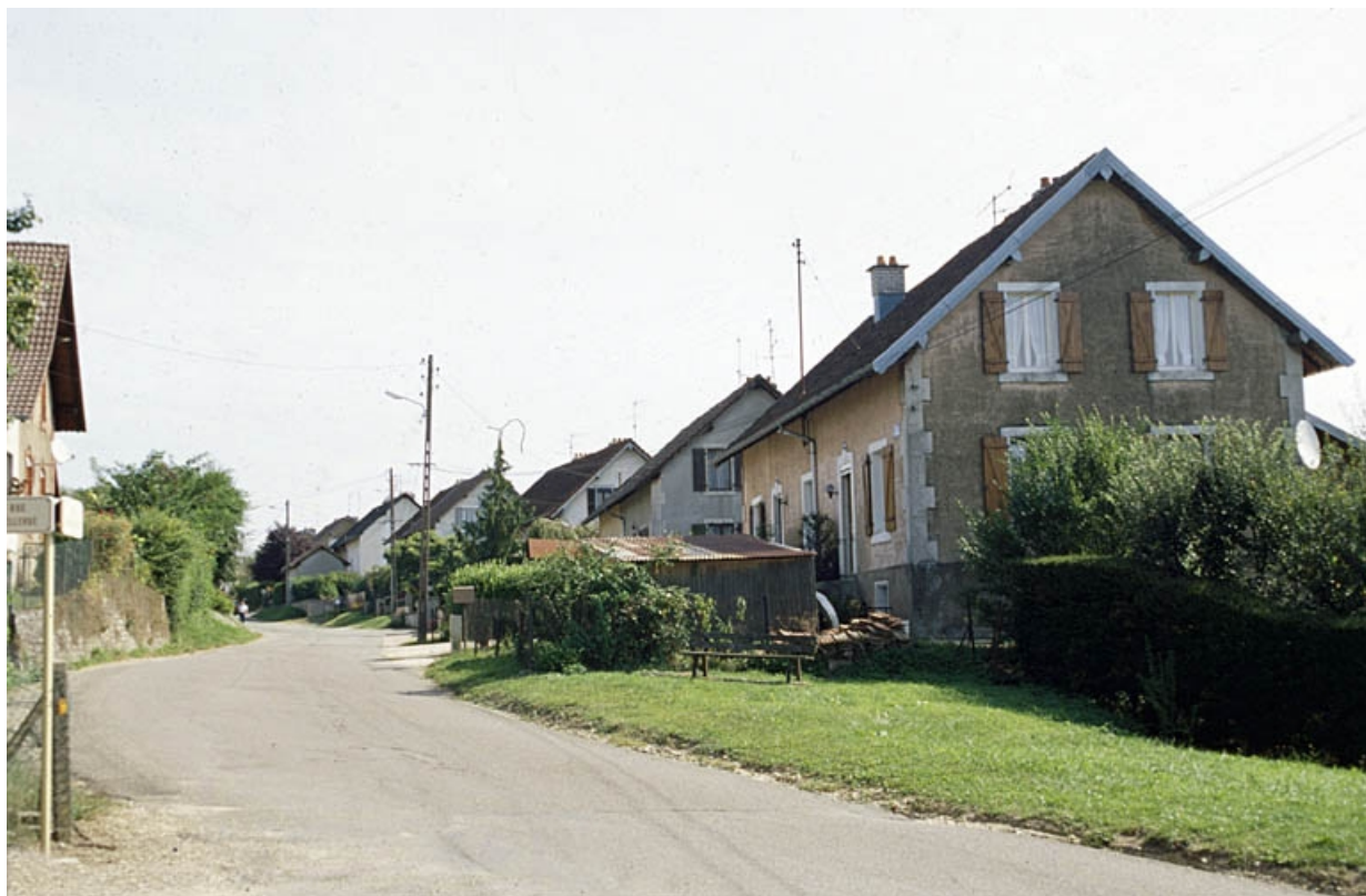
Logements ouvriers rue du Bois Lachat.

90, Grandvillars, lieudit : cité Bellevue