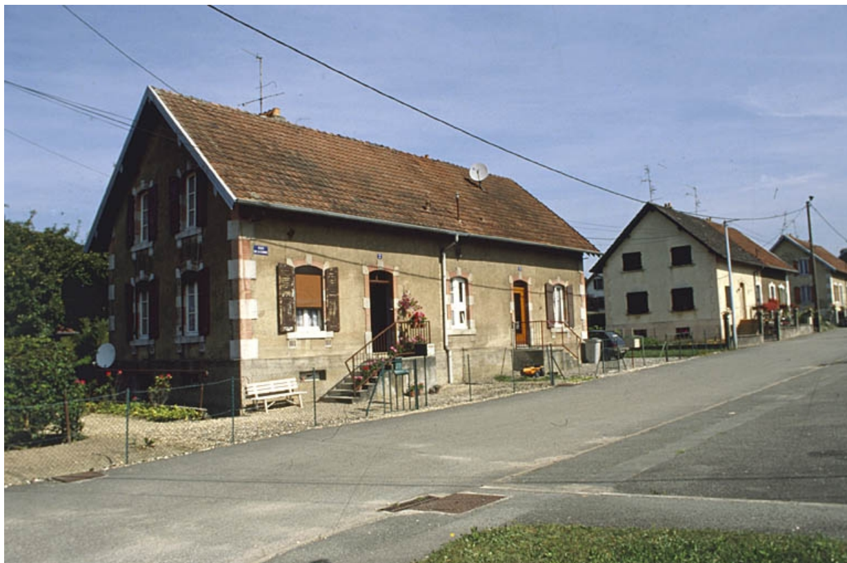
Maison à deux logements rue des Combes.

90, Grandvillars, lieudit : cité Bellevue