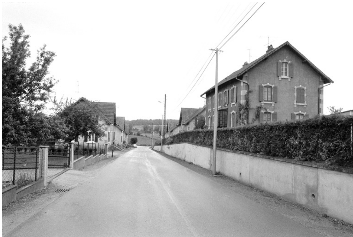
Rue Bellevue en 1980.

90, Grandvillars, lieudit : cité Bellevue