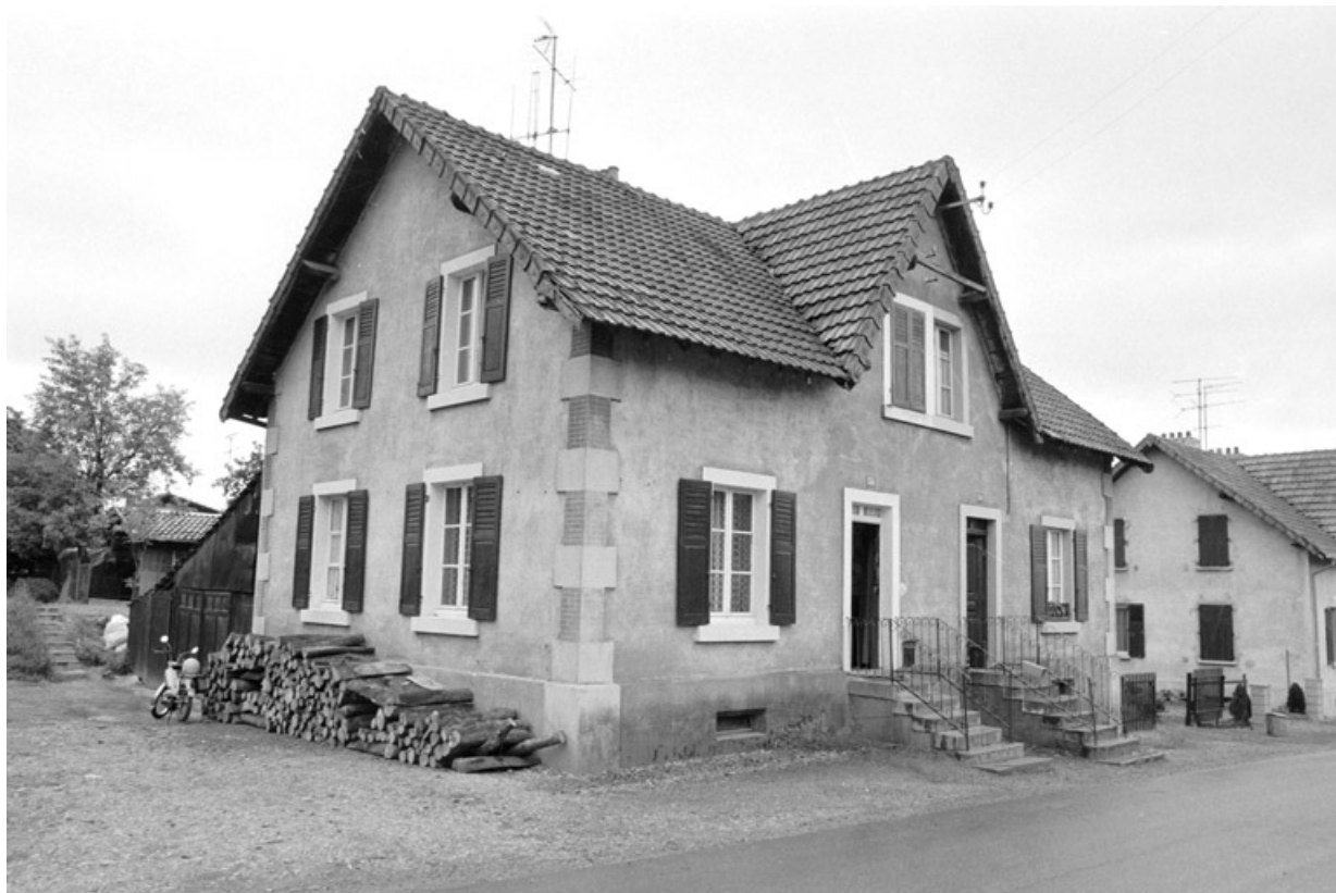
Maison à deux logements rue Bellevue en 1980.

90, Grandvillars, lieudit : cité Bellevue