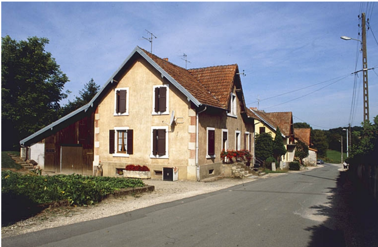
Maisons à deux logements rue Bellevue.

90, Grandvillars, lieudit : cité Bellevue