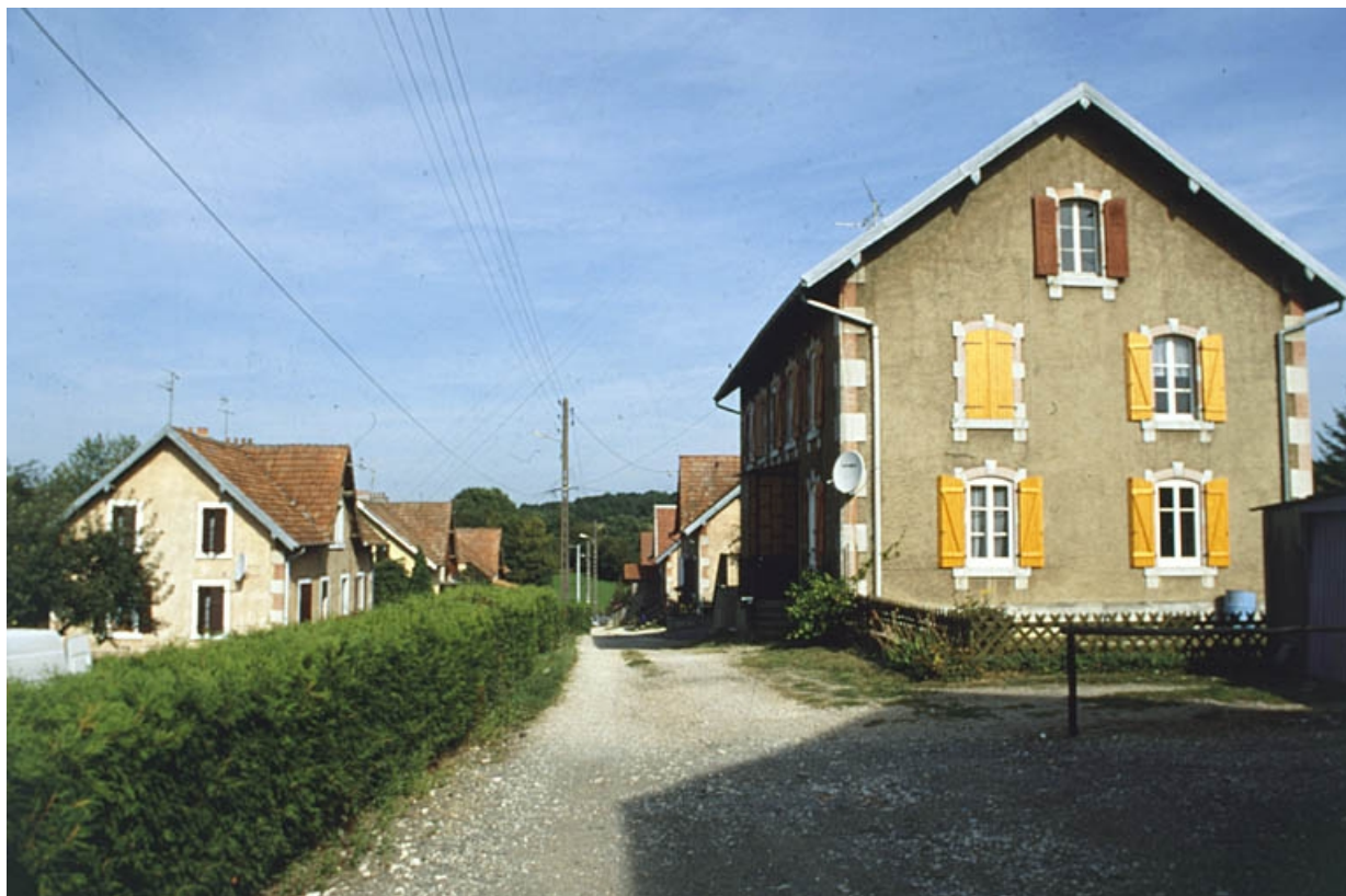
Vue d'ensemble de la rue Bellevue.

90, Grandvillars, lieudit : cité Bellevue