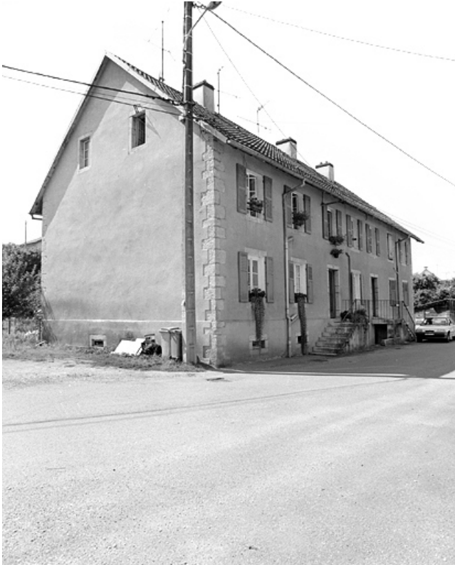
Logement ouvrier à 4 appartements et 2 entrées indépendantes. 90, Morvillars, 2 à 11 rue du Pâquis