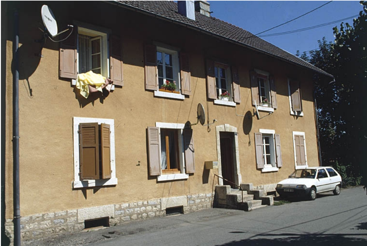
Façade antérieure d'un logement ouvrier à 4 appartements.