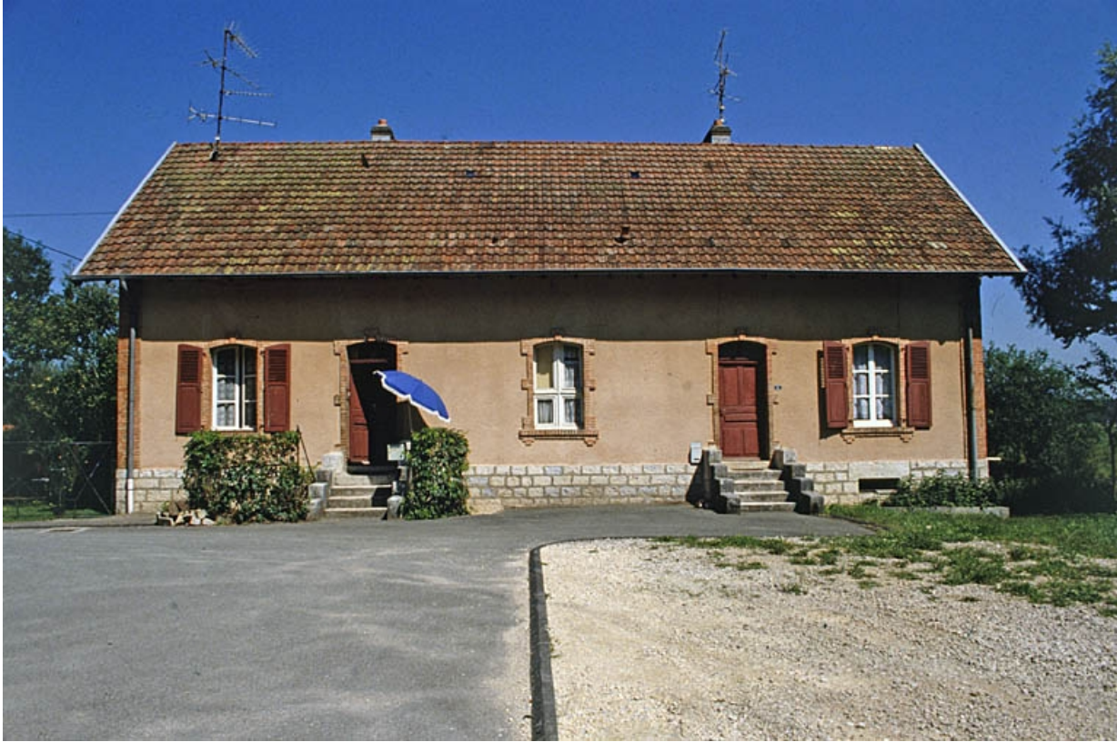
Façade antérieure d'un logement à 2 appartements.