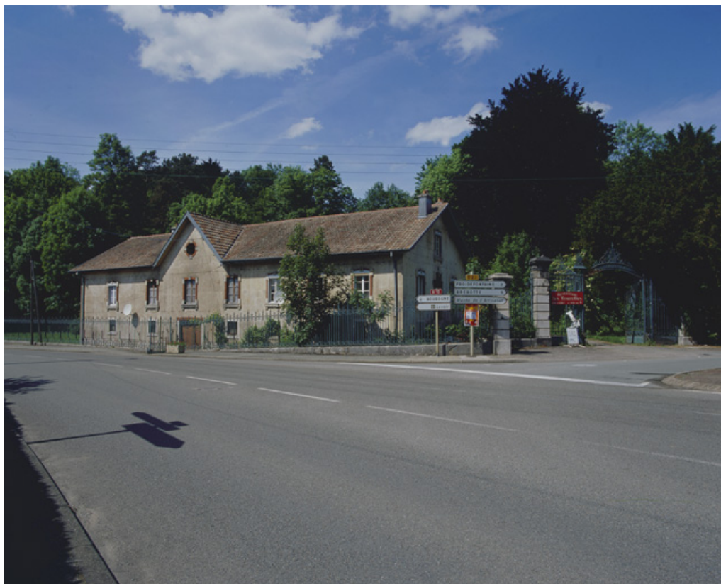
La conciergerie et l'entrée du parc.

90, Morvillars, lieudit : sur les Roches