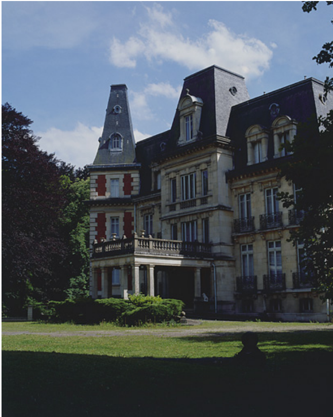
Façade nord vue de trois quarts.

90, Morvillars, lieudit : sur les Roches