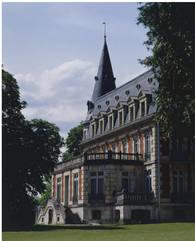
Façade sud vue de trois quarts.

90, Morvillars, lieudit : sur les Roches