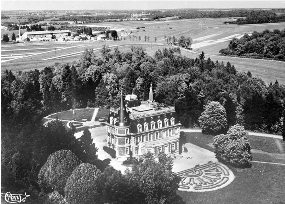
Morvillars (T.-de-B.) - Vue aérienne - Le Château de Fontaine et la Tuilerie.

90, Morvillars, lieudit : sur les Roches