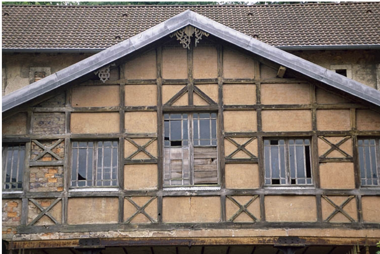
Détail du pignon de l'écurie.