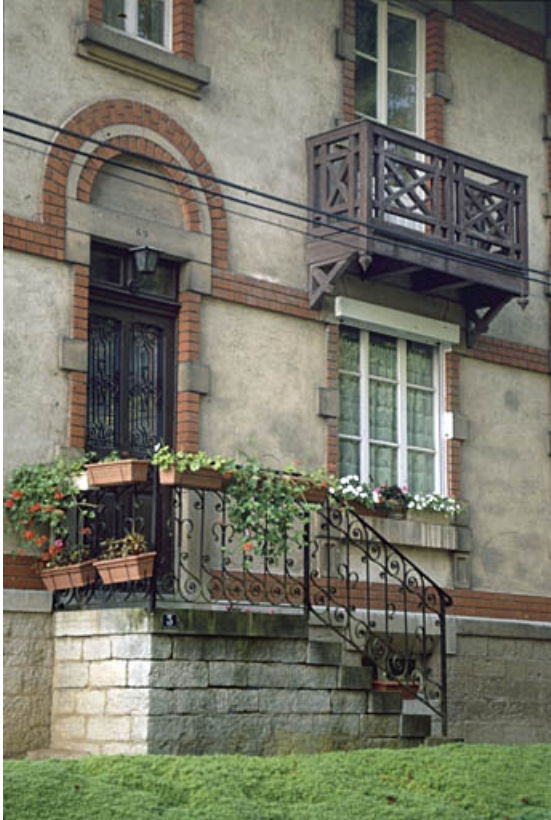
Logement (du personnel ?) rue des Forges.