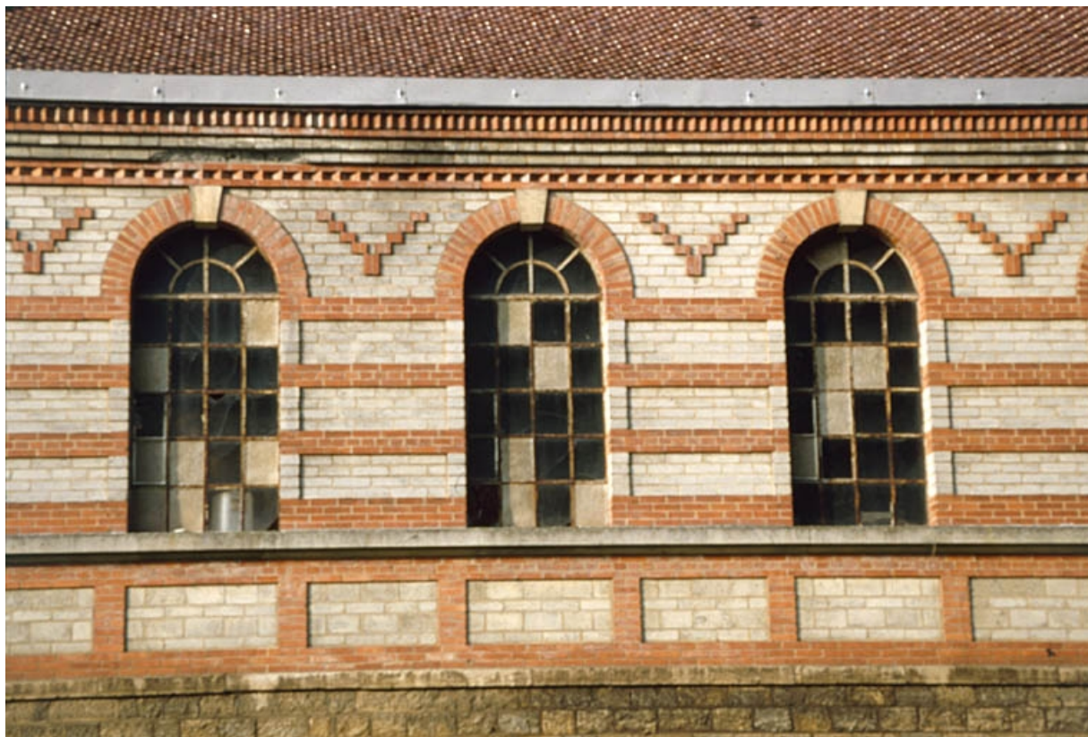
Détail de la façade est de l'orangerie.