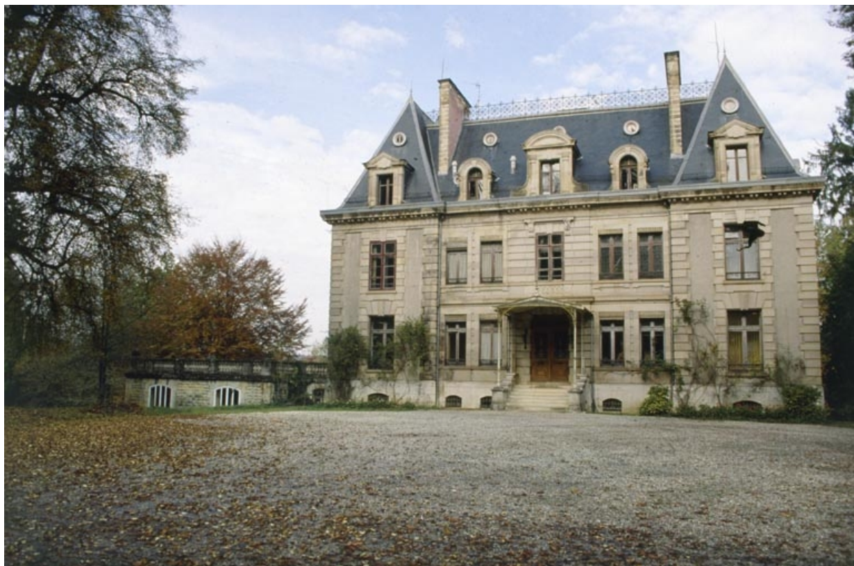
Façade antérieure depuis le sud.