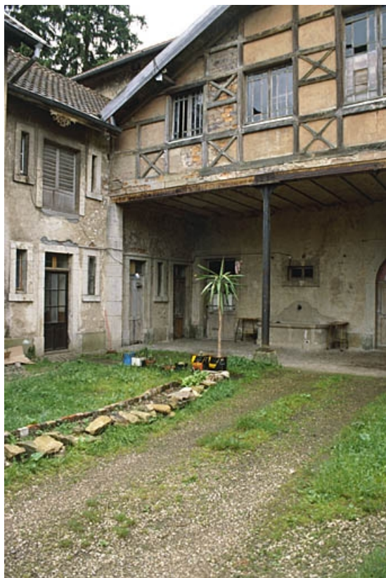
Logement et pignon de l'écurie.