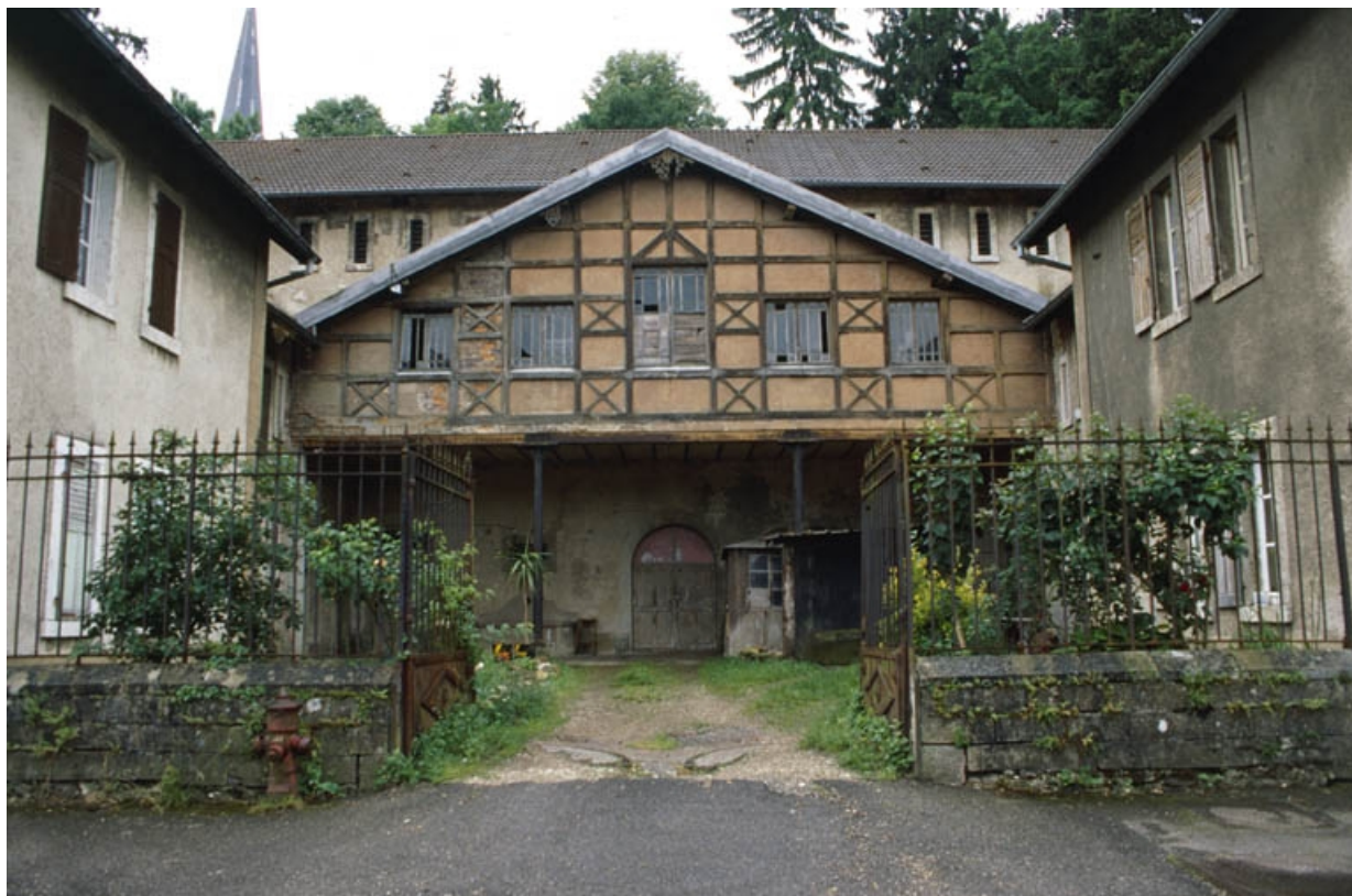
Façade nord de l'écurie.