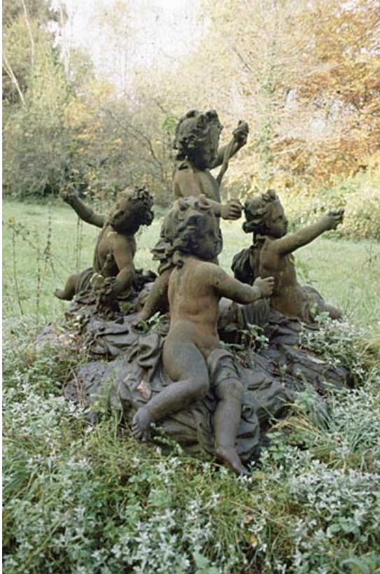
Groupe sculpté dans le parc.