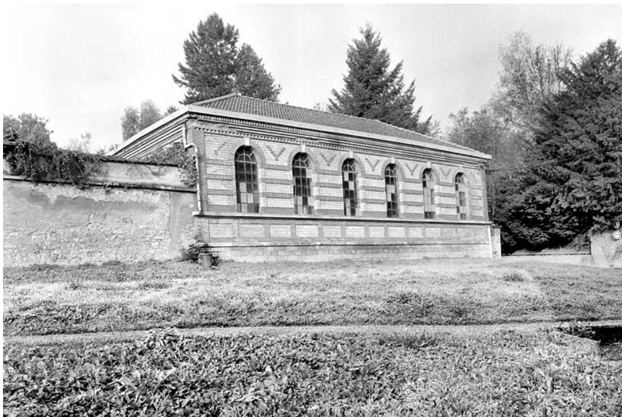
Vue d'ensemble de l'orangerie.