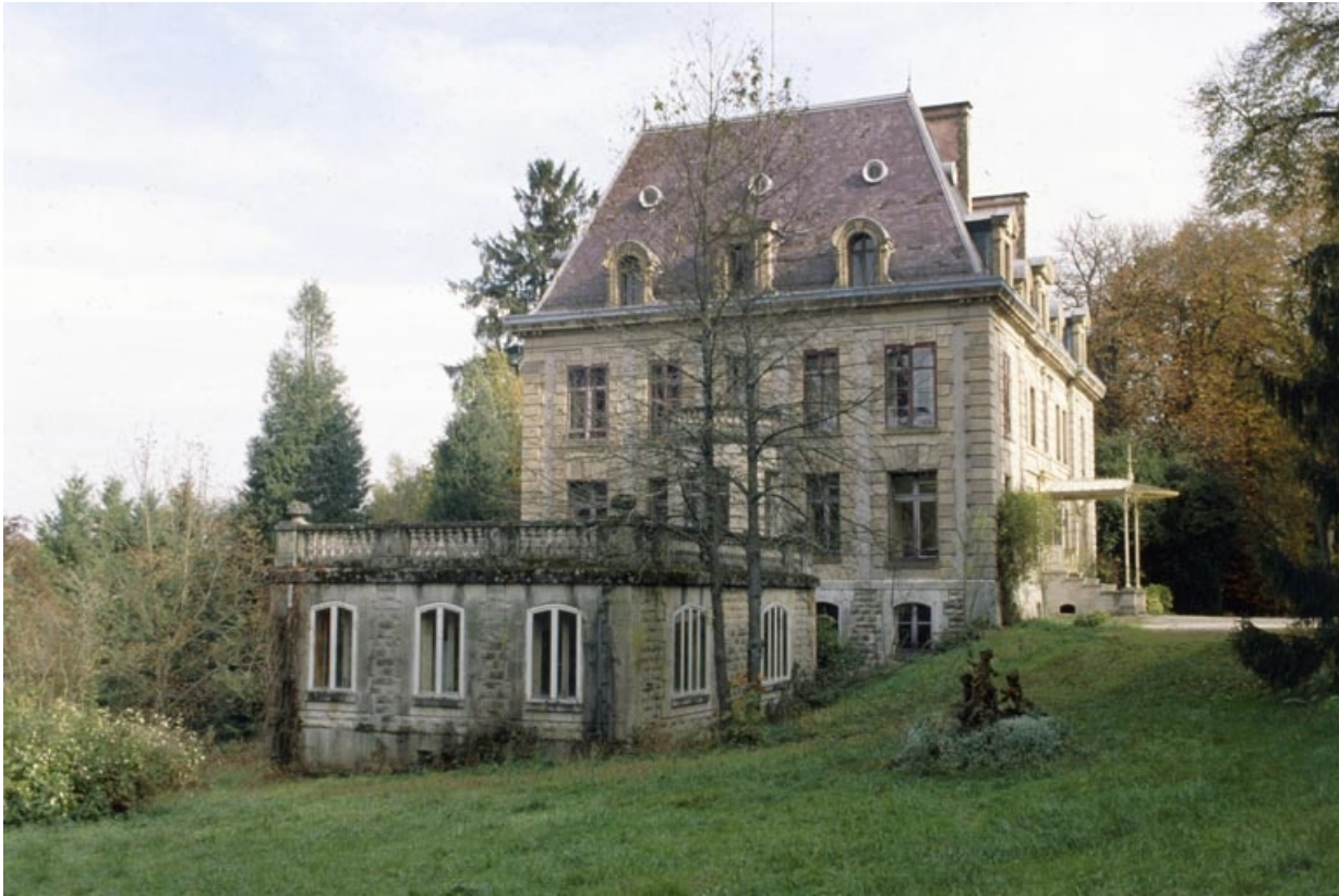
Vue depuis l'ouest.