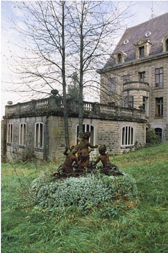
Extension de la demeure depuis le sud-ouest.