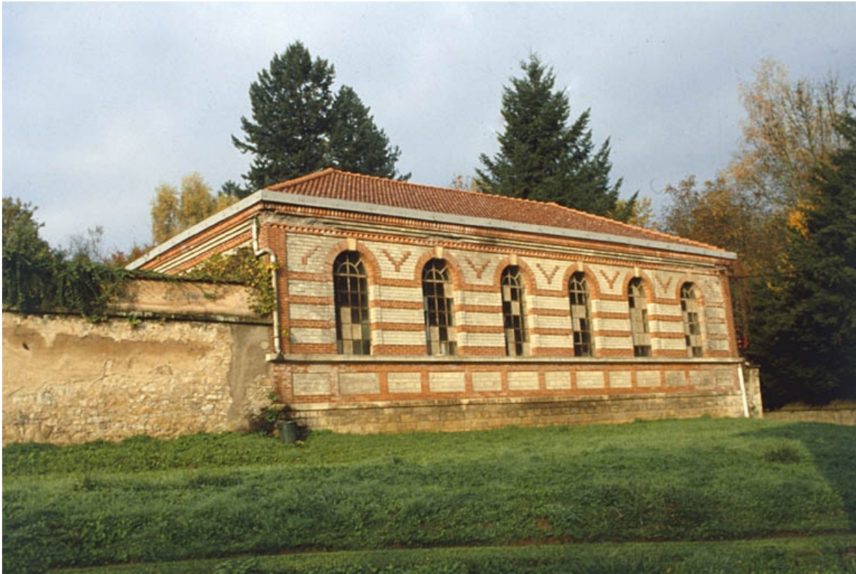
L'orangerie depuis l'est.