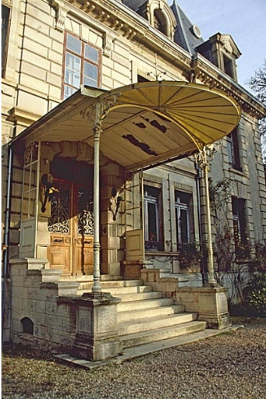
Le perron et la marquise.