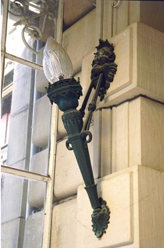
Façade antérieure : lampe d'applique.