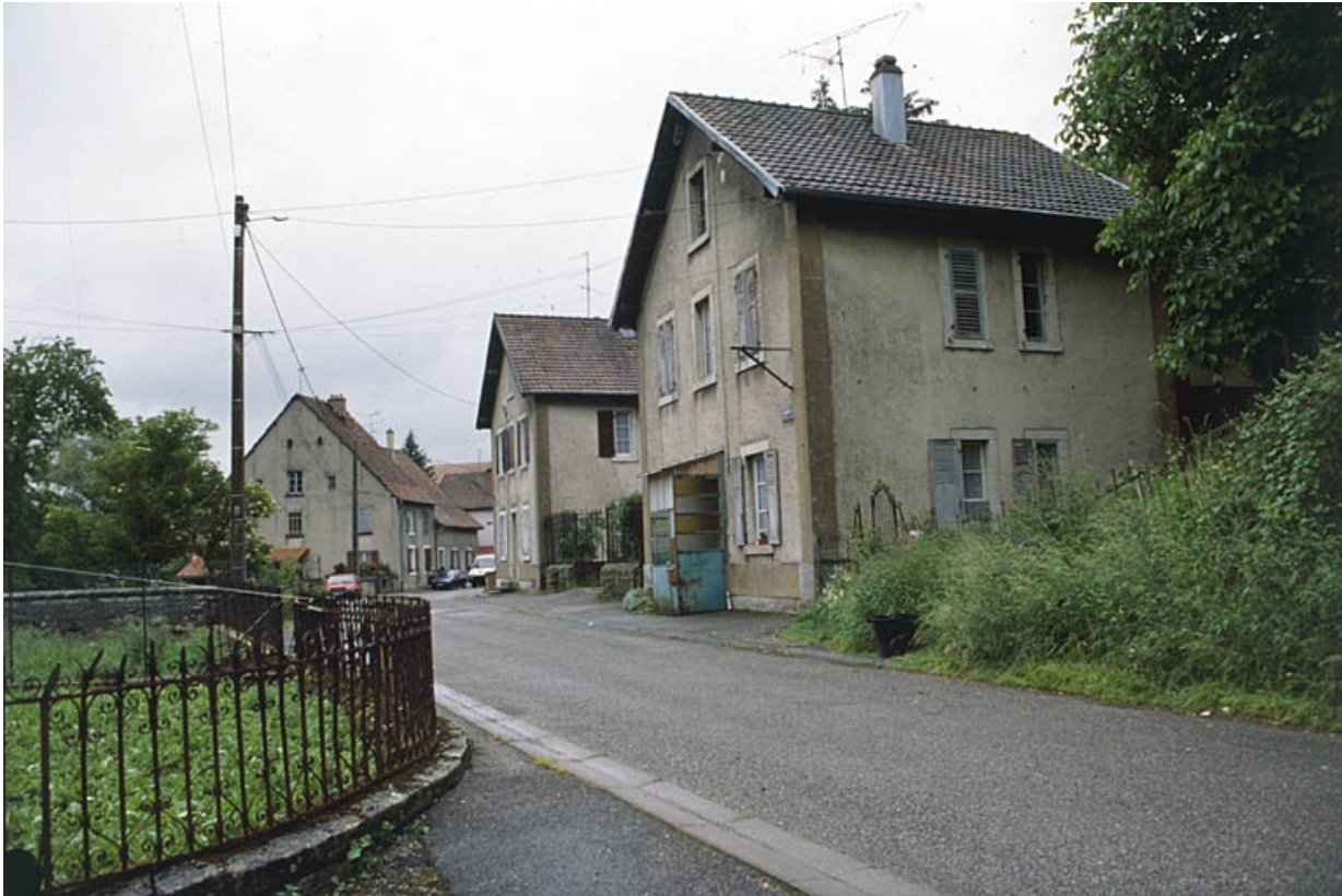
L'écurie depuis l'ouest.