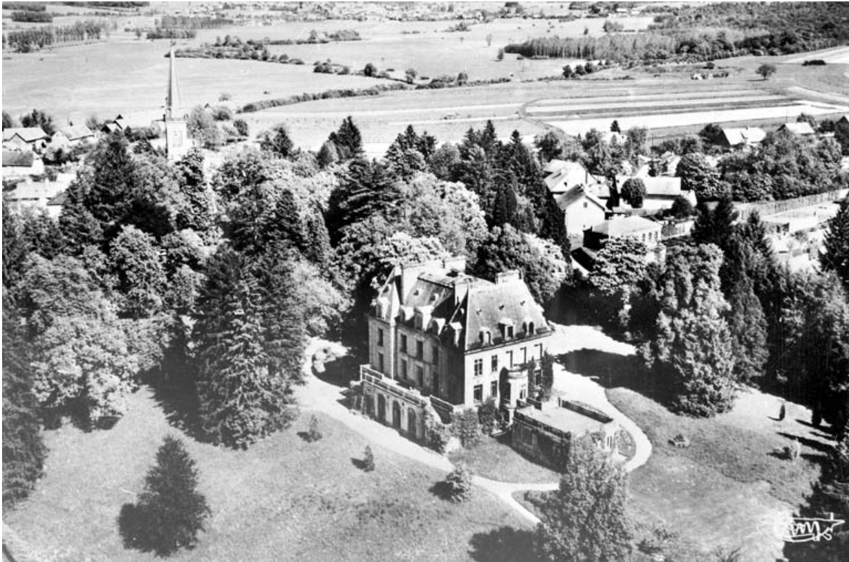
Morvillars (T.-de-B.) - Vue aérienne - Le Château.