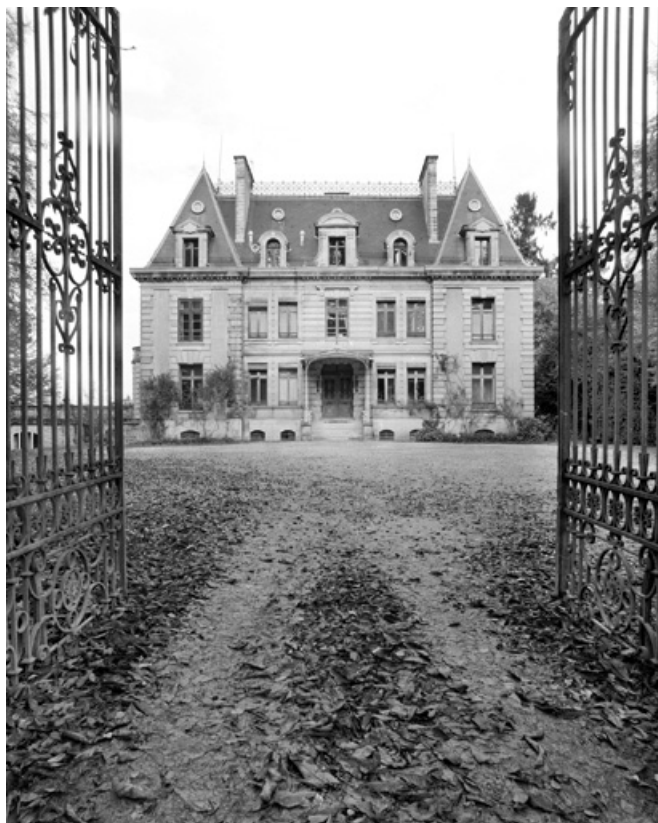
Façade antérieure depuis la grille.