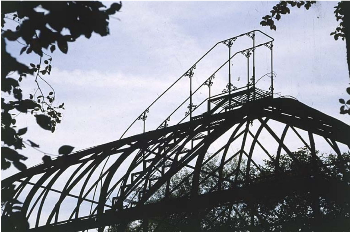
Détail de l'escalier d'accès au dôme de la serre. 90, Morvillars, 11 rue des Forges