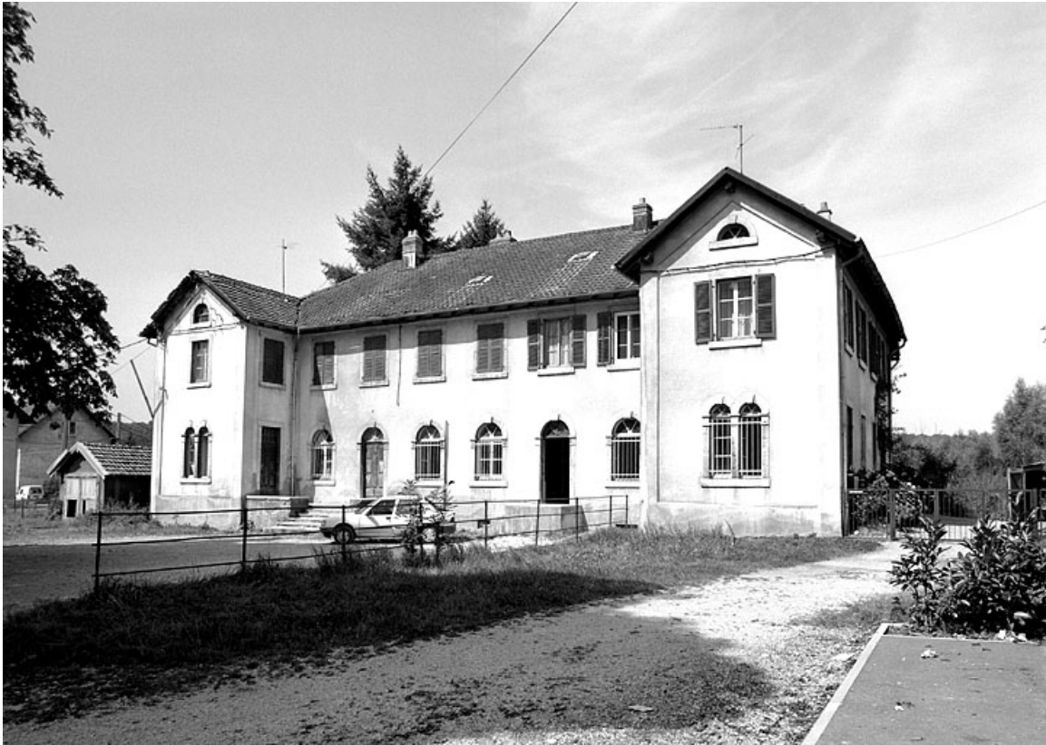
Vue de trois quarts droite.