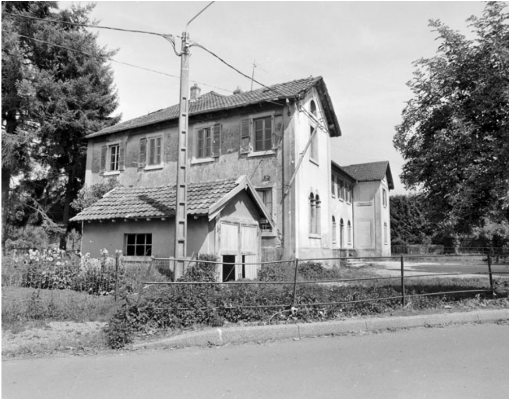
Elévation depuis l'ouest.