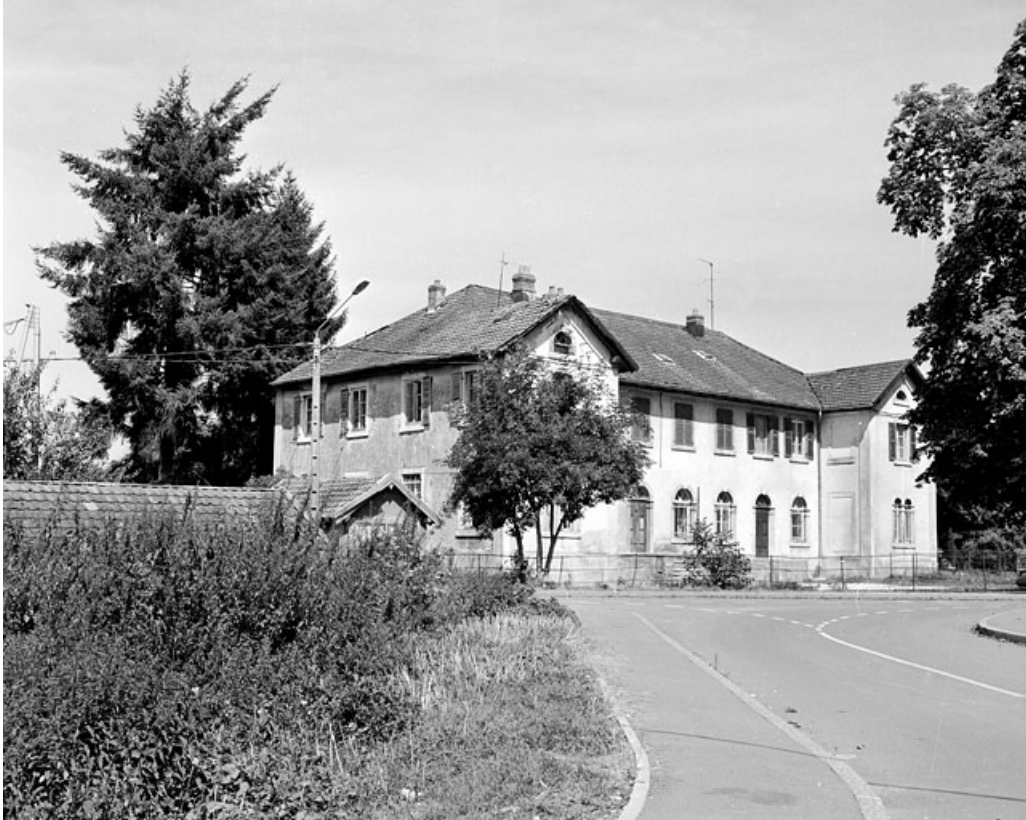
Vue de trois quarts gauche.