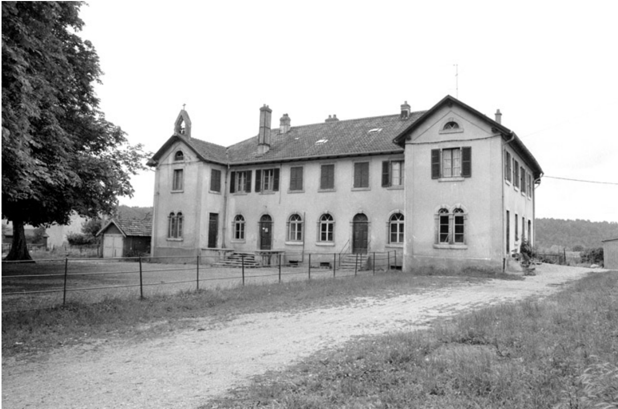
Vue d'ensemble en 1980.