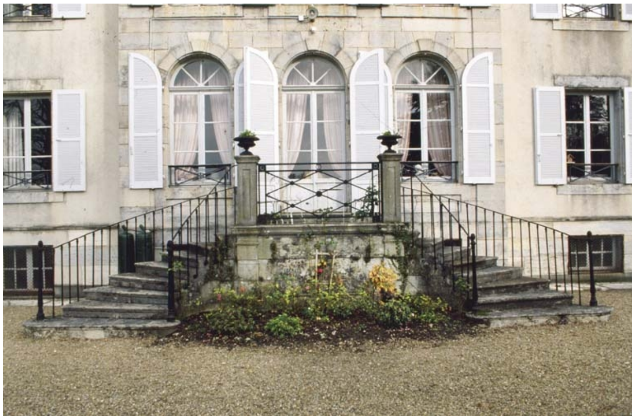
Détail de la façade ouest. 90, Méziré route de la Forge