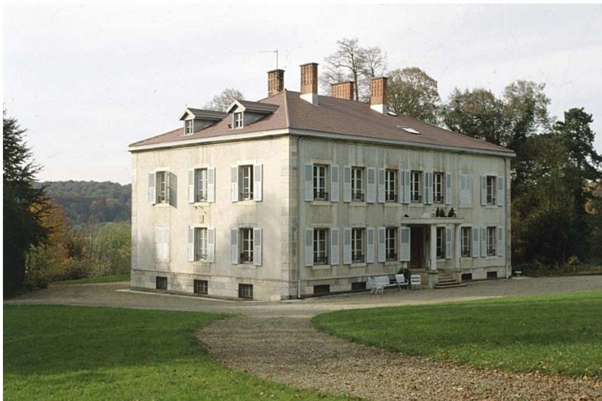
Vue de trois quarts arrière.