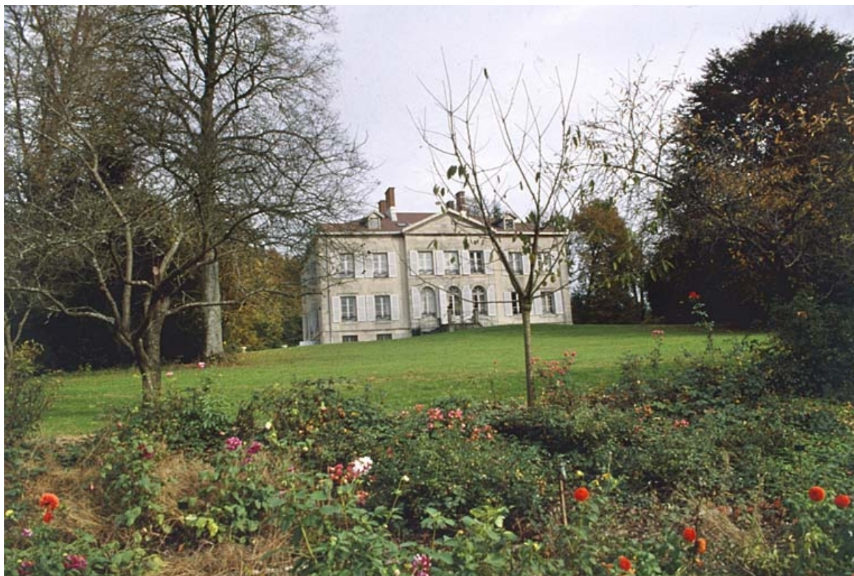
Vue d'ensemble depuis l'ouest.