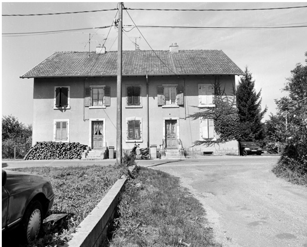
Logement ouvrier collectif (4 appartements).