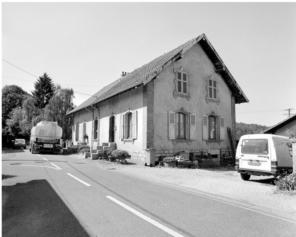
Maison à double logement, avec décor de baies en briques.