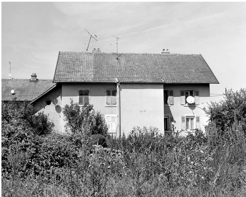
Façade postérieure d'un logement ouvrier collectif.