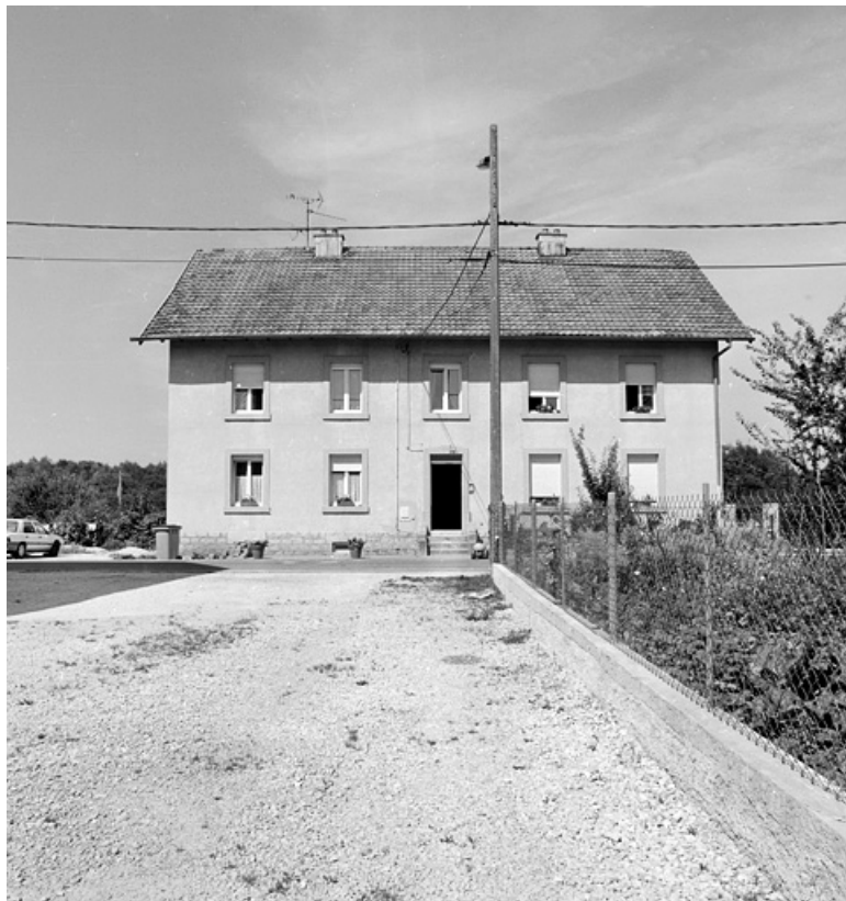
Vue d'ensemble d'un logement ouvrier collectif.