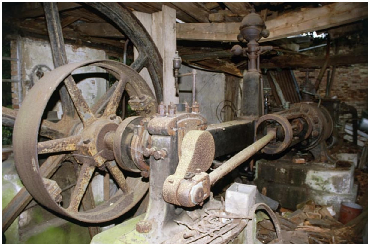
Vue d'ensemble de la machine à vapeur depuis le sud.