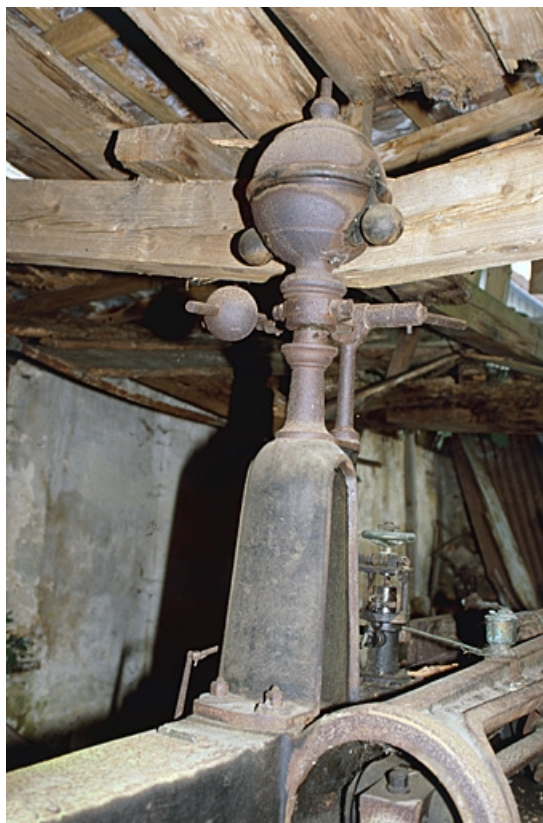
Machine à vapeur : détail du régulateur à boules. L'entrait de la charpente, brisé, repose sur le régulateur. 90, Suarce R.D. 13