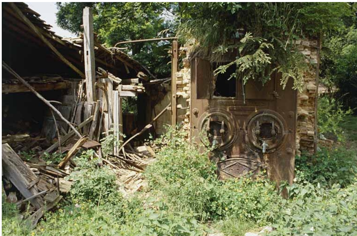
Façade de la chaudière de la machine à vapeur.