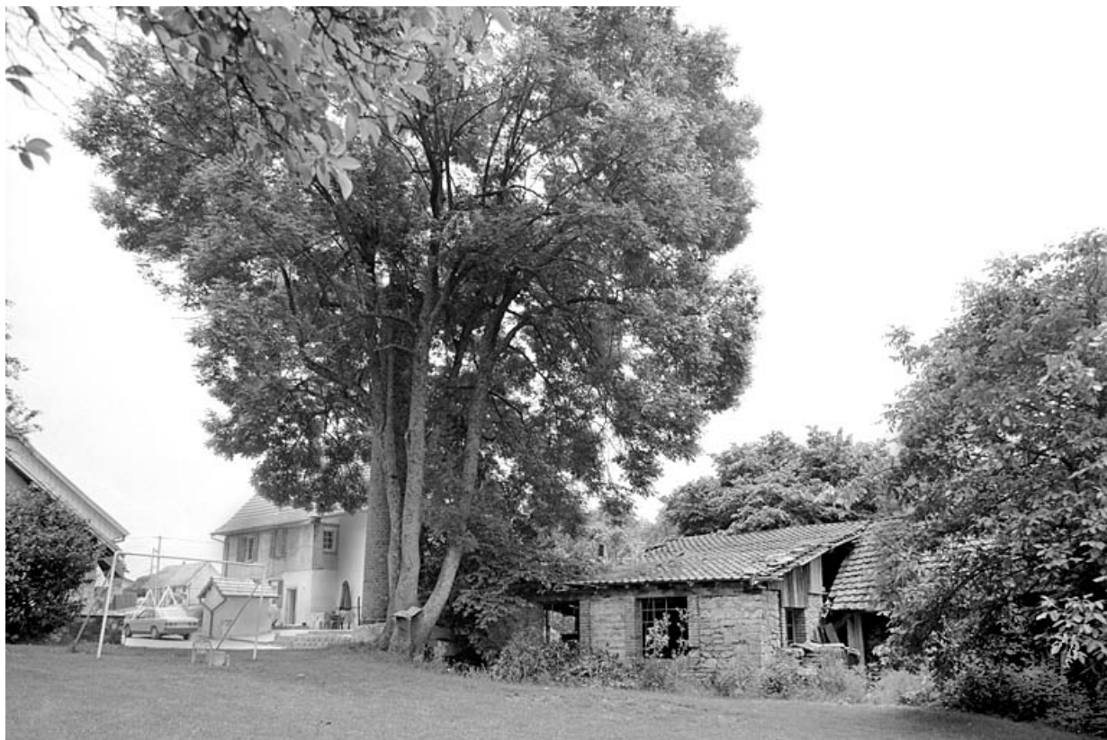
Logement patronal et salle des machines depuis l'ouest.