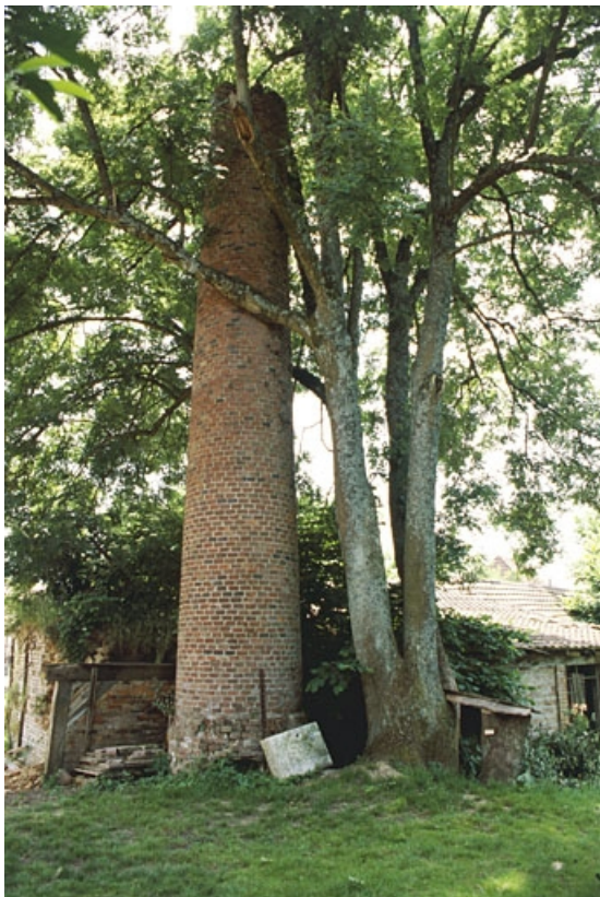
Cheminée et chaudière de la machine à vapeur depuis le nord.