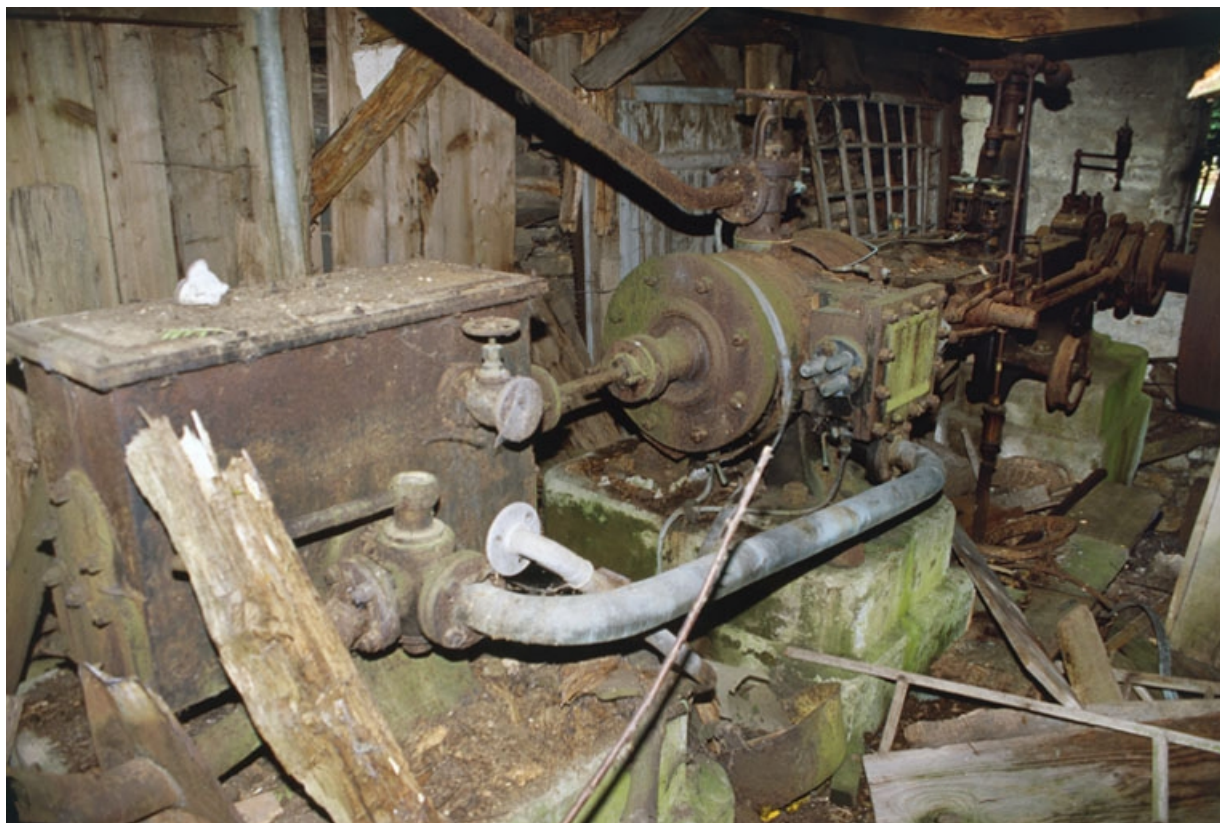
Vue d'ensemble de la machine à vapeur.