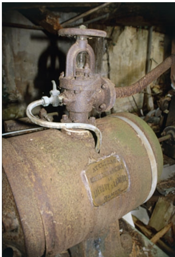
Machine à vapeur : le cylindre.