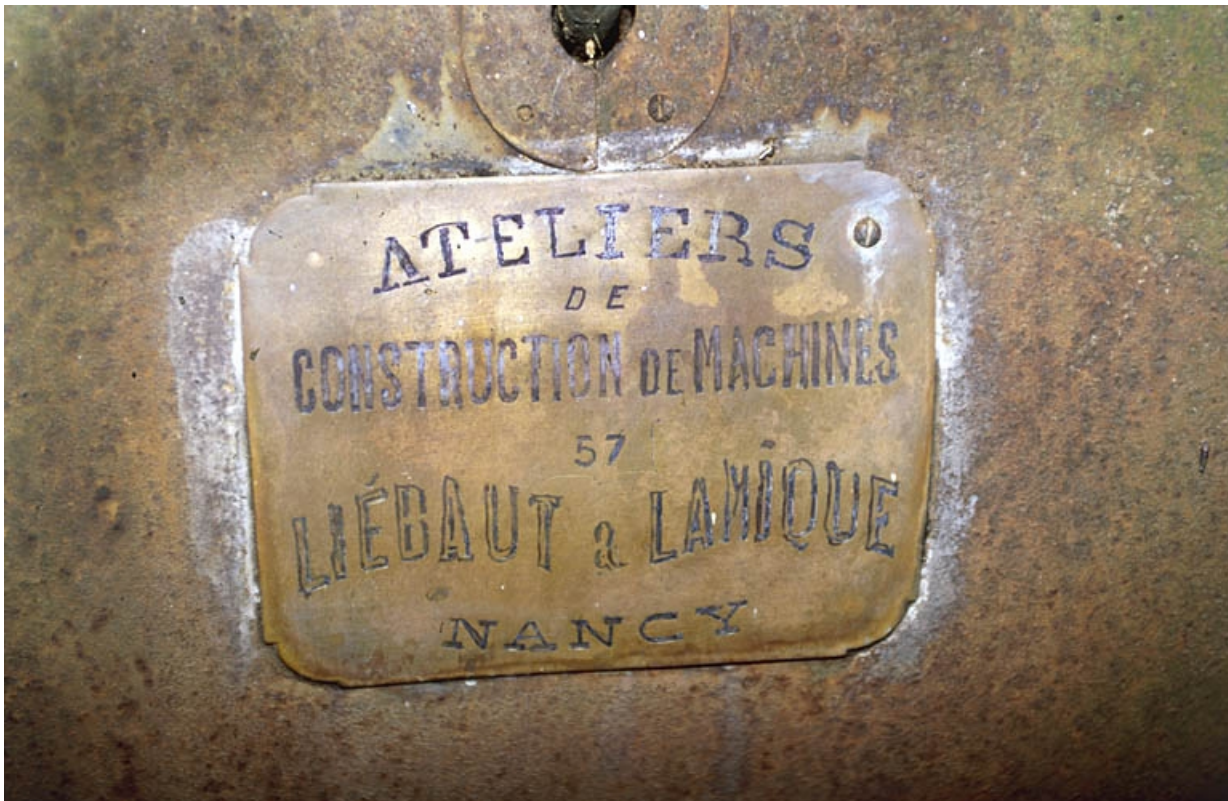
Plaque de constructeur de la machine à vapeur.