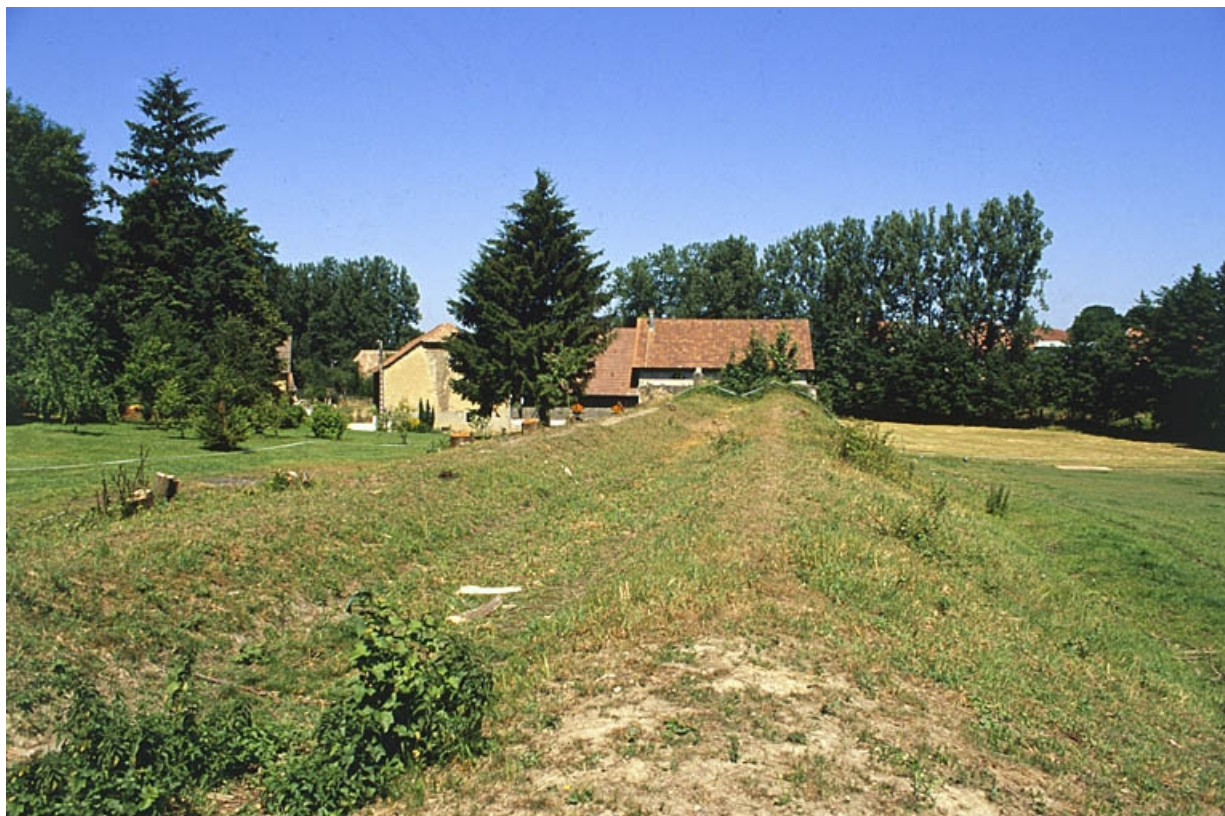
Le canal d'amenée du moulin (comblé).