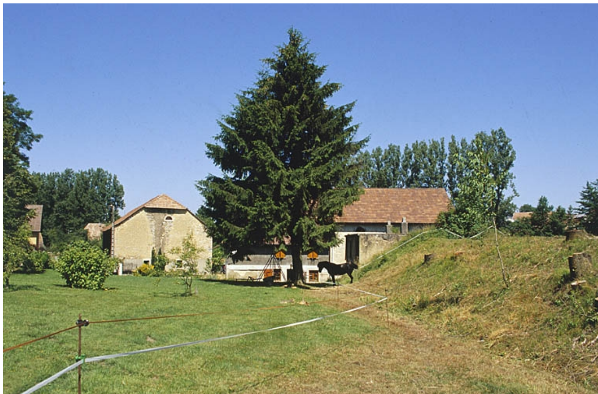
Façade postérieure du moulin et canal d'aménée.