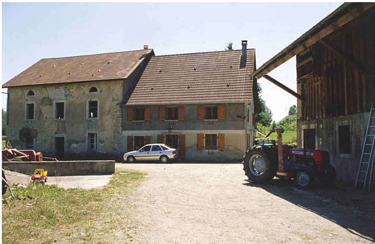
Façade antérieure du moulin et du logement.