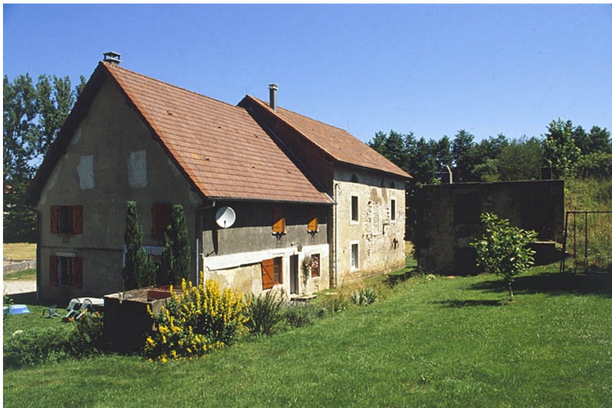
De gauche à droite : logement, moulin et chambre d'eau.