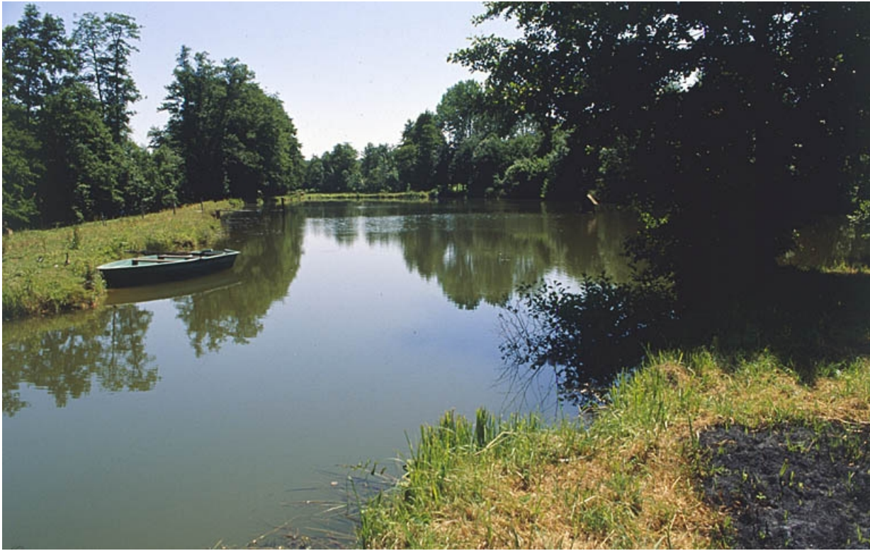
Etang et départ du canal d'amenée.