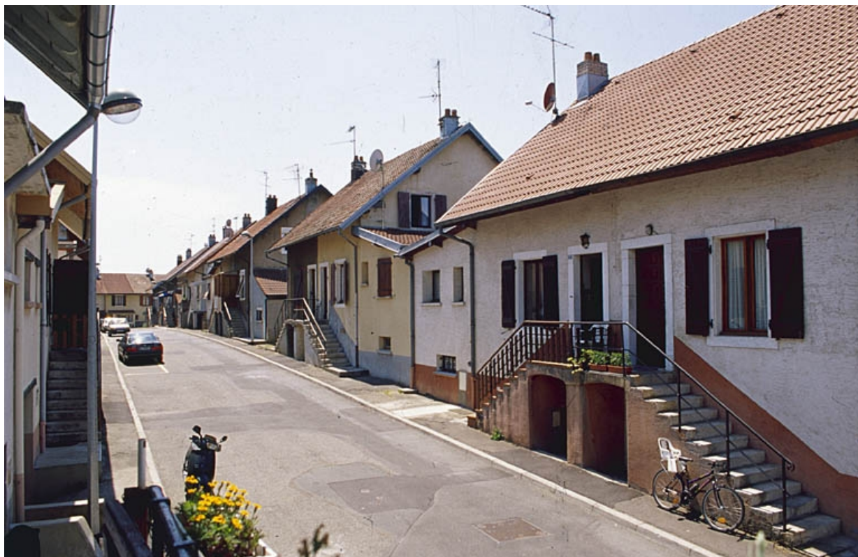
Logements ouvriers rue de la République. 90, Châtenois-les-Forges, 7 avenue des Forges