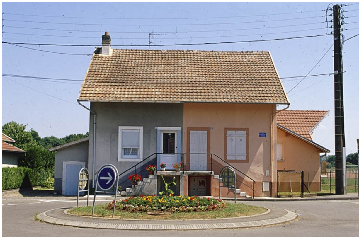
Façade sur rue d'un logement ouvrier double.

90, Châtenois-les-Forges, 7 avenue des Forges