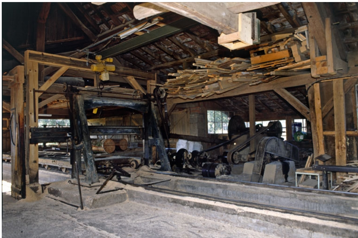
Intérieur de l'atelier de scierie.