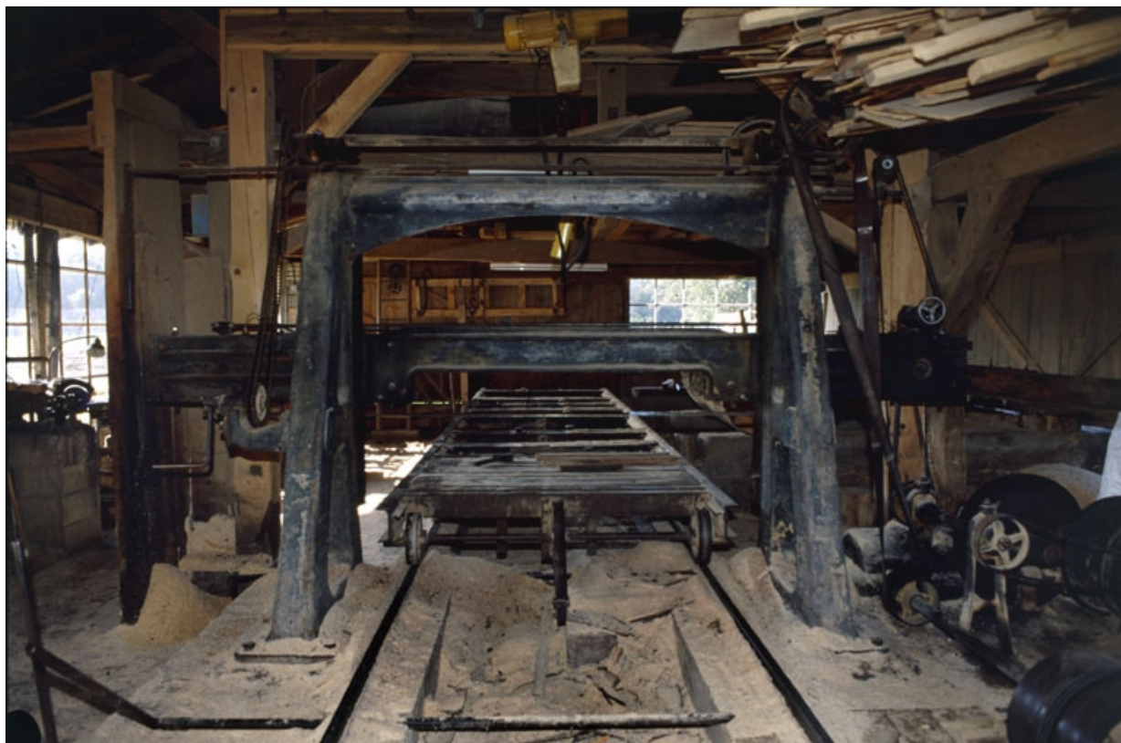
Châssis de scie et son chariot.