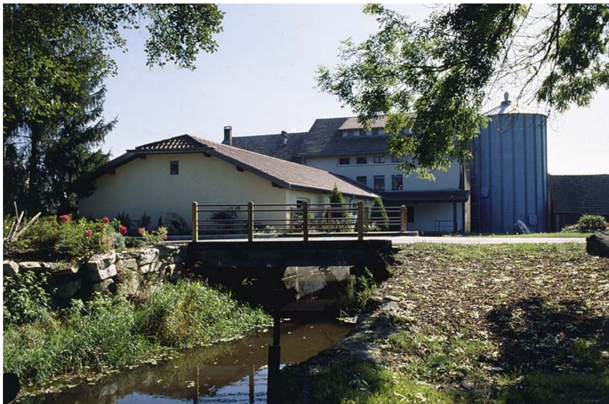
La minoterie depuis l'amont du canal du Moulin.