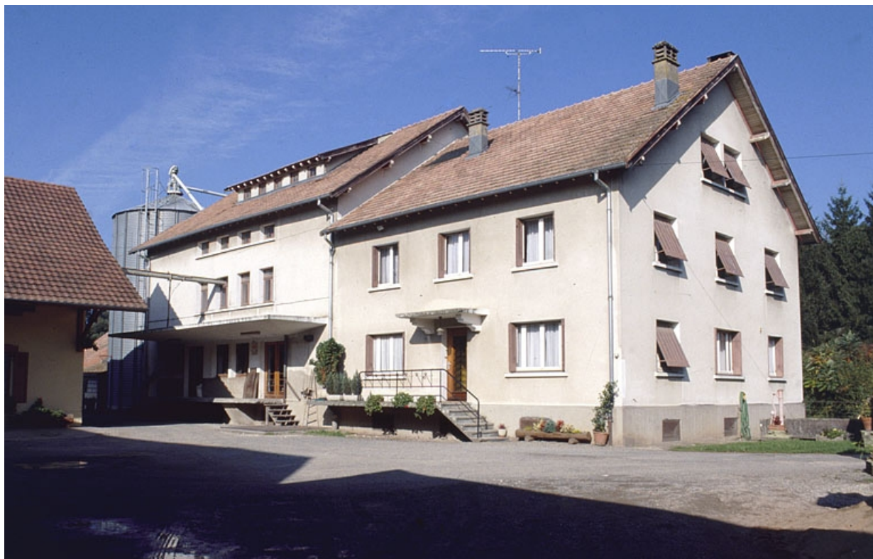
Atelier de fabrication (minoterie) et logement.