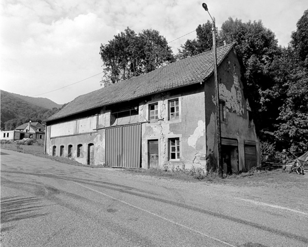
Bâtiment d'eau depuis le sud.