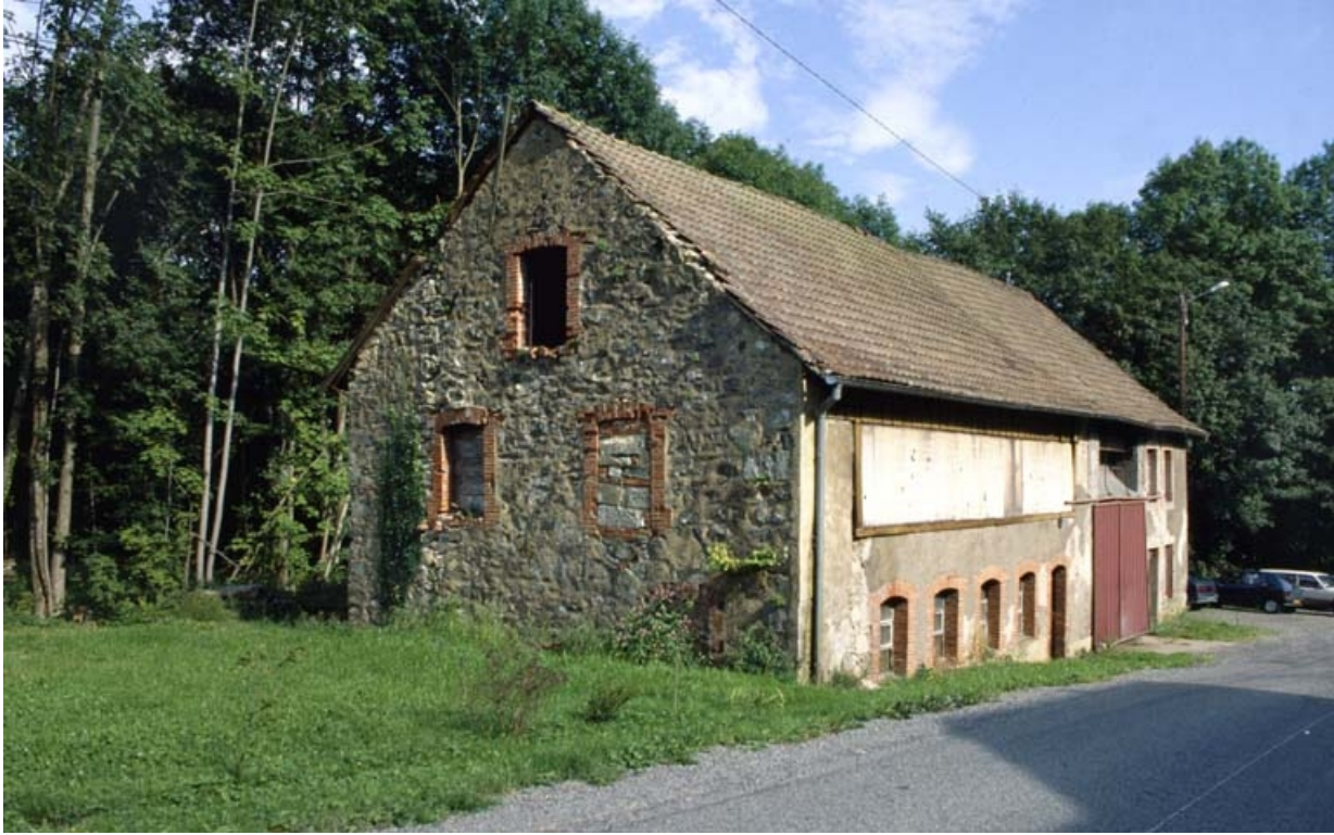
Bâtiment d'eau (ancien moulin).