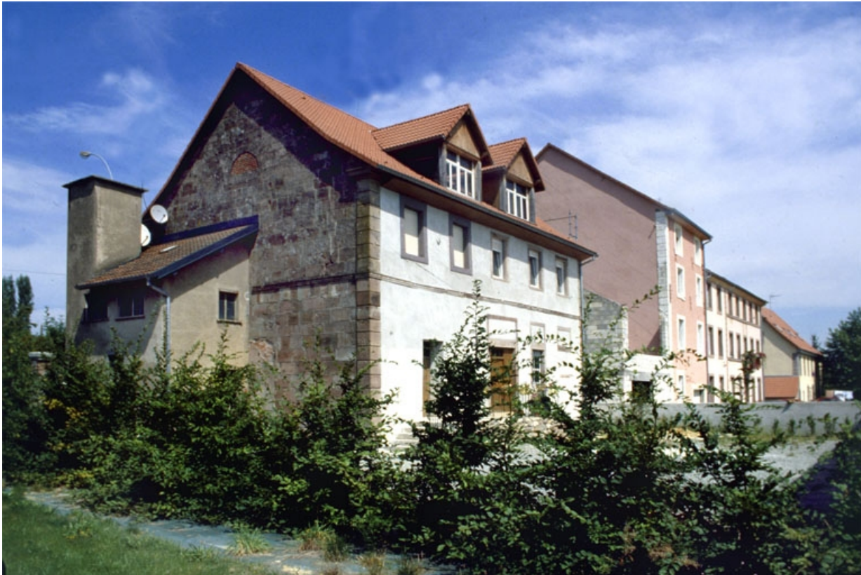
Façade postérieure des ateliers de fabrication.

90, Lachapelle-sous-Rougemont, 4, 6 rue du Général de Gaulle