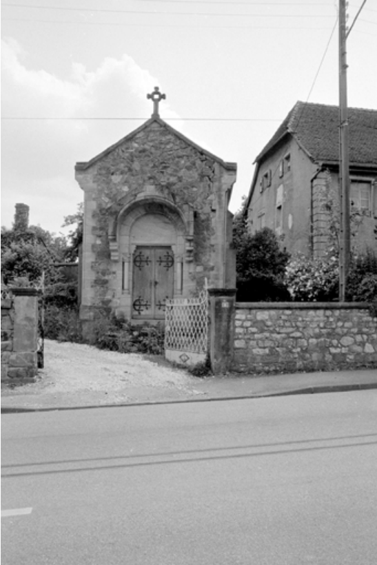
Chapelle en 1980. SRI. Enquête régionale sur les bâtiments industriels (1979-1981).

90, Lachapelle-sous-Rougemont, 4, 6 rue du Général de Gaulle