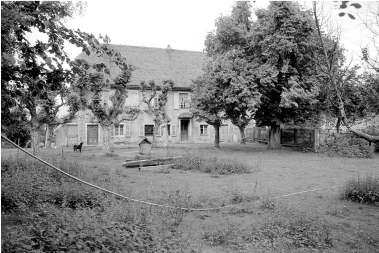
Logement patronal en 1980. SRI. Enquête régionale sur les bâtiments industriels (1979-1981). 90, Lachapelle-sous-Rougemont, 4, 6 rue du Général de Gaulle