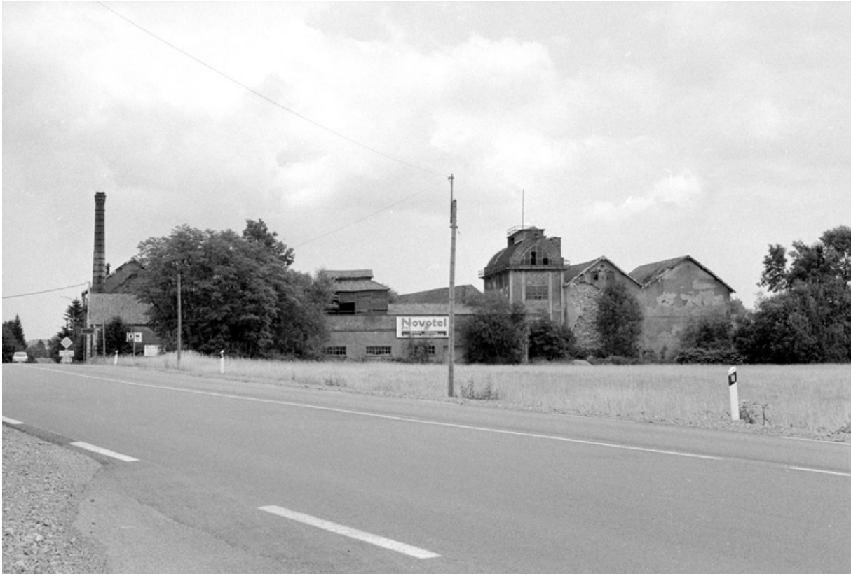
Vue d'ensemble en 1980. SRI. Enquête régionale sur les bâtiments industriels (1979-1981). 90, Lachapelle-sous-Rougemont, 4, 6 rue du Général de Gaulle