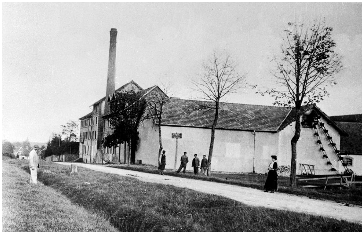
La brasserie depuis l'ouest.

90, Lachapelle-sous-Rougemont, 4, 6 rue du Général de Gaulle