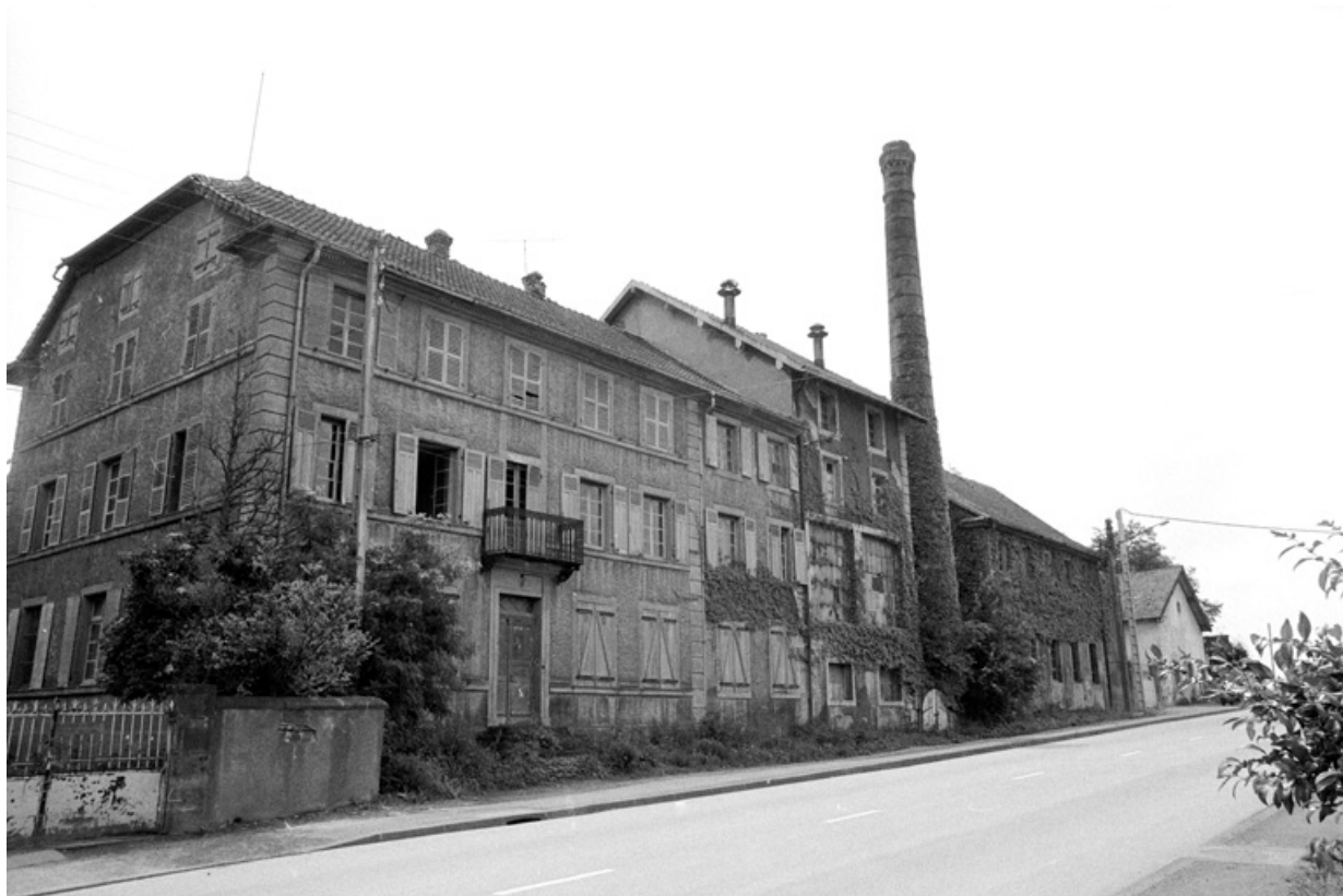
Façades sur rue en 1980. SRI. Enquête régionale sur les bâtiments industriels (1979-1981).

90, Lachapelle-sous-Rougemont, 4, 6 rue du Général de Gaulle