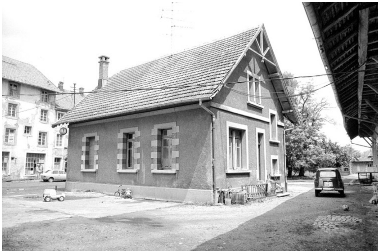
Bureaux en 1980. SRI. Enquête régionale sur les bâtiments industriels (1979-1981).

90, Lachapelle-sous-Rougemont, 4, 6 rue du Général de Gaulle