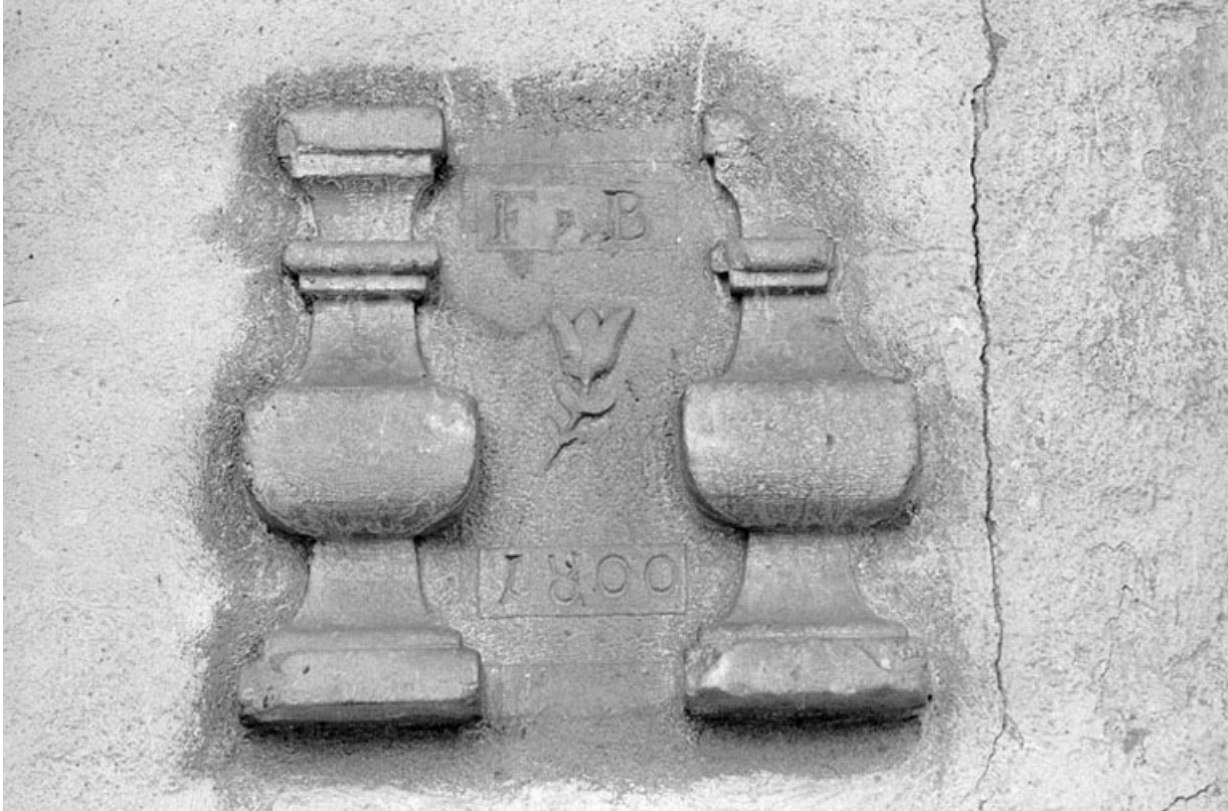
Pierre sculptée (remplacée) sur le bâtiment de nettoyage et d'embouteillage en 1980. SRI. Enquête régionale sur les bâtiments industriels (1979-1981).

90, Lachapelle-sous-Rougemont, 4, 6 rue du Général de Gaulle