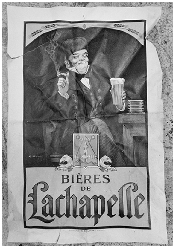
Affiche publicitaire. SRI. Enquête régionale sur les bâtiments industriels (1979-1981). 90, Lachapelle-sous-Rougemont, 4, 6 rue du Général de Gaulle