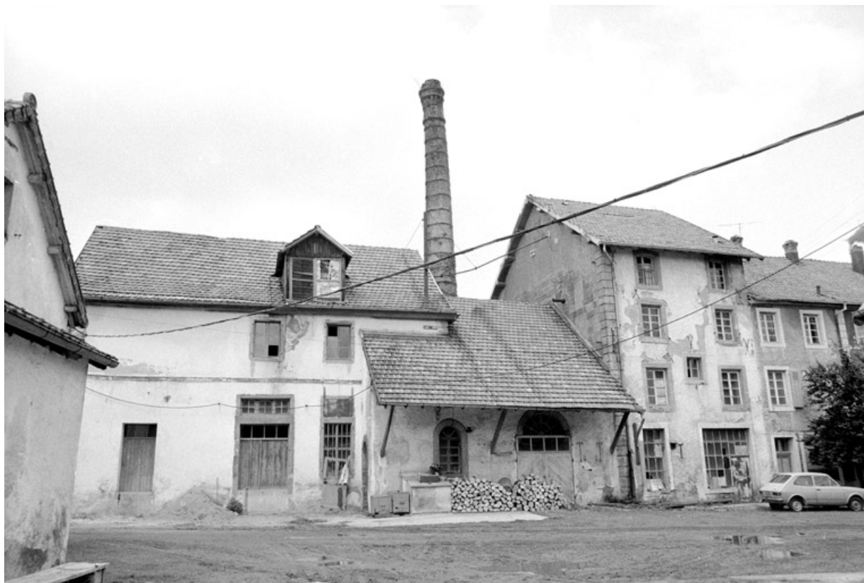
De gauche à droite : atelier de fabrication (eaux gazeuses), salle des machines et chaufferie, et salle de brassage en 1980. SRI. Enquête régionale sur les bâtiments industriels (1979-1981).

90, Lachapelle-sous-Rougemont, 4, 6 rue du Général de Gaulle