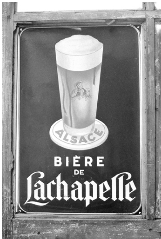
Plaque émaillée publicitaire. SRI. Enquête régionale sur les bâtiments industriels (1979-1981). 90, Lachapelle-sous-Rougemont, 4, 6 rue du Général de Gaulle