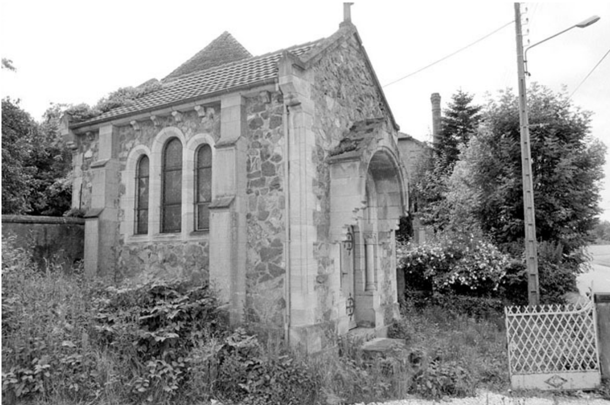
La chapelle vue de trois quarts en 1980. SRI. Enquête régionale sur les bâtiments industriels (1979-1981). 90, Lachapelle-sous-Rougemont, 4, 6 rue du Général de Gaulle