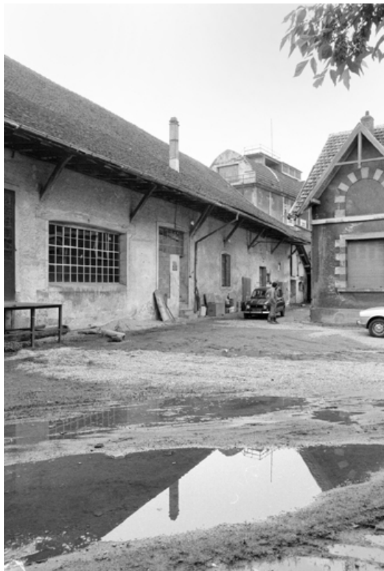
Façade sur cour de l'atelier de nettoyage et d'embouteillage en 1980. SRI. Enquête régionale sur les bâtiments industriels (1979-1981).

90, Lachapelle-sous-Rougemont, 4, 6 rue du Général de Gaulle