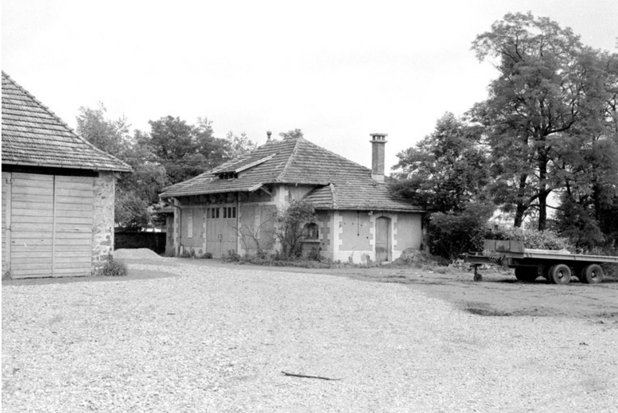
Garage en 1980. SRI. Enquête régionale sur les bâtiments industriels (1979-1981).

90, Lachapelle-sous-Rougemont, 4, 6 rue du Général de Gaulle