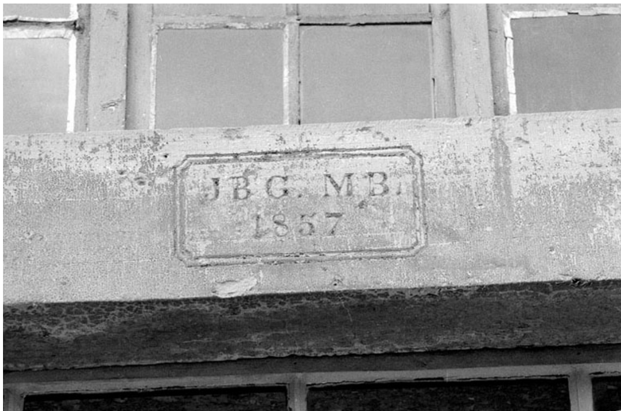
Cartouche gravé sur un linteau de porte de l'atelier de fabrication (eaux gazeuses). SRI. Enquête régionale sur les bâtiments industriels (1979-1981).

90, Lachapelle-sous-Rougemont, 4, 6 rue du Général de Gaulle