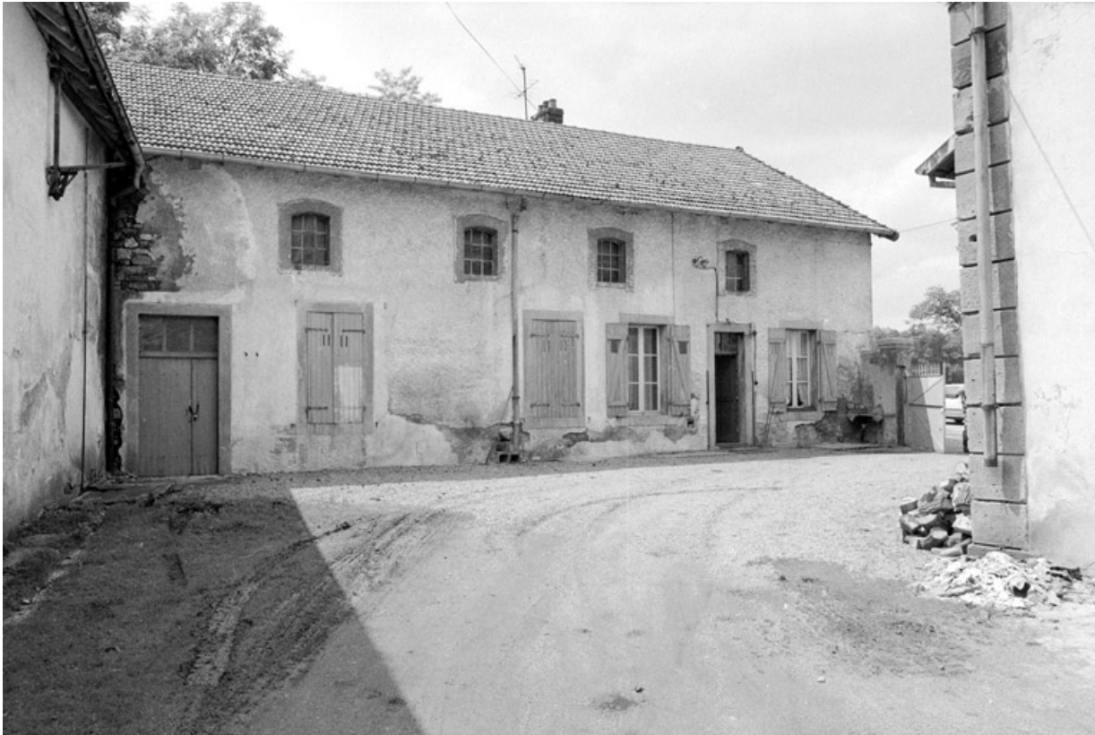
La conciergerie en 1980. SRI. Enquête régionale sur les bâtiments industriels (1979-1981). 90, Lachapelle-sous-Rougemont, 4, 6 rue du Général de Gaulle