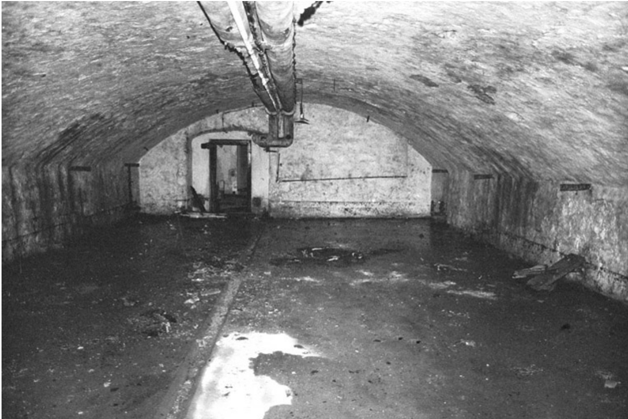
Cave en 1980. SRI. Enquête régionale sur les bâtiments industriels (1979-1981). 90, Lachapelle-sous-Rougemont, 4, 6 rue du Général de Gaulle