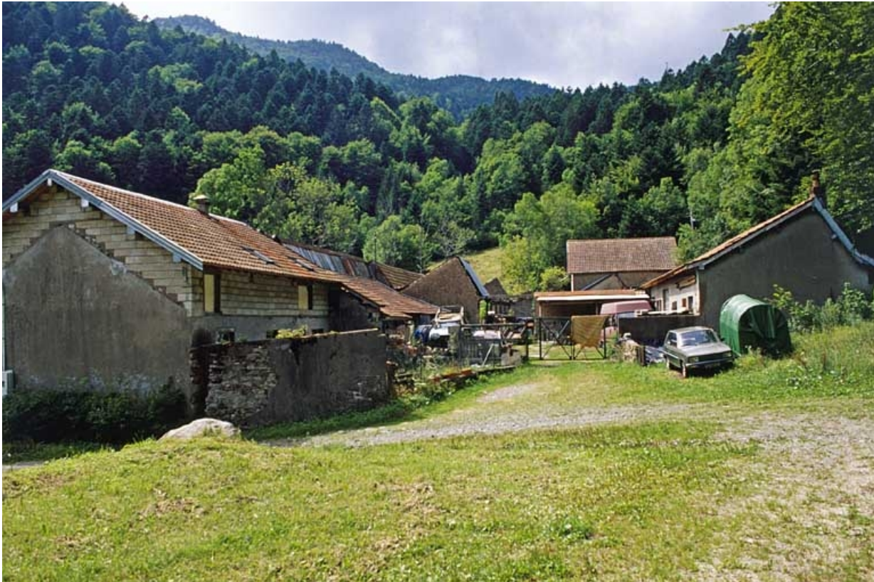
Vue d'ensemble depuis l'est.