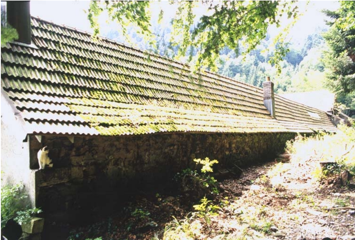
Versant nord (brisé) d'un shed.