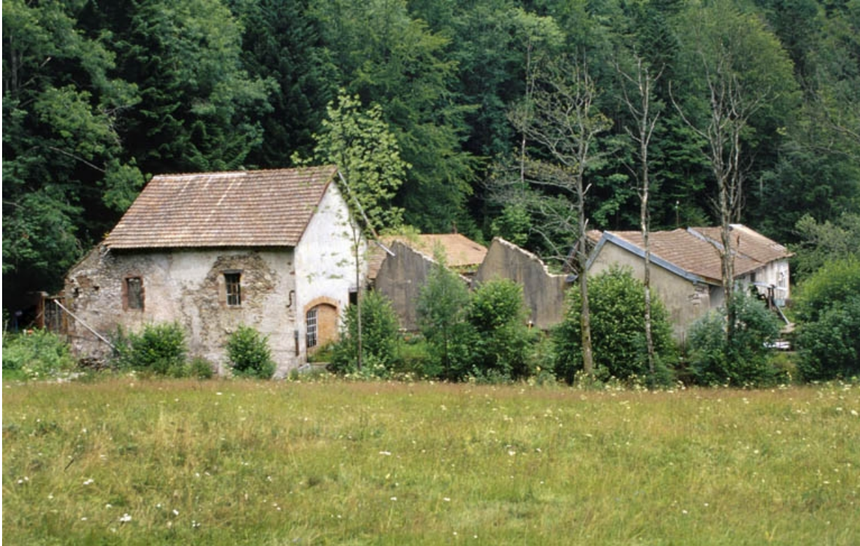
Vue d'ensemble depuis l'ouest.