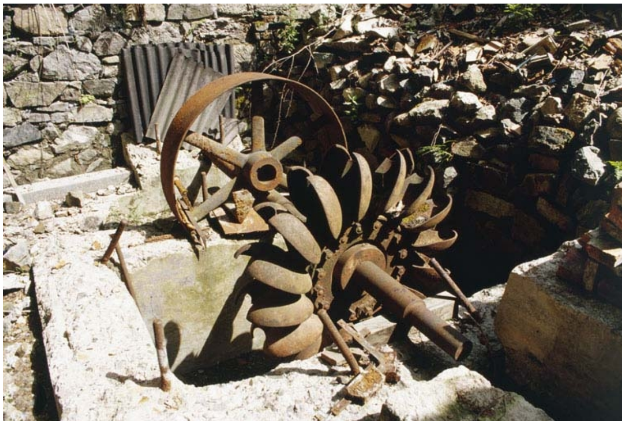
Turbine Pelton et volant de transmission. La turbine a vraisemblablement été apportée après la fermeture du tissage, peut-être dans l'intention de fournir de l'électricité à la pisciculture.