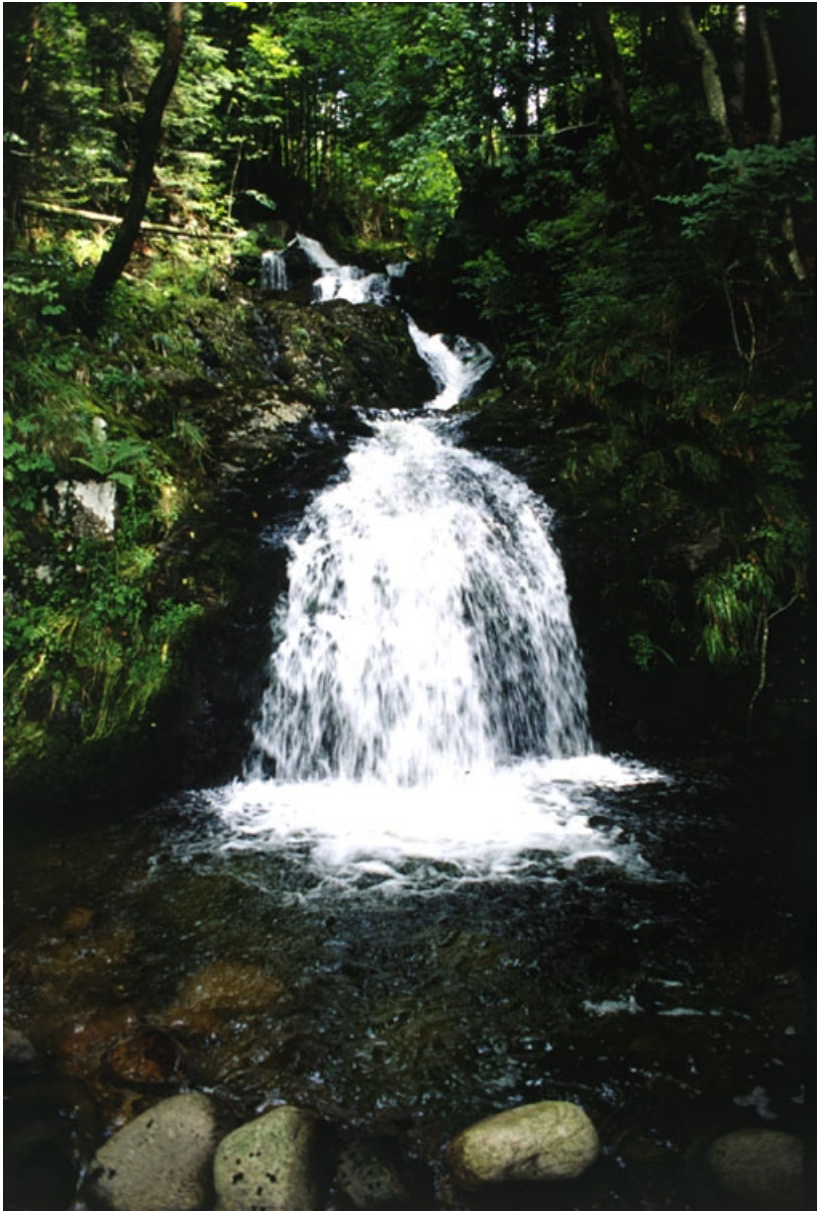
Chute en amont sur la Savoureuse.