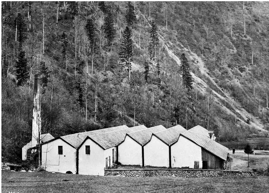
Société Anonyme de Filature et Tissage de Giromagny. Le tissage de la Papeterie.