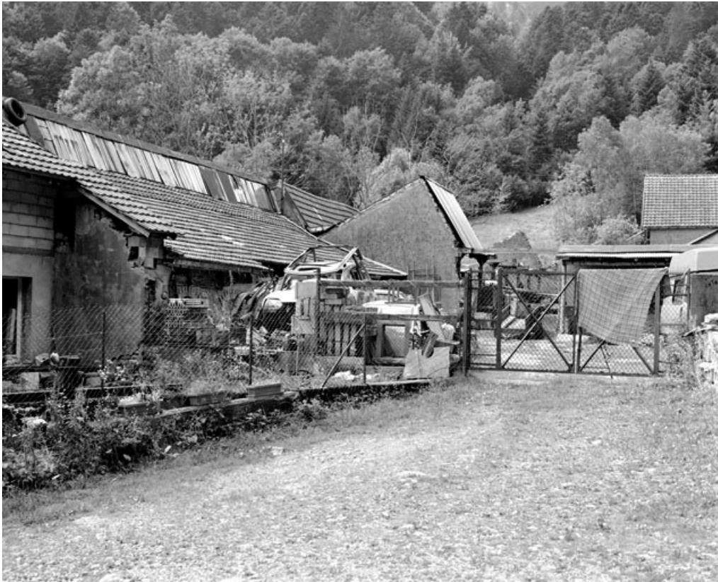
Vestiges de l'atelier de fabrication.