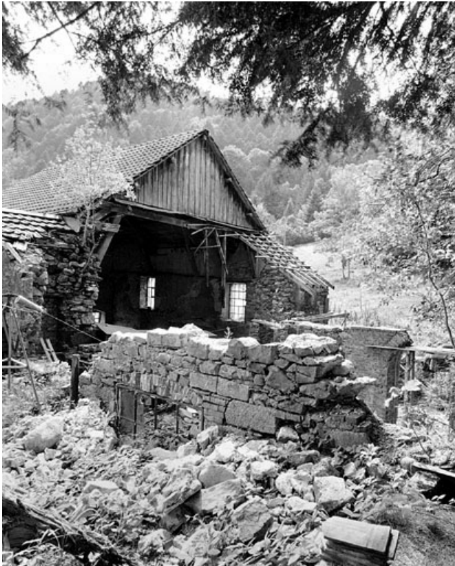
Vestiges de la salle des machines.