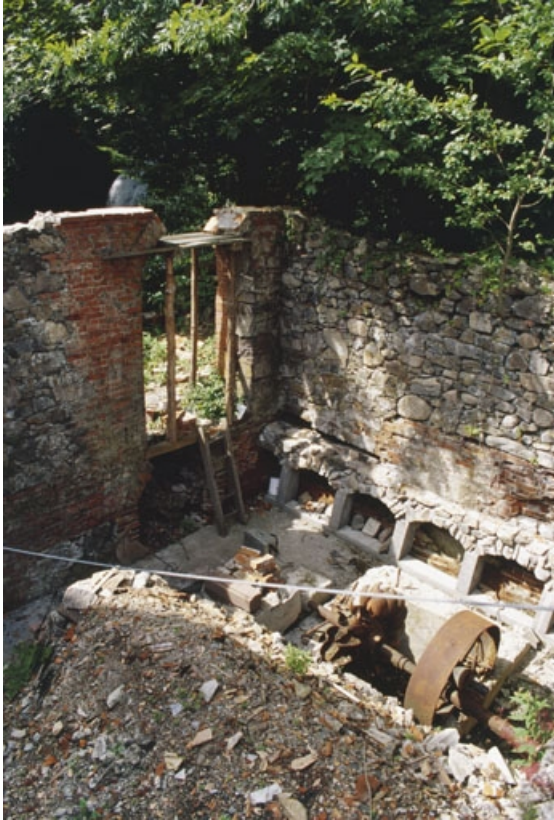
Vestiges de la salle des machines (postérieurement convertie en bâtiment d'eau ?). 90, Lépoux, lieudit : Malvaux