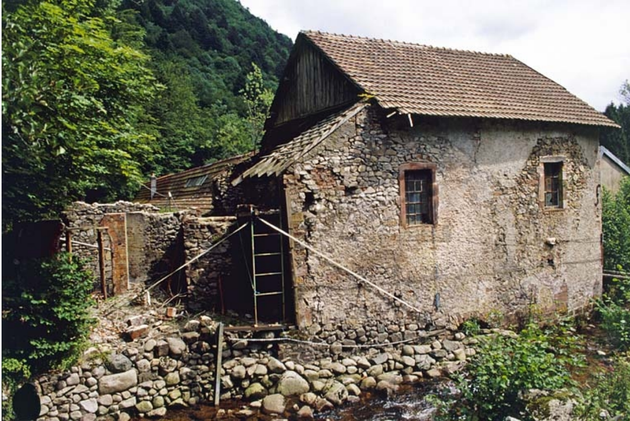
Vestiges de la salle des machines et bâtiment à usage inconnu.