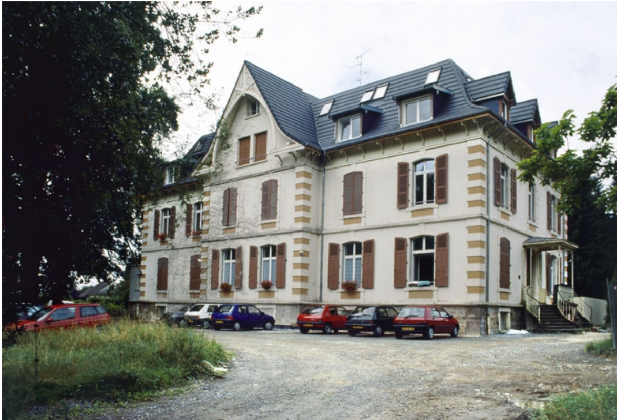
Logement patronal vu de trois quarts.