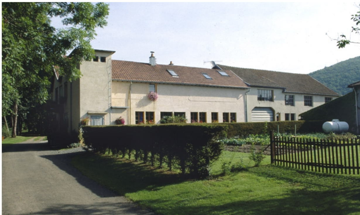
Atelier de fabrication nord depuis la rue.

90, Vescemont, 12, 14 rue de la Rosemontoise