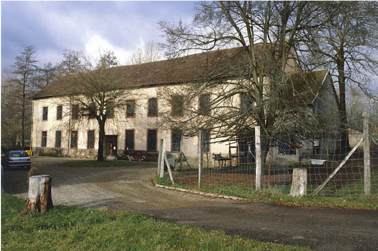
Façade antérieure de l'atelier de fabrication.

90, Saint-Germain-le-Châtelet rue du Moulin