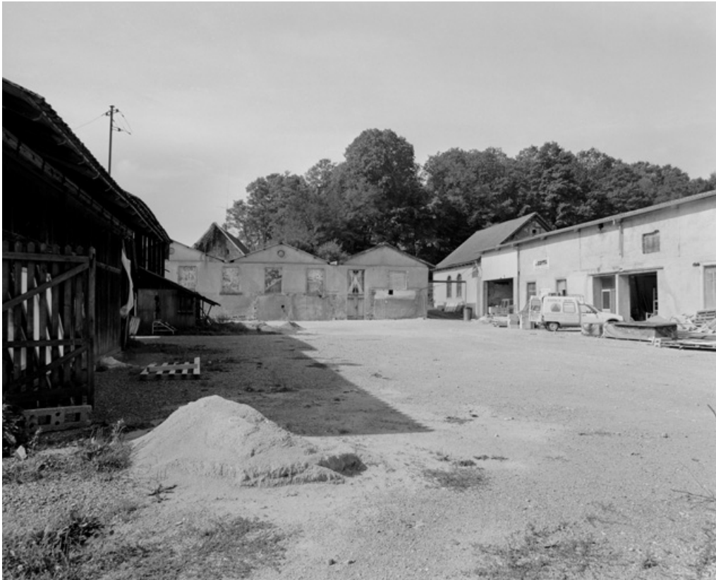
Atelier de fabrication et salle des machines depuis le nord.