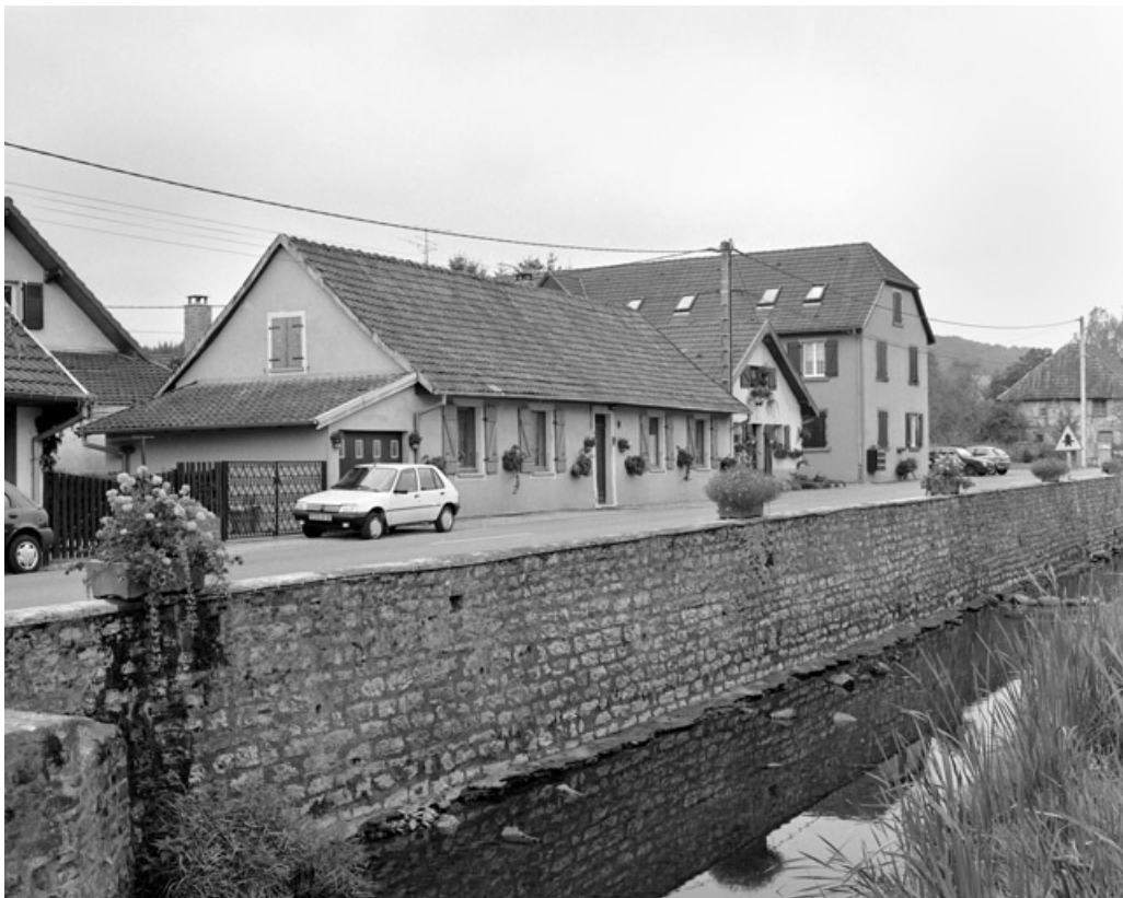
Vue de trois quarts des logements ouvriers.