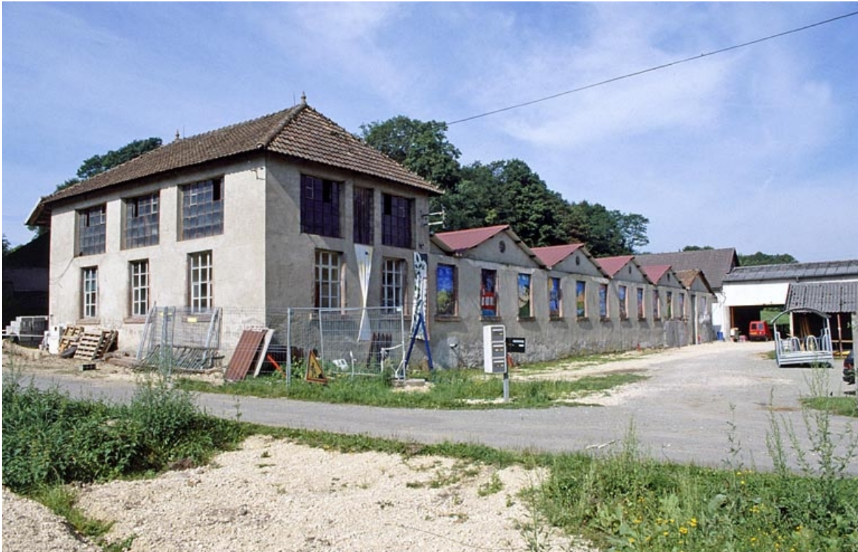
Vue d'ensemble depuis le nord-est.