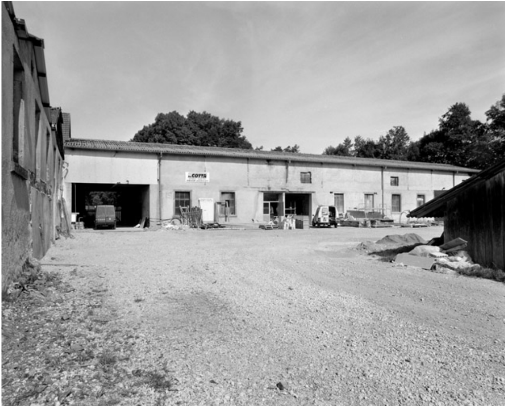
Atelier de fabrication ouest.