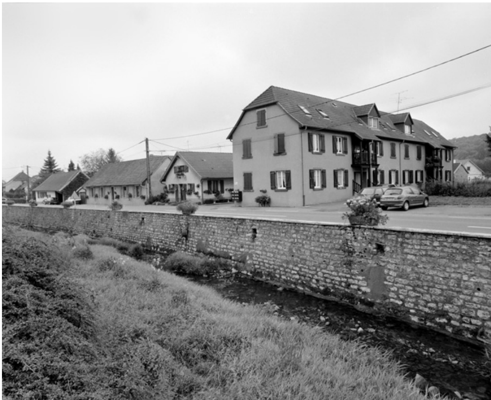
Vue d'ensemble des logements ouvriers.