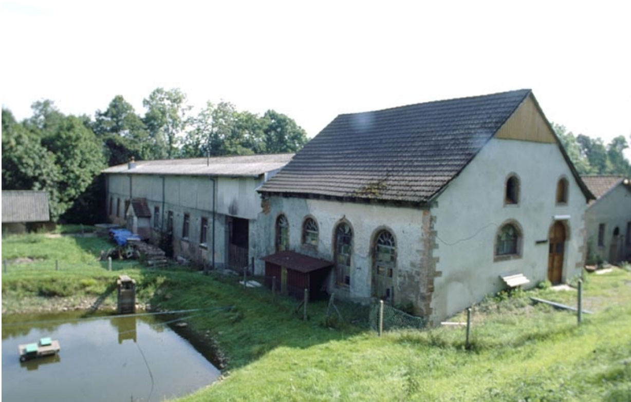
Vue de trois quarts de l'atelier de fabrication et de la salle des machines.