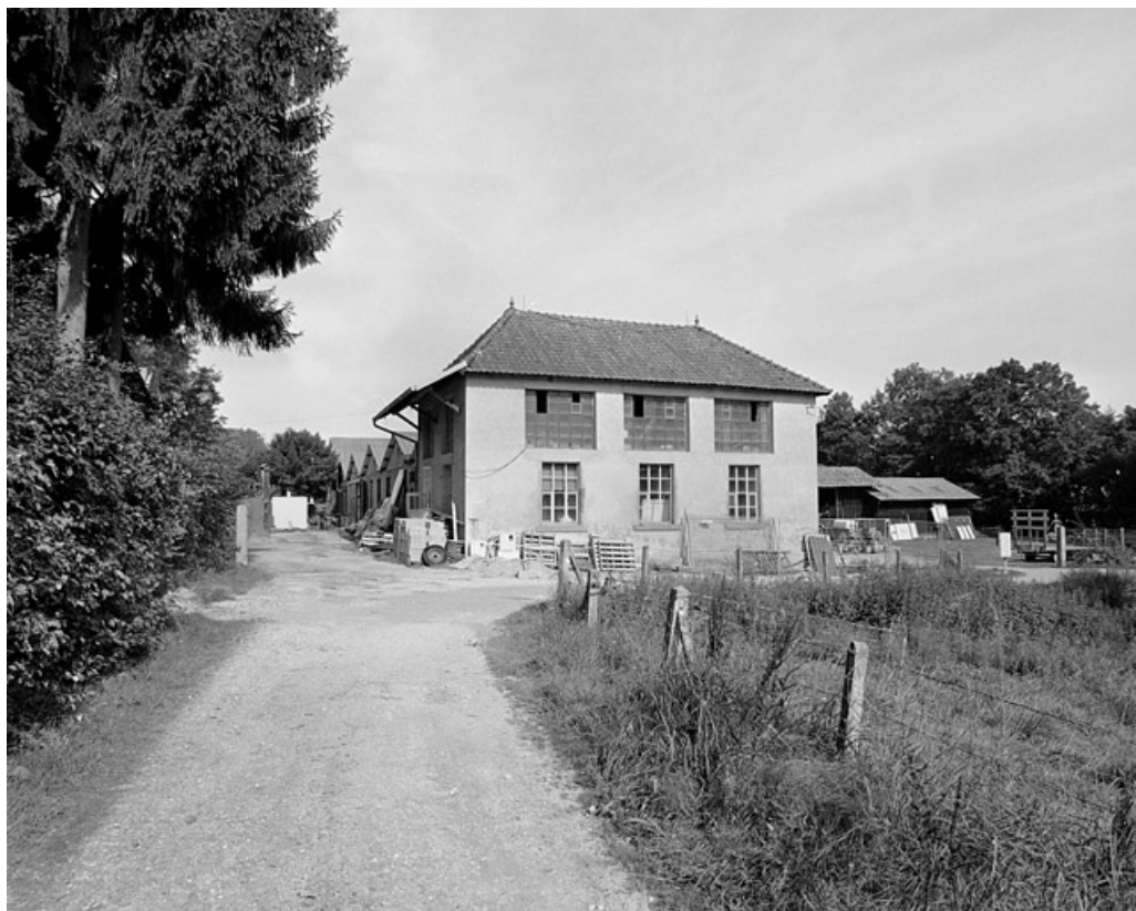
Atelier de réparation et bureau.