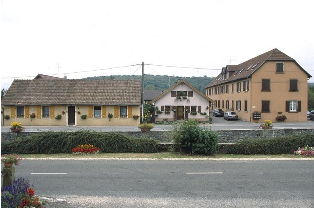
Logements ouvriers depuis le nord.